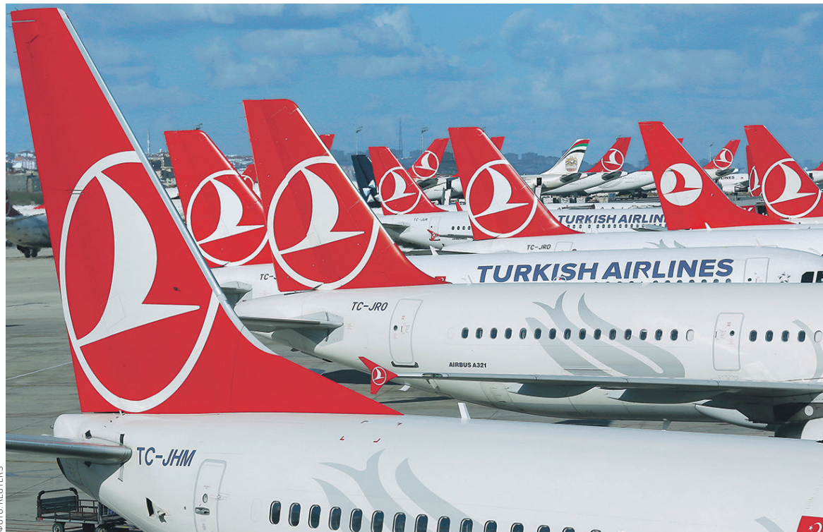
Уже 1 июля, на следующий день после отмены Владимиром Путиным запрета на продажу туров в Турцию, эта страна стала самой популярной по запросам пользователей на сервисе «Яндекс.Путешествия»

За первое полугодие 2016 года российский турпоток в Турцию сократился на 87,4%, до 183,8 тыс.