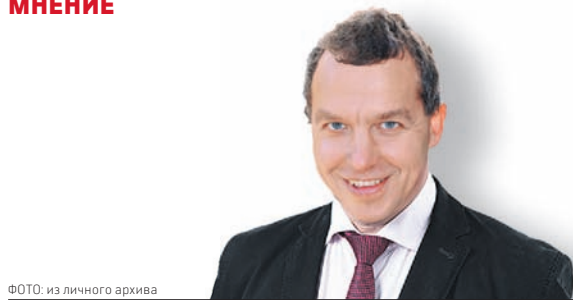
АНТОН ОЛЕЙНИК, профессор университета «Мемориал» (Канада)