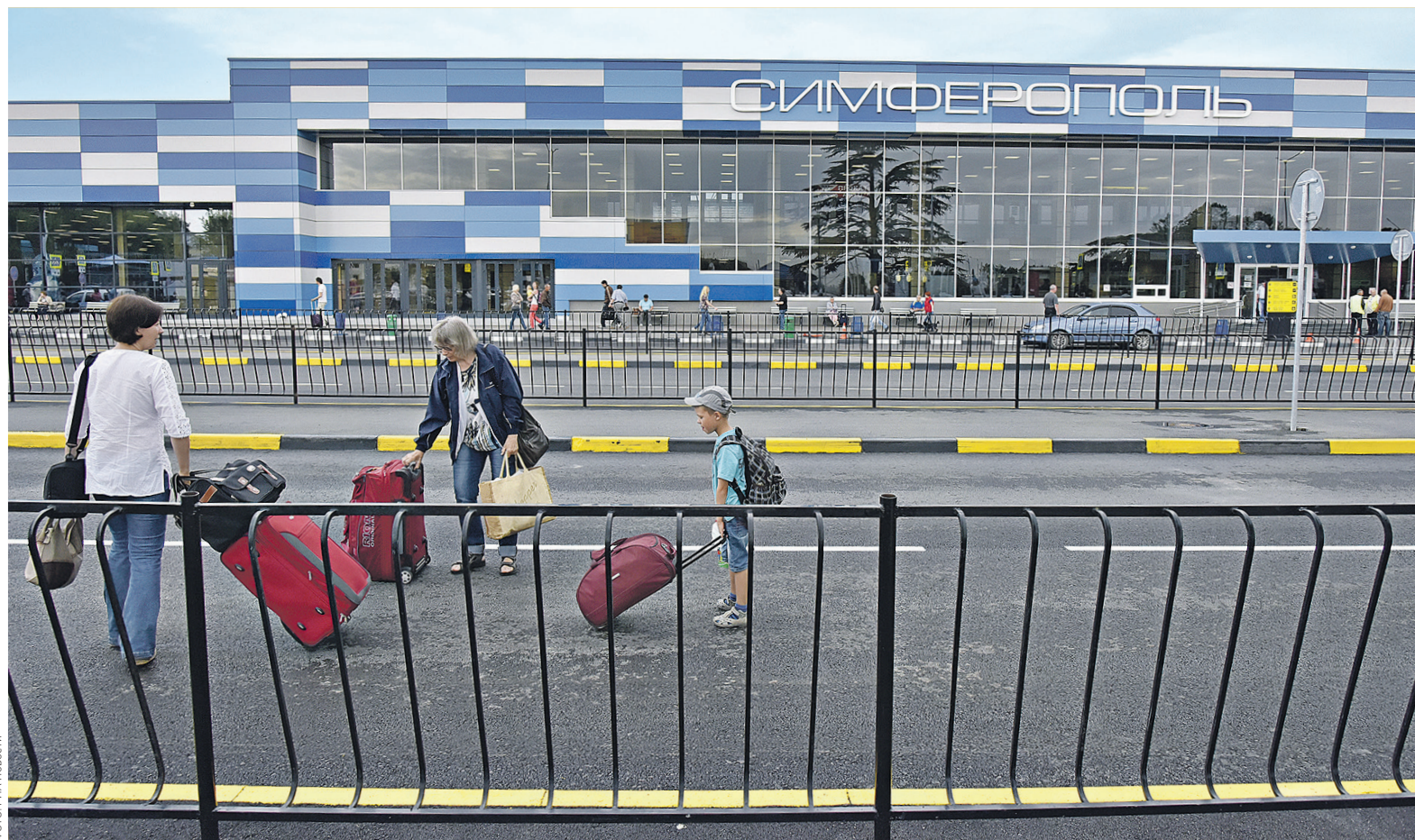
Новым владельцам симферопольского аэропорта власти передали все имущество, получив взамен 49-процентную долю