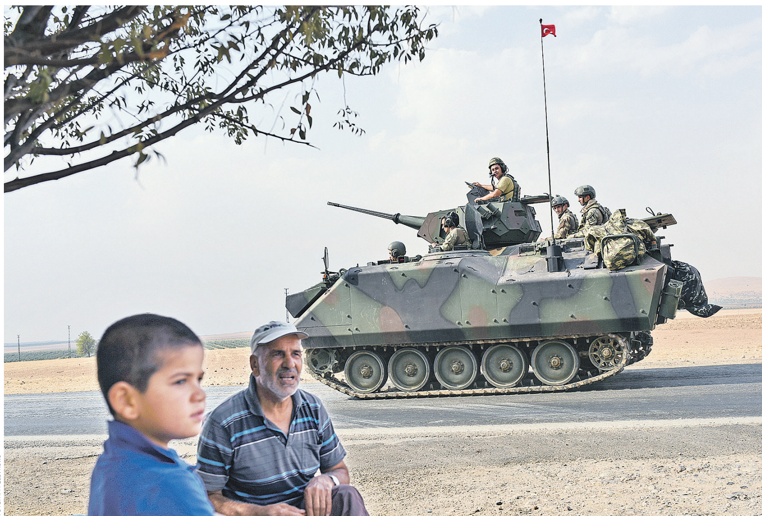
Продвигаясь на юг Сирии, турецкая армия, как и предполагали эксперты, столкнулась с силами курдов. На фото: турецкие танки выдвигаются к сирийской границе, 26 августа

Силы «Отрядов народной самообороны» неизвестны. Помимо курдских и протурецких сил