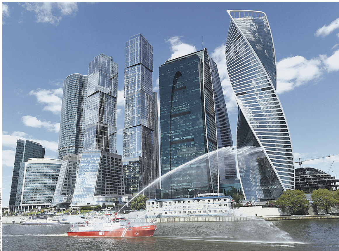
Многим компаниям и индивидуальным предпринимателям закрытие на 90 суток будет грозить на протяжении всех теплых месяцев года

По действующему закону закрытие на три месяца предусмотрено лишь для компаний, которые повторно нарушают ряд конкретных противопожарных требований — к водоснабжению на случай пожара, эвакуационным путям, аварийным выходам, системам пожаротуше-