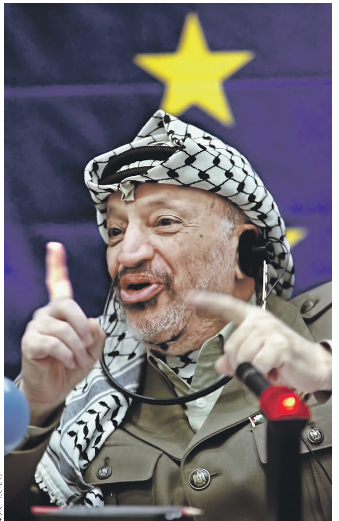
↑ Палестинский лидер Ясир Арафат (на фото) стал лауреатом премии мира в 1994 году вместе с израильским премьером Ицхаком Рабином и главой МИД Израиля Шимоном Пересом. Годом ранее Арафат и Рабин подписали соглашения, согласно которым палестинцы признавали право Израиля на мир и отказывались от террористической деятельности. Однако вскоре мирный процесс оказался в тупике: палестино-израильский конфликт продолжается до сих пор