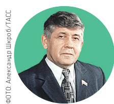
Юрий Лодкин, губернатор Брянской области

Срок: 85 дней (24 сентября — 18 декабря 1996 года) Причина отставки: был назначен на должность, ушел после проигранных выборов