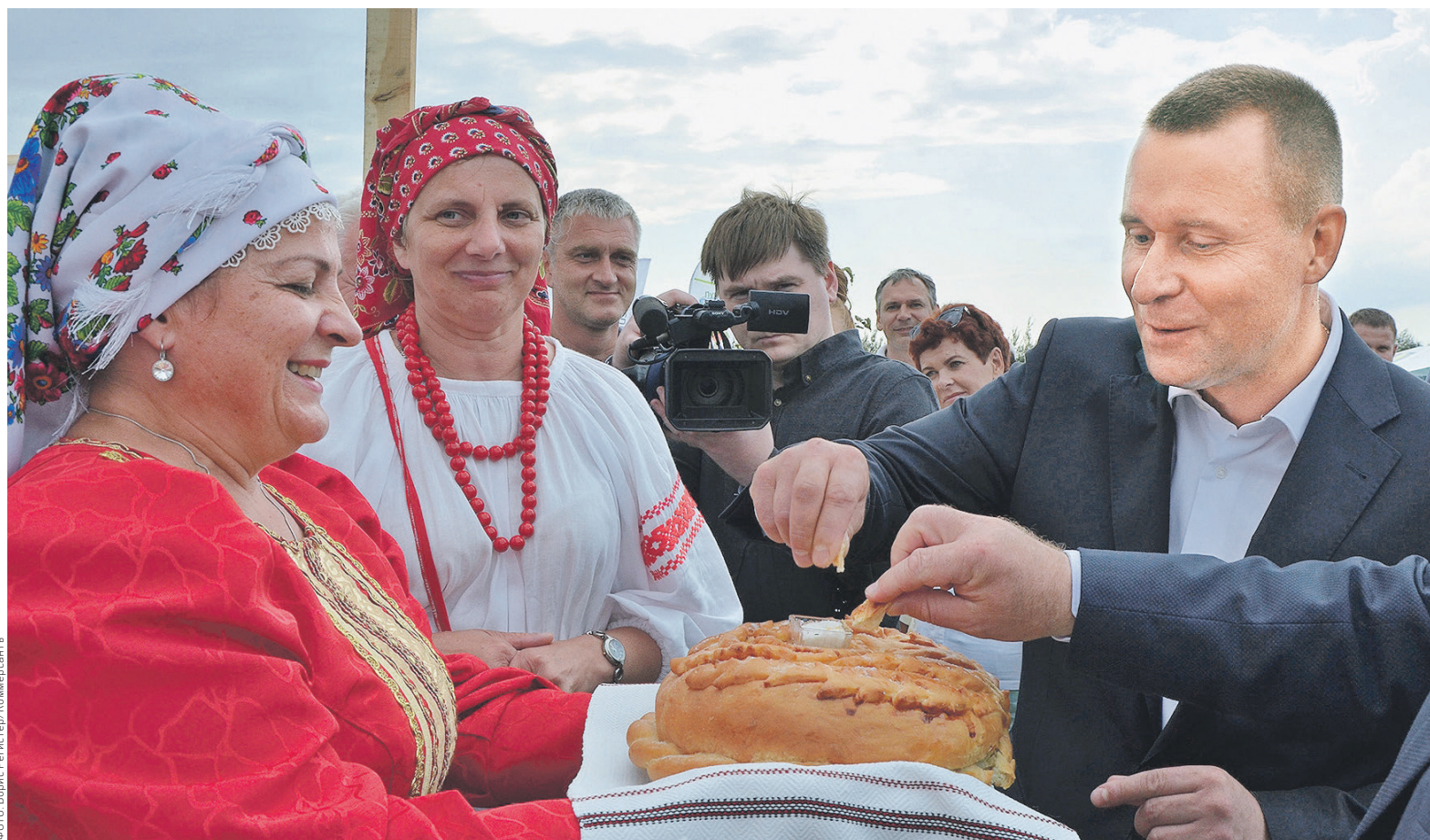
Люди из окружения Зиничева отмечают, что он не любил публичных мероприятий и редко общался с прессой