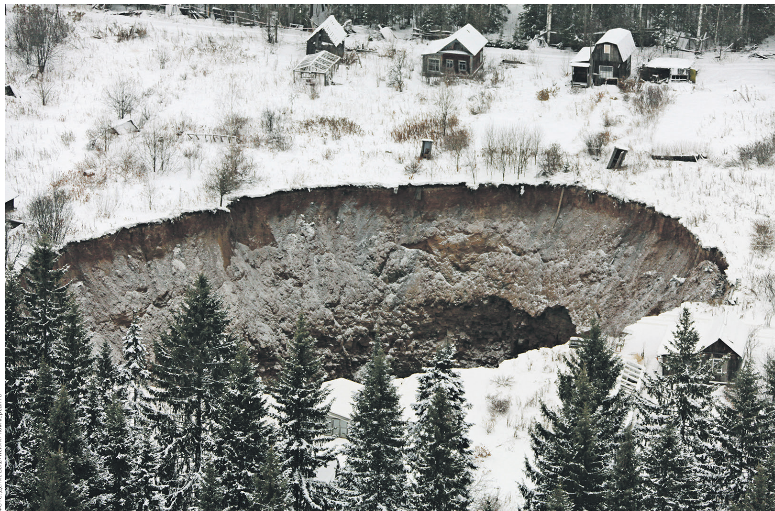
Генеральный директор «Уралкалия» Дмитрий Осипов сообщил, что компания готова к проверкам. На фото: провал, появившийся в ноябре 2014 года

Свою долю затрат на переселение жителей Березников «Уралкалий» полностью профинансировал еще в 2015 году, не дожидаясь перечисления денег федеральными и региональными властями, рассказал РБК генеральный директор «Уралкалия» Дмитрий Осипов. По его словам, эта сумма составила 2,5 млрд руб. из общего объема