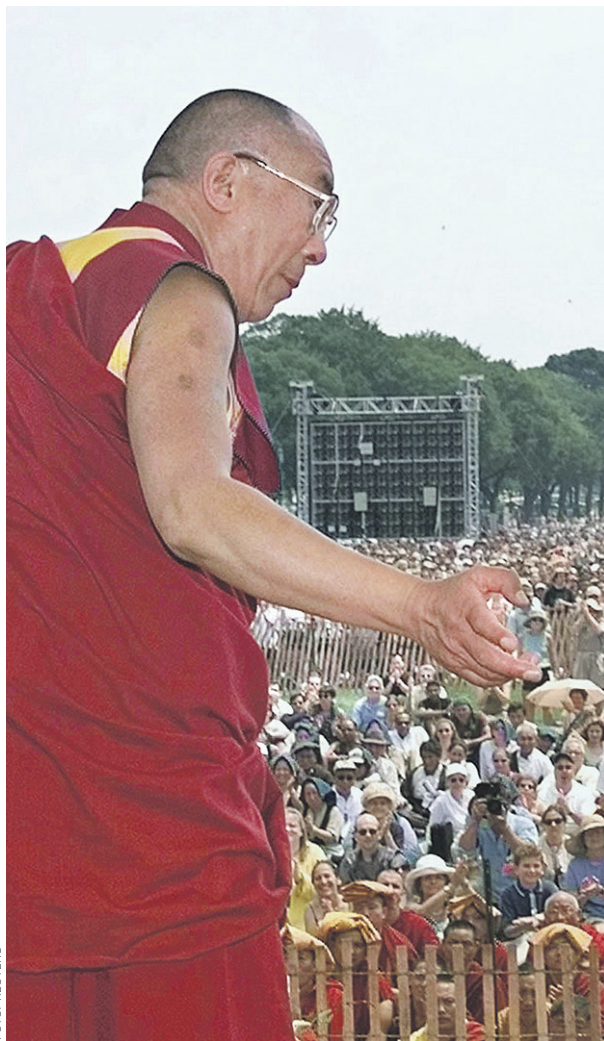
↑ Духовный лидер Тибета Далай-лама XIV получил премию мира в 1989 году за ненасильственную кампанию за прекращение доминирования Китая в Тибете. Китайские власти обвиняют далай-ламу в том, что он, прикрываясь религией, ведет деятельность, направленную на раскол Китая. В ответ на это он неоднократно заявлял, что не борется за независимость Тибета