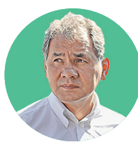
Сергей Шойгу, губернатор Московской области

Срок: 172 дня (19 июня — 8 декабря 1996 года) Причина отставки: был назначен на должность, ушел после проигранных выборов