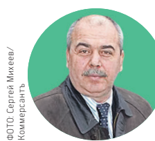
Александр Семернев, губернатор Брянской области

Срок: 152 дня (26 апреля — 25 сентября 1993 года) Причина отставки: отстранен президентом Б. Н. Ельциным от должности с формулировкой «за неподчинение»