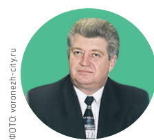
Александр Цапин, губернатор Воронежской области

Срок: 85 дней (24 сентября — 18 декабря 1996 года) Причина отставки: был назначен на должность, ушел после проигранных выборов