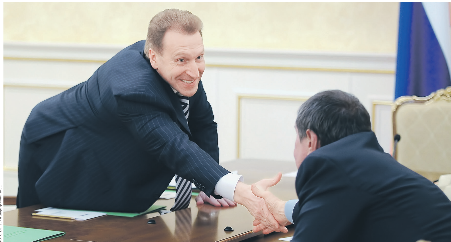
Директива о приватизации «Башнефти» была подписана еще 1 октября, на следующий день после того, как первый вице-премьер Игорь Шувалов объявил о возобновлении процесса продажи госпакета, говорят источники РБК. На фото: глава «Роснефти» Игорь Сечин (справа) и Шувалов