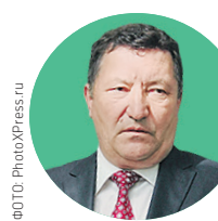
Олег Бетин, губернатор Тамбовской области

Срок: 179 дней (11 мая — 6 ноября 2012 года) Причина отставки: оставил пост в связи с назначением на должность министра обороны