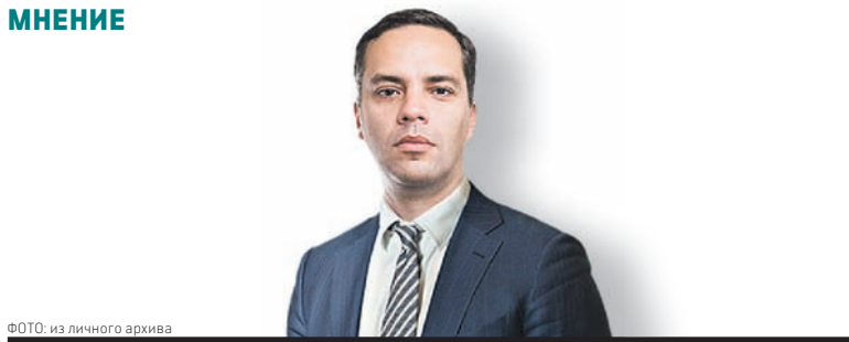
ФОТО: из личного архива ВЛАДИМИР МИЛОВ, директор Института энергетической политики