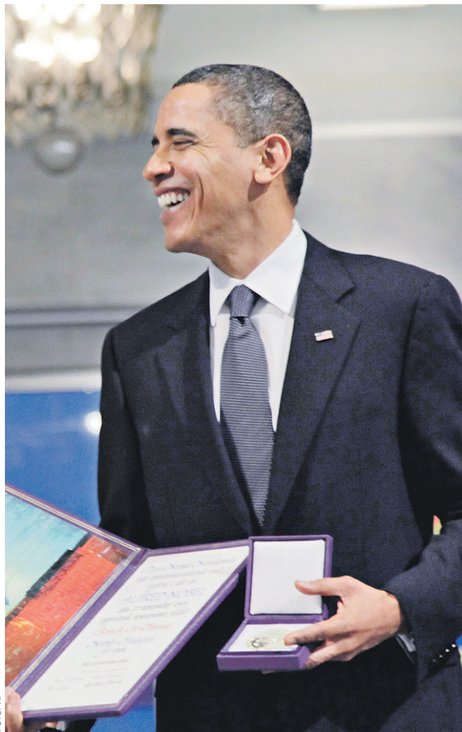
↑ Президент США Барак Обама получил премию мира в 2009 году — менее чем через год после вступления в должность. Во время предвыборной кампании он обещал вывести американские войска из Ирака, а в начале 2009 года пообещал добиться сокращения ядерных потенциалов. После вручения премии Обаму часто обвиняли в агрессивной внешней политике США и вмешательстве в дела других государств