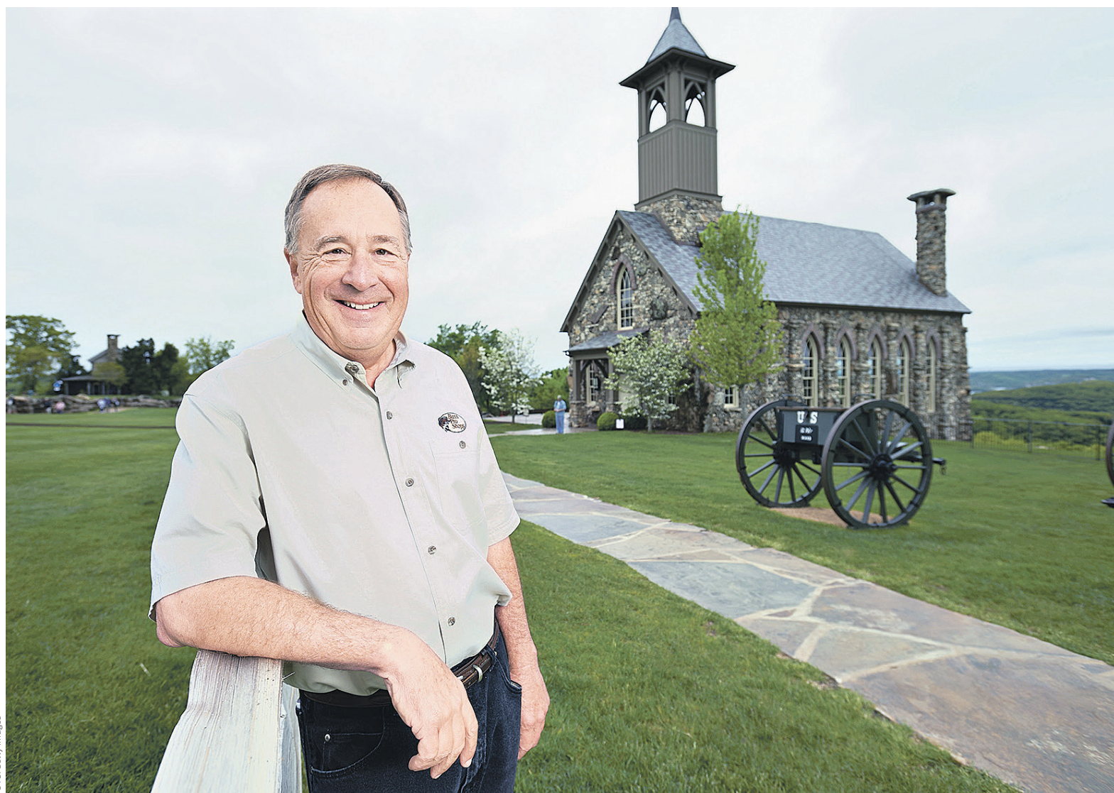
Владелец и директор Bass Pro Shops американец Джон Моррис занимает 148-строчку рейтинга богатейших американцев с состоянием $3,9 млрд

Основателем, владельцем и директором Bass Pro Shops явля-