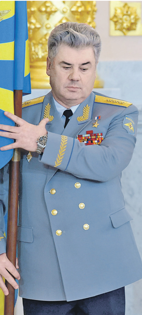
↑ Главнокомандующий ВКС Виктор Бондарев — вероятный новый глава оборонного комитета СФ