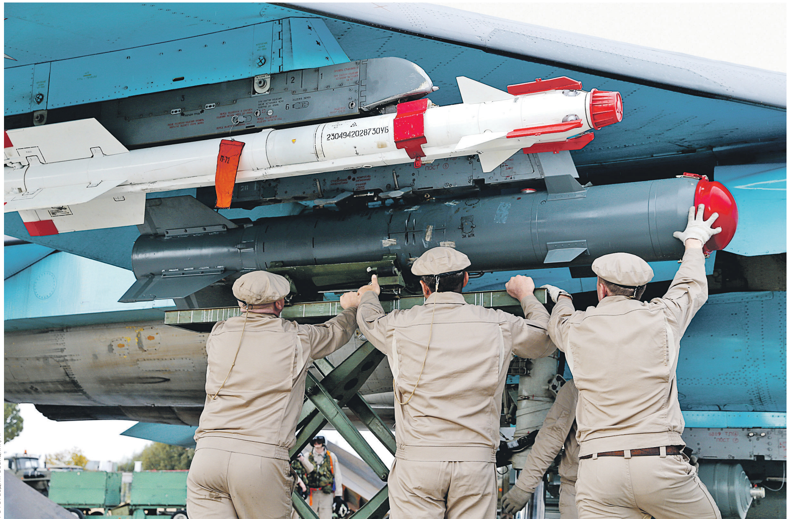
Среди типов вооружений наибольшая доля в экспорте России в 2016 году пришлась на военные самолеты

Цифры по экспорту вооружений, собранные Jane's, отражают состоявшиеся в отчетном году поставки, а не заключенные контракты, предполагающие поставку в будущем. Стоимость оружия выражена в постоянных долларах США.