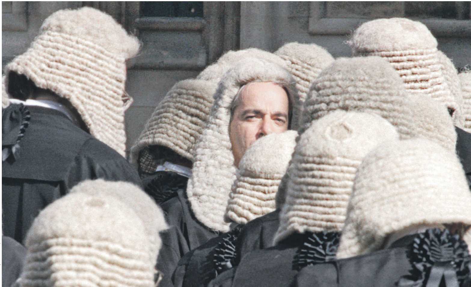
Бизнес-споры Высокий суд Лондона обычно рассматривает в течение нескольких месяцев, отмечают юристы