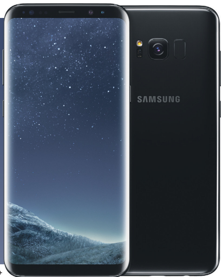
Galaxy S8 | S8+

Новости, банковские операции, общение – все это перешло в мобильные устройства. Новинки от Samsung, связанные в единую экосистему, удовлетворяют все потребности современного человека.