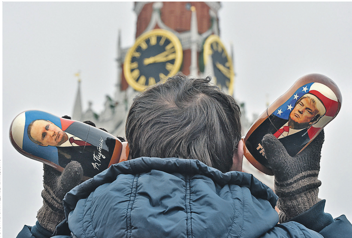
Работа над пакетом ответных мер, по словам представителей российских властей, уже идет

«Законопроект, который мы только что провели <...> закручивает гайки для наших самых опасных