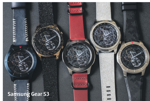
Samsung Gear S3

«Это новый этап развития smart watch*, который понравится как ценителям часов, так и любителям технологий», – считает президент по глобальному маркетингу подразделения мобильных коммуникаций Samsung Йонгхи Ли. Таким образом Samsung Gear S3 в компании со смартфонами Galaxy S8 | S8+ и портативной док-станцией Samsung DeX представляет собой связку, способную удовлетворить потребности в мобильном офисе практически любого современного человека.