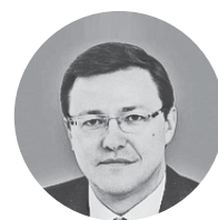
Дмитрий Азаров Совет Федерации Федерального Собрания РФ