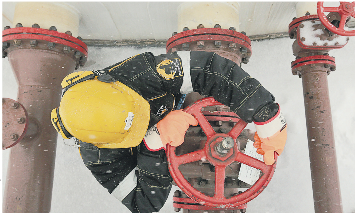
«Роснефть» и «Транснефть» достигли компромисса в вопросе нормативов технологических потерь нефти в системе трубопроводов

«Роснефть» раскрыла, что подписала договор на 2017 год на транспортировку 180,546 млн т своей нефти. Также подписан договор на прокачку нефти и нефтепродуктов «Башнефти» через «Транс-