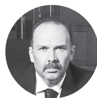
Михаил Мень Министерство строительства и ЖКХ РФ