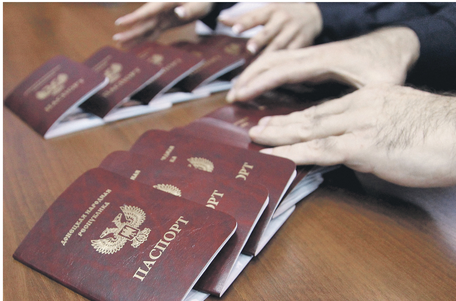
Указ президента легализовал в России удостоверения личности, дипломы, документы о рождении и подтверждении профессиональной квалификации, свидетельства о смерти, выданные структурами самопровозглашенных ДНР и ЛНР

Российский и украинский министр выразили приверженность плану, направленному на снижение напряженности на востоке Украины и согласились продолжить политические переговоры, заявил по итогам встречи ми-