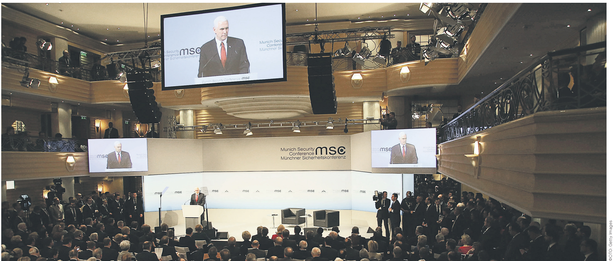
Вице-президент США Майк Пенс, для которого выступление на мюнхенской конференции стало первым большим внешнеполитическим мероприятием, уверил собравшихся, что США «будут непоколебимы» в своей приверженности НАТО

ДИПЛОМАТИЯ О чем говорили на конференции по безопасности в Мюнхене