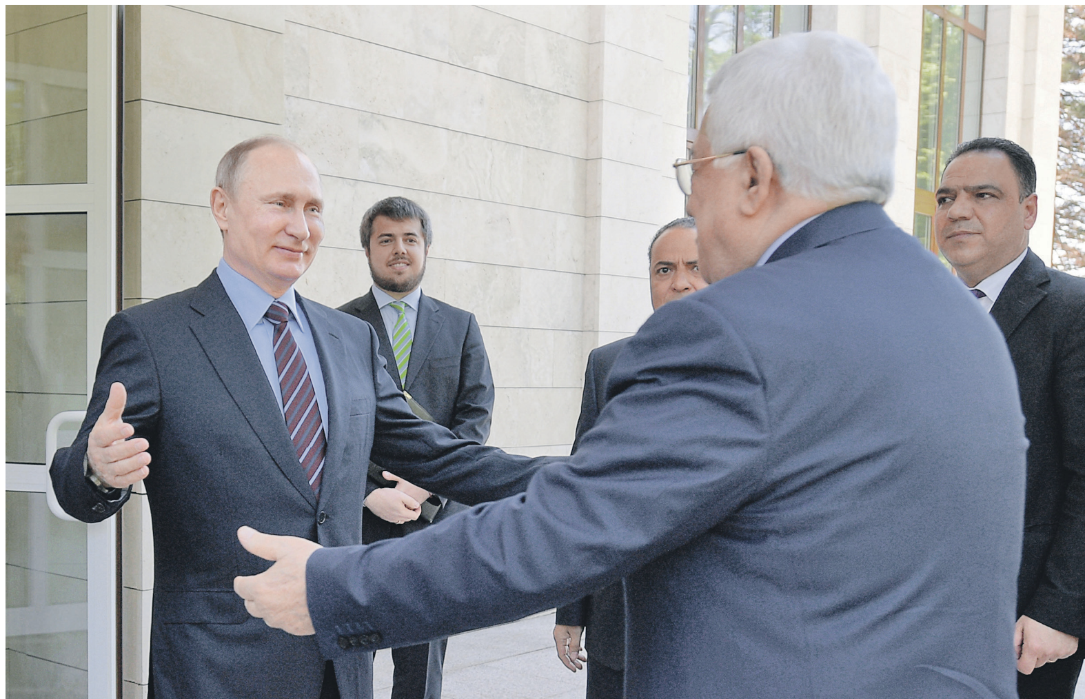
Лидер Палестины Махмуд Аббас (на фото справа) по итогам переговоров с президентом РФ Владимиром Путиным подчеркнул роль России в разрешении конфликта между палестинцами и израильтянами: «Невозможно урегулировать палестинскую проблему без реального участия России»