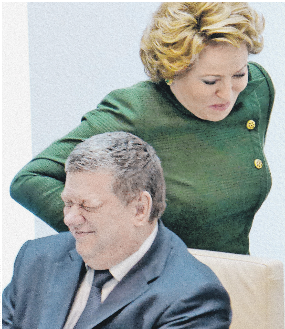
Законопроект о налогообложении самозанятых предполагает, что налог будет уплачиваться в виде патента. На фото: один из авторов инициативы, сенатор Евгений Бушмин, и председатель Совета Федерации Валентина Матвиенко

Размер патента, порядок его уплаты и определения налоговой базы будет устанавливаться отдельно в каждом регионе, следует из пояснительной записки. При этом самозанятые также авансом на год будут уплачивать страховые взносы по пониженной ставке — 5% МРОТ в месяц (3% — на пенсионное страхование, 2% — на меди-