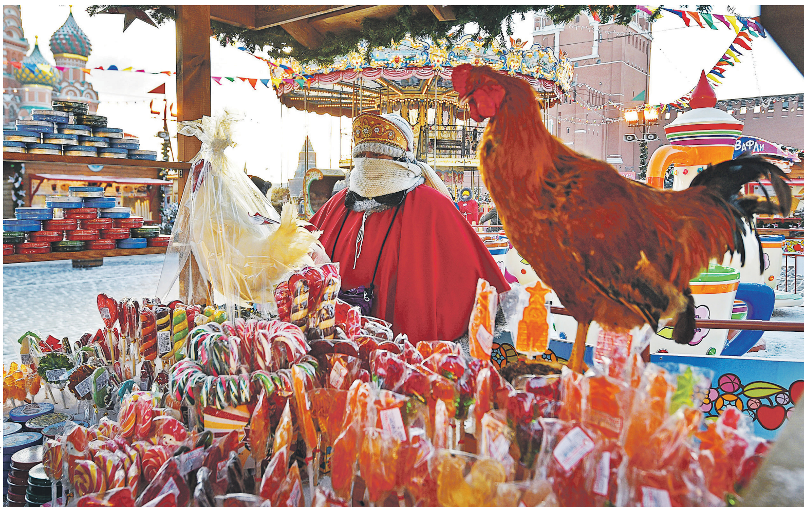
Позиция Верховного суда особенно актуальна для тех ИП, у которых обороты исчисляются миллионами рублей, а чистая прибыль — в разы меньше. Это, например, характерно для торгового бизнеса