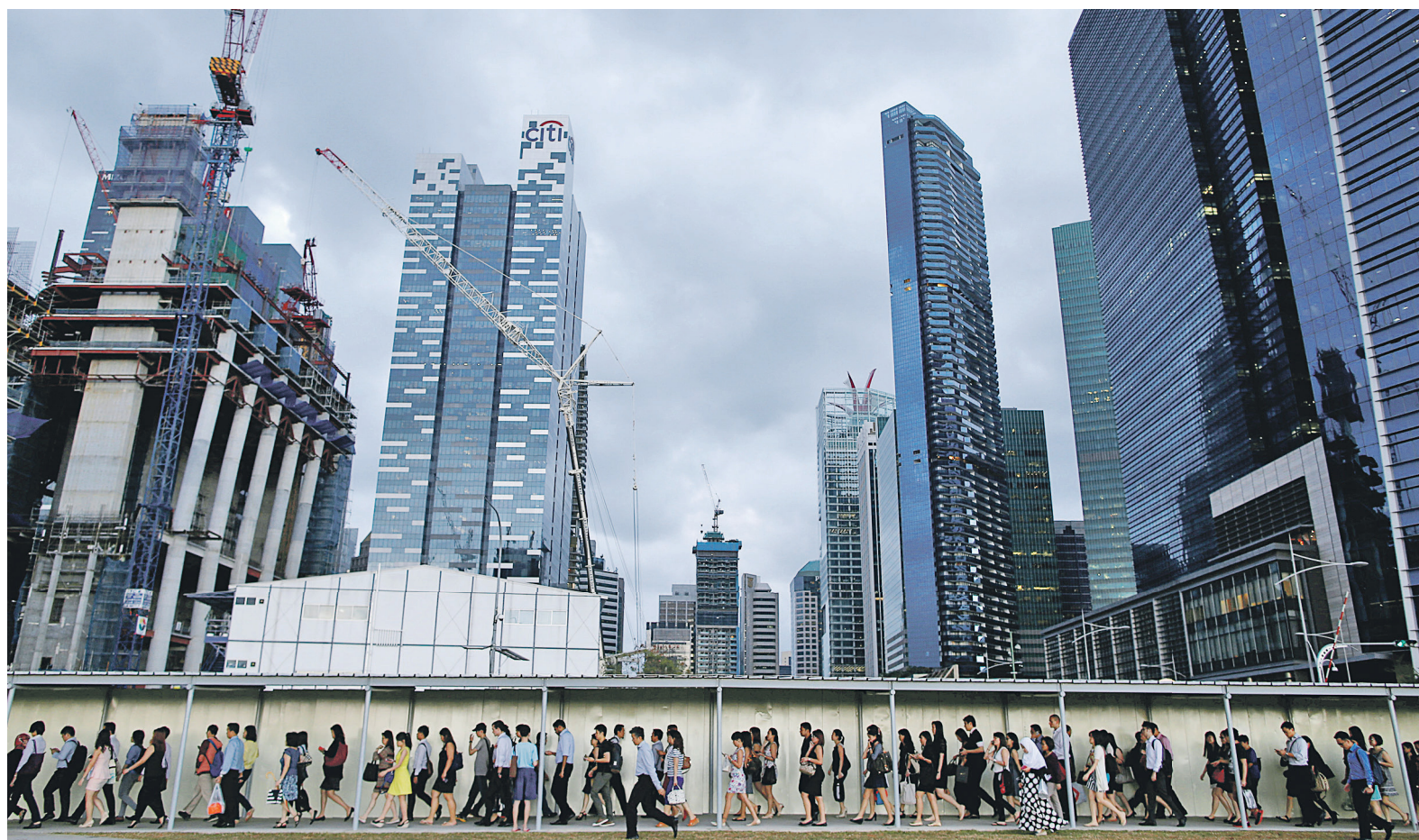
Компании решаются перейти на четырехдневку не только для того, чтобы привлечь сотрудников, которым нравится такой график, объясняют эксперты. Главная их задача — увеличить производительность труда

Впрочем, на трехдневный уик-энд в Google пока не решились. Вместо этого компания много лет практиковала «политику 20%», когда разработчики могли один день в неделю заниматься проектами по своему усмотрению, без согласования с начальством. Именно эта политика привела к появлению таких знаменитых продуктов, как