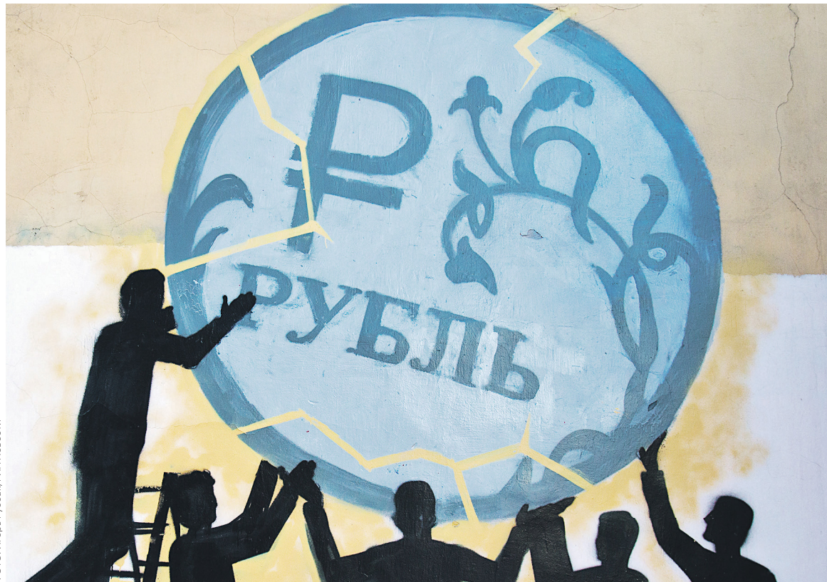
В правительстве неоднократно заявляли, что рубль «переукреплен». Ослабление национальной валюты произойдет уже во втором-третьем квартале этого года, отмечал глава Минэкономразвития Максим Орешкин

Доллар в пятницу, 12 мая, закрылся на отметке 57,085 руб. по итогам торгов. Баррель нефти марки Brent стоил около $50,8.