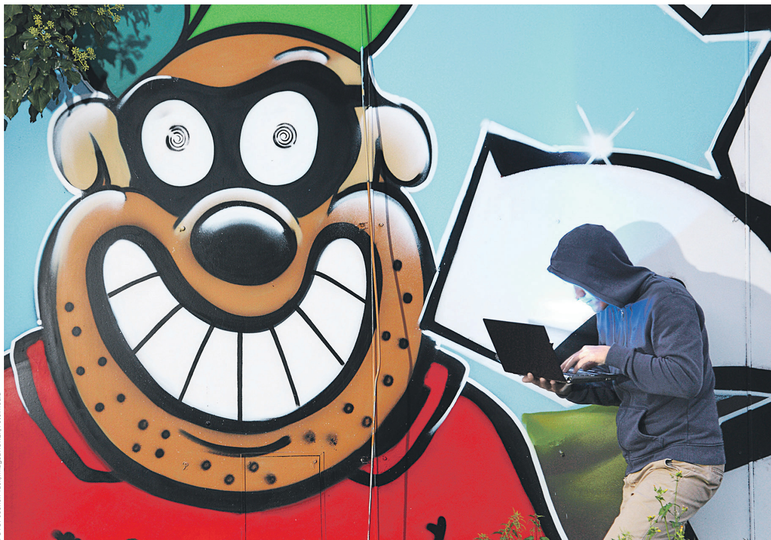
Хакерскую атаку на компьютеры по всему миру, произошедшую 14 мая, представитель «Лаборатории Касперского» назвал «нерядовой», а глава Европола — «беспрецедентной»

Представитель «Лаборатории Касперского» указал на мощный масштаб атаки и назвал ее «нерядовой». Глава Европола Роб Уэйнрайт в воскресенье, 14 мая, использовал эпитет «беспрецедентная». При этом глава Европола ого-