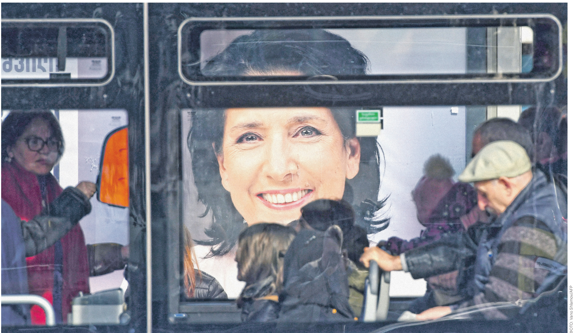
Формально Саломе Зурабишвили является независимым кандидатом, но поддержку ей оказывает правящая в стране с 2012 года «Грузинская мечта» и ее лидер — самый богатый человек Грузии Бидзина Иванишвили