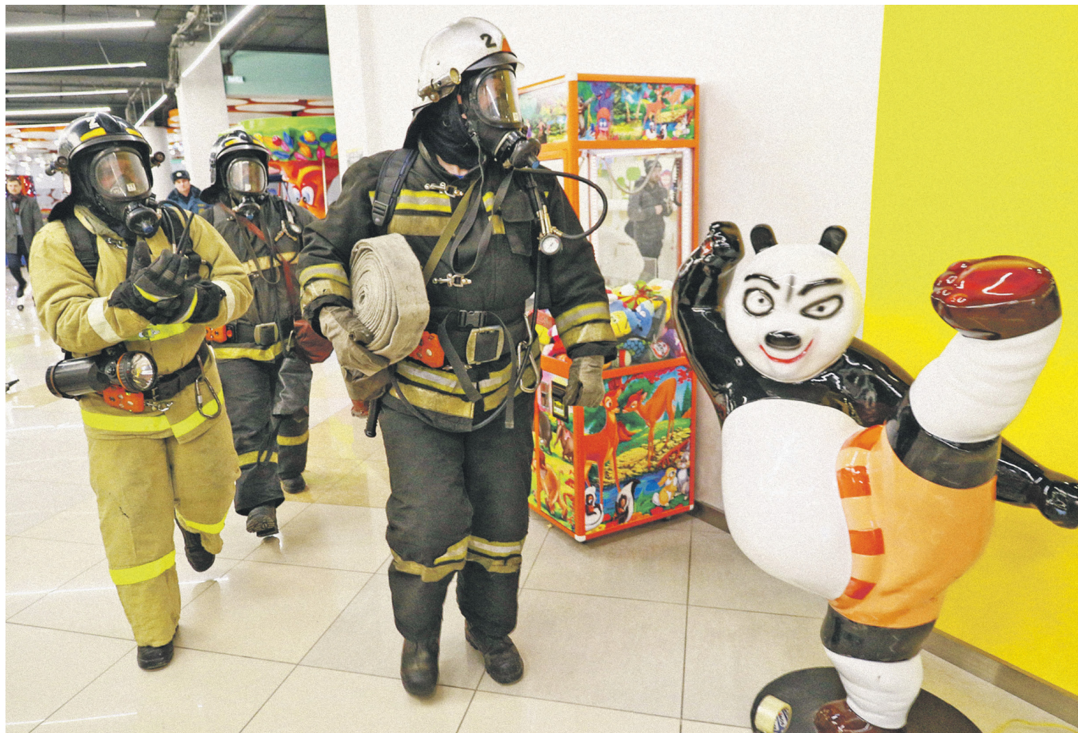
4,5 тыс. сотрудников и посетителей были эвакуированы вчера из московских ТЦ — «Европейский», «Капитолий», «Атриум», «Горбушкин двор», «Мегаполис», «Цветной», «Звездочка», «Город» и «Вива» — после анонимных звонков об угрозе взрыва

По его словам, телефонные террористы также атаковали горячую линию ФСБ, на которую поступала информация о взрывных устройствах, заложенных в образова-