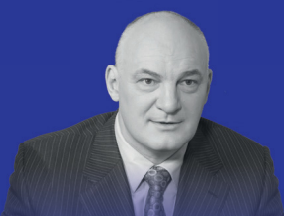
ЮРИЙ ПРИЛУЧКИН Президент РАКИБ