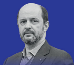
ГЕРМАН КЛИМЕНКО Советник Президента РФ по развитию Интернета

К ВЫСТУПЛЕНИЮ С ДОКЛАДАМИ НА КОНГРЕССЕ ПРИГЛАШЕНЫ ВЕДУЩИЕ ЭКСПЕРТЫ В ОБЛАСТИ ЦИФРОВОЙ ЭКОНОМИКИ, А ТАКЖЕ СПЕЦИАЛИСТЫ-ПРАКТИКИ ПО ЭКОНОМИКЕ, ФИНАНСАМ, ПРАВУ, ИНВЕСТИЦИЯМ И ИНФОРМАЦИОННЫМ ТЕХНОЛОГИЯМ.