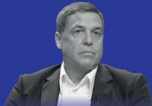
АЛЕКСАНДР ЛЮБИМОВ Журналист, продюсер, медиаменеджер