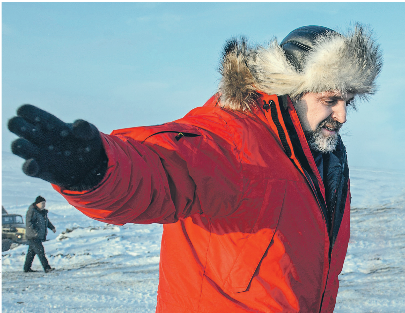
В ближайшей перспективе в российской арктической зоне планируется лицензировать шесть газовых участков, заявлял РБК министр природных ресурсов Сергей Донской