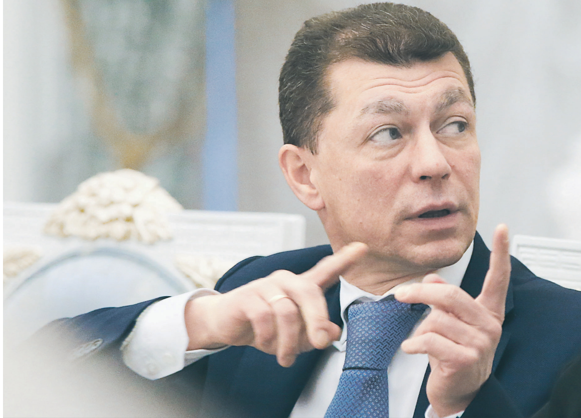
Ведомство Максима Топилова совместно с ЦБ, Генпрокуратурой и страховщиками пришли к единому мнению в отношении продуктов инвестиционного страхования жизни

Одним из обратившихся в Минтруд за разъяснениями стала компания «Сбербанк Страхование жизни», рассказал РБК представитель страховщика. «Поводом для этого стало сообщение о лишении председателя собрания депу-