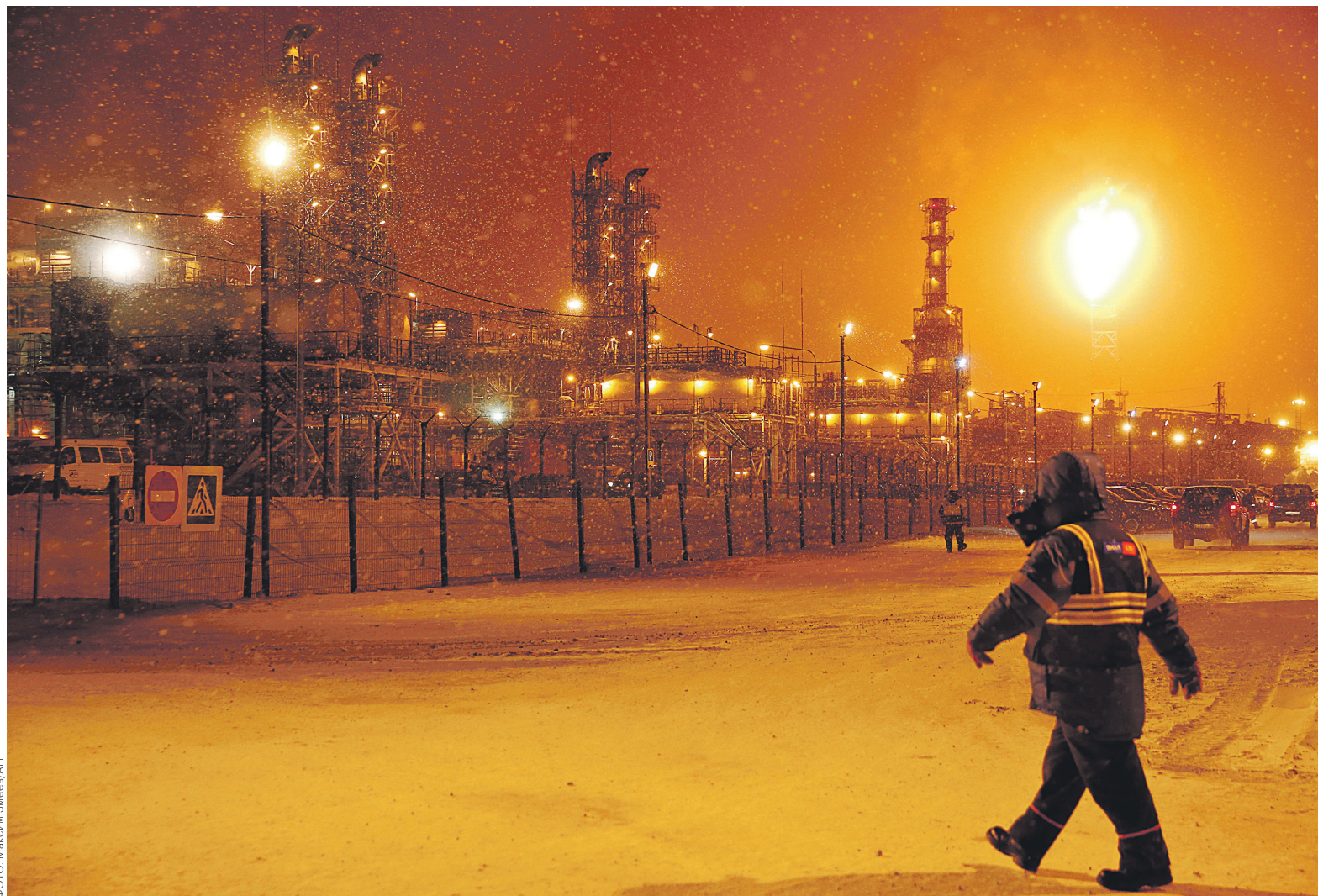
У НОВАТЭКа уже есть СПГ-проект за Полярным кругом — в декабре была запущена первая очередь завода «Ямал СПГ» (на фото) мощностью 5,5 млн т в год

В 2017 году Россия произвела и экспортировала 10,9 млн т СПГ с проекта «Сахалин-2», что на 0,8% больше, чем годом раньше. В декабре 2017 года была запущена первая очередь завода НОВАТЭКа «Ямал СПГ» — первого в мире СПГ-проекта за полярным кругом — мощностью 5,5 млн т в год (по данным Oil Industry Insight, в 2017 году производство СПГ в мире составило 290 млн т). На церемонии отгрузки первой партии СПГ с этого завода присутствовал президент Владимир Путин, который поручил правительству определить основные направления в политике производства СПГ, которые помогут России стать одним из лидеров