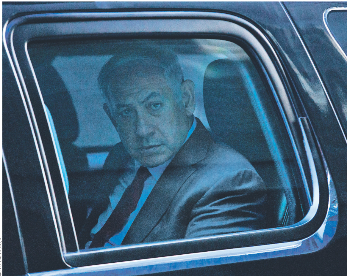
Премьер-министр Израиля Биньямин Нетаньяху (на фото), ознакомившись с рекомендациями полиции, назвал их «документом оголтелым и дырявым, как швейцарский сыр»

По «делу 1000» Нетаньяху подозревают в получении подарков на сумму не менее 1 млн шекелей ($280 тыс.) от голливудского продюсера, гражданина и резидента Израиля Арнона Милчена и австралийского предпринимателя Джеймса Пакера. По собранным полицией данным, Нетаньяху получал от Милчена сигары, шампанское и предметы роскоши, таким образом последний расплачивался за помощь премьера при получении долгосрочной американской визы. Кроме того, как утверждает в официальном заявлении полиции, Нетаньяху активно продвигал так называемый закон Милчена, который на десять лет освобождал