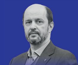
ГЕРМАН КЛИМЕНКО Советник Президента РФ по развитию Интернета

К ВЫСТУПЛЕНИЮ С ДОКЛАДАМИ НА КОНГРЕССЕ ПРИГЛАШЕНЫ ВЕДУЩИЕ ЭКСПЕРТЫ В ОБЛАСТИ ЦИФРОВОЙ ЭКОНОМИКИ, А ТАКЖЕ СПЕЦИАЛИСТЫ-ПРАКТИКИ ПО ЭКОНОМИКЕ, ФИНАНСАМ, ПРАВУ, ИНВЕСТИЦИЯМ И ИНФОРМАЦИОННЫМ ТЕХНОЛОГИЯМ.