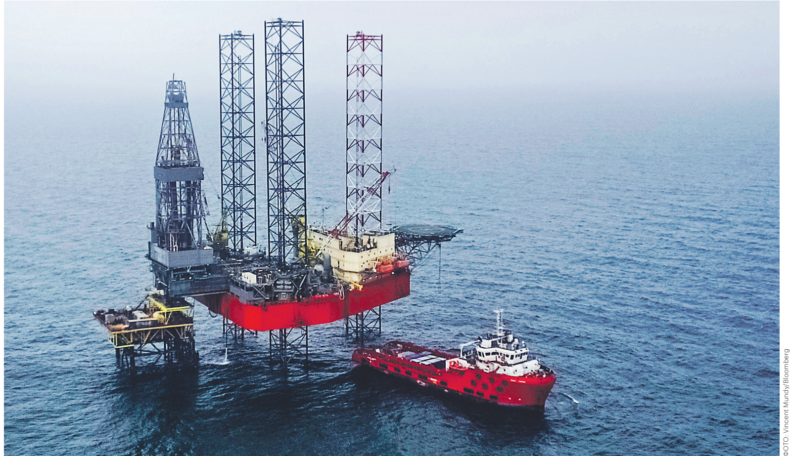
Одесское газовое месторождение обеспечивает Крым почти половиной собственной добычи газа

Определение такой границы далеко не всегда является триви-