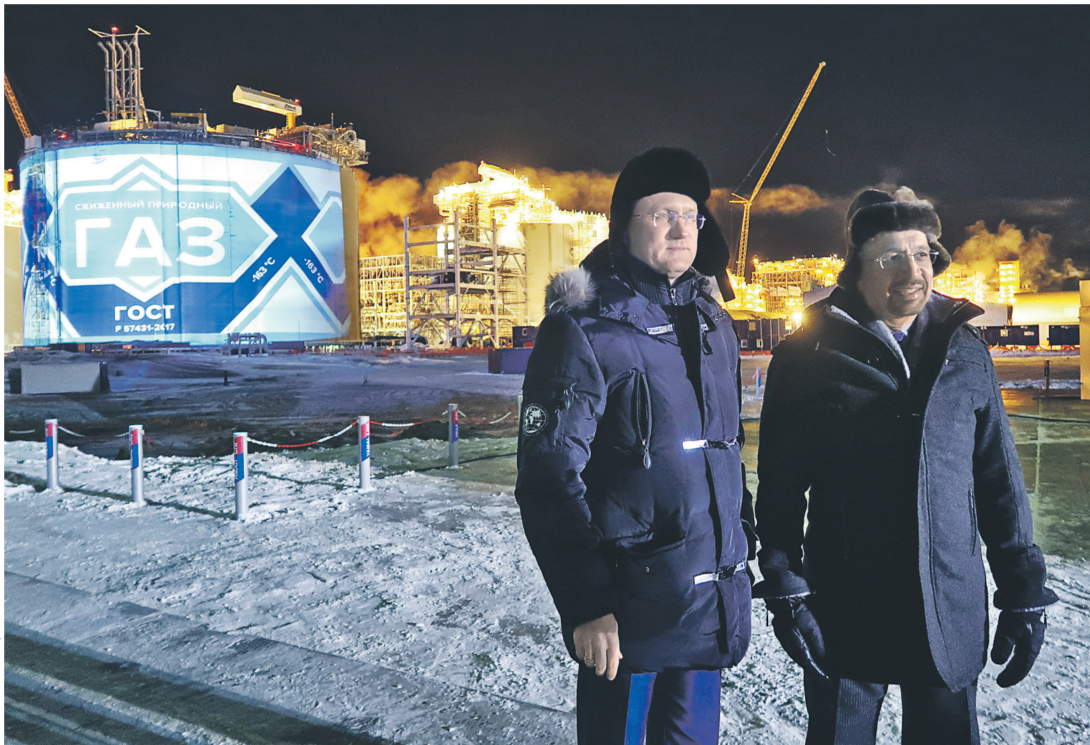
Переговоры о вхождении Саудовской Аравии в российский СПГ-проект начались в декабре 2017 года, когда министр энергетики России Александр Новак (слева) и министр энергетики Саудовской Аравии Халид аль-Фалих (справа) посетили завод «Ямал СПГ»