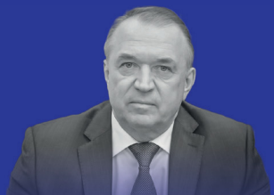
СЕРГЕЙ КАТЫРИН Президент ТПП РФ