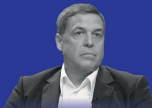
АЛЕКСАНДР ЛЮБИМОВ Журналист, продюсер, медиаменеджер