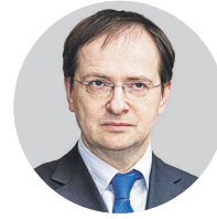
ВЛАДИМИР МЕДИНСКИЙ, министр культуры

Минкультуры меняет условия поддержки гастролей театров