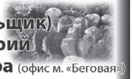
График работы 5/2. Бесплатные обеды.