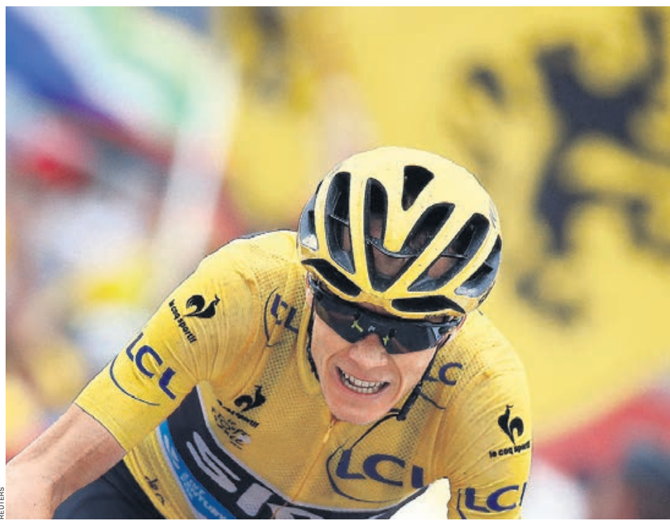
Способность Криса Фрума отрываться от соперников на подъемах породила разговоры о том, что без помощи техники такая прыть невозможна

Тут нужно сказать, что у Лемонда репутация человека, имеющего чутье на выявление ситуаций, когда кто-то из велогонщиков хитрит. Ведь именно Лемонд еще в 2001 году взял и заявил, что Лэнс Армстронг выигрывает Tour de France как-то уж подозрительно легко, и предположил, что все дело в допинге. Лемонда тогда заклевали, вынудили публично извиняться перед всемирно-канской иконой. А вот Армстронга, когда, наконец, выяснилось, что все его победы — это обман, извиняться перед Лемондом никто не заставлял.