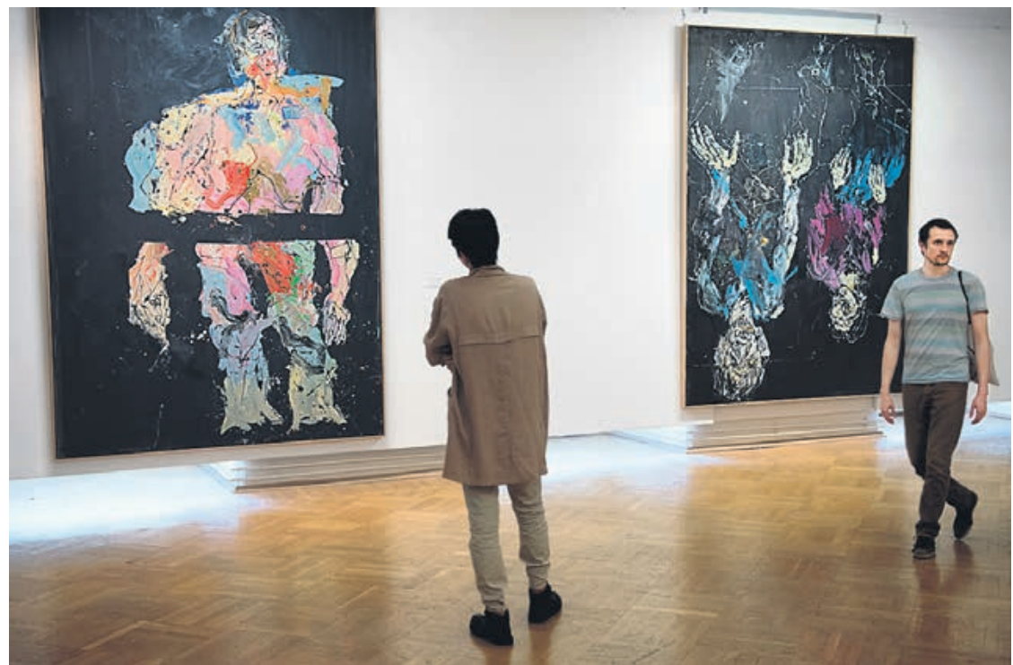
Эта живопись про прозрачность границы между абстракцией и фигуративностью, про то, что современное искусство растет из искусства классического