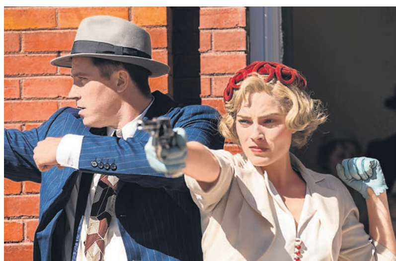
Картина Майлза Джорис-Пейрафита только притворяется костюмно-криминальной драмой о перестрелках и погонях

На экраны выходит «Страна грез» Майлза Джорис-Пейрафита