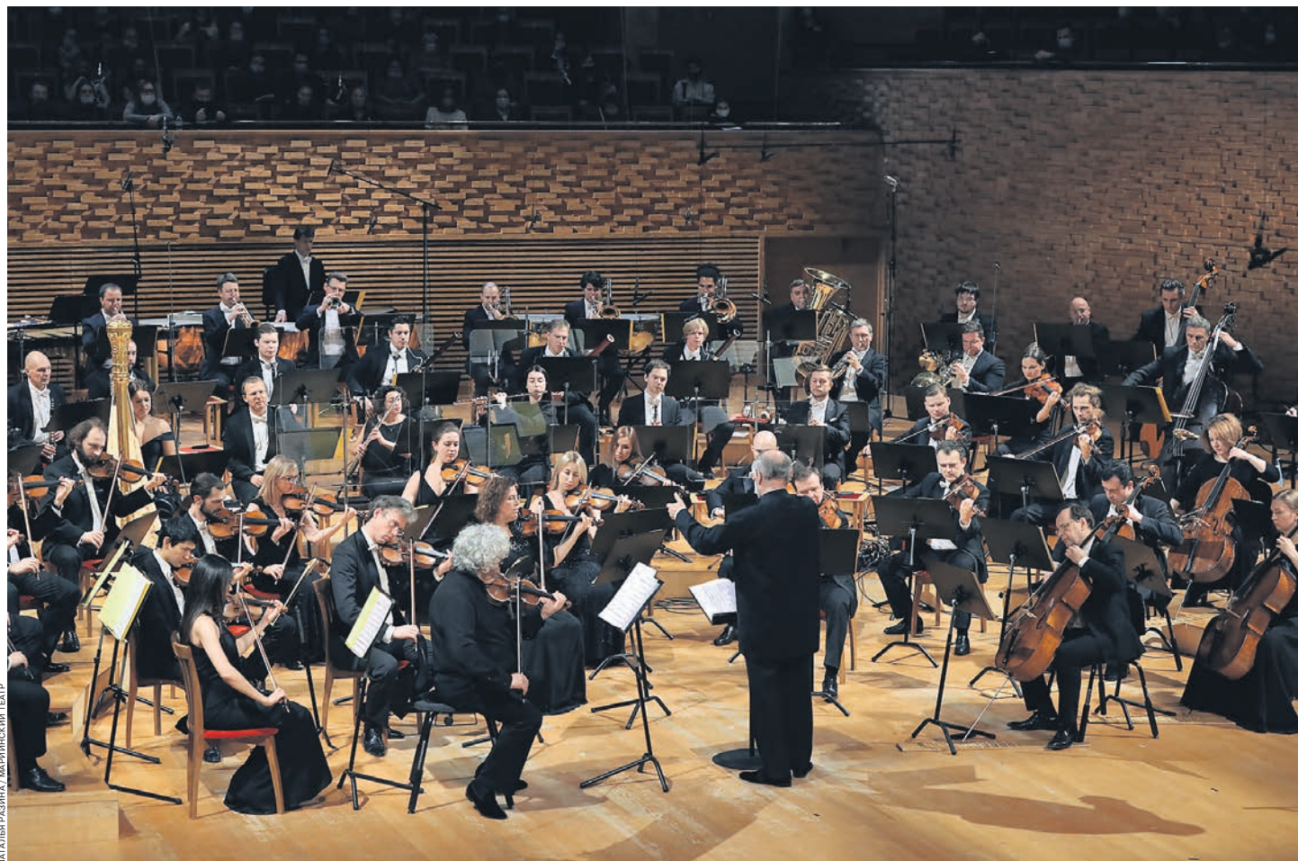
Оркестр Валерия Гергиева с удовольствием подтвердил свое реноме приоритетного исполнителя музыки Родиона Щедрина

Дело в том, что сложный и трагический претекст является неотъемлемой частью сочинения, но вынесен за скобки музыки. В партитуре Щедрина ничего этого нет: