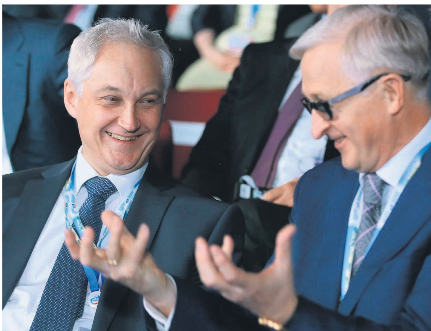
Возглавляемый Александром Шохиным РСПП встроился в проинвестиционную работу правительства под руководством первого вице-преьера Андрея Белоусова

Как стало известно «Ъ», в планах «нормативной» комиссии РСПП на ближайшие полгода — «сбор, формирование единой позиции и продвижение предложений по совершенствованию нормативной базы по мерам поддер-