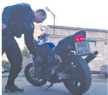
За месяц до трагедии мужчина выставил свой мотоцикл на продажу...

По словам Юлии, их отношения с Романом начали разрываться не так давно: