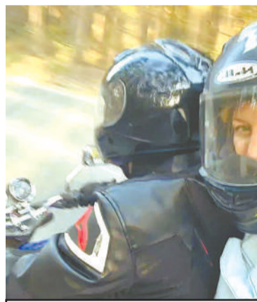
Подруга Романа рассказывает, что с ним было не страшно ездить.

- В тот день я вишню собирала, не было никаких плохих предчувствий, тут звонит его сокурсница, говорит про