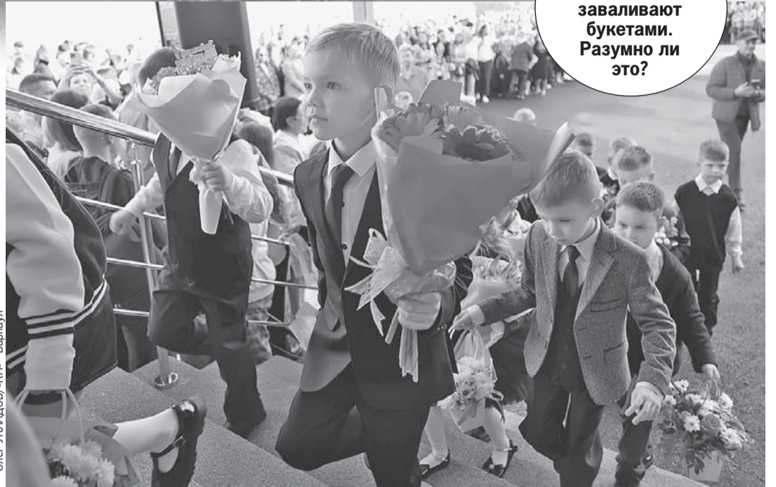
Олег УГЛАДОВ/КП - Барнаул

✓ «Есть дети, которые хотят подарить цветы учителю, выразив уважение. И это очень приятно. Есть дети, которые приносят хризантемы или астры с