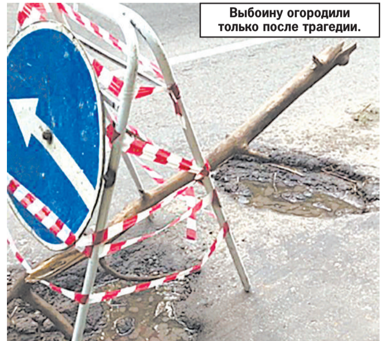
Выбоину огородили только после трагедии.

- Защита будет добиваться привлечения к уголовной ответственности должностных лиц, чье халатное отношение к исполнению служебных обязанностей повлекло гибель человека, - подытожил Олег Горохов.