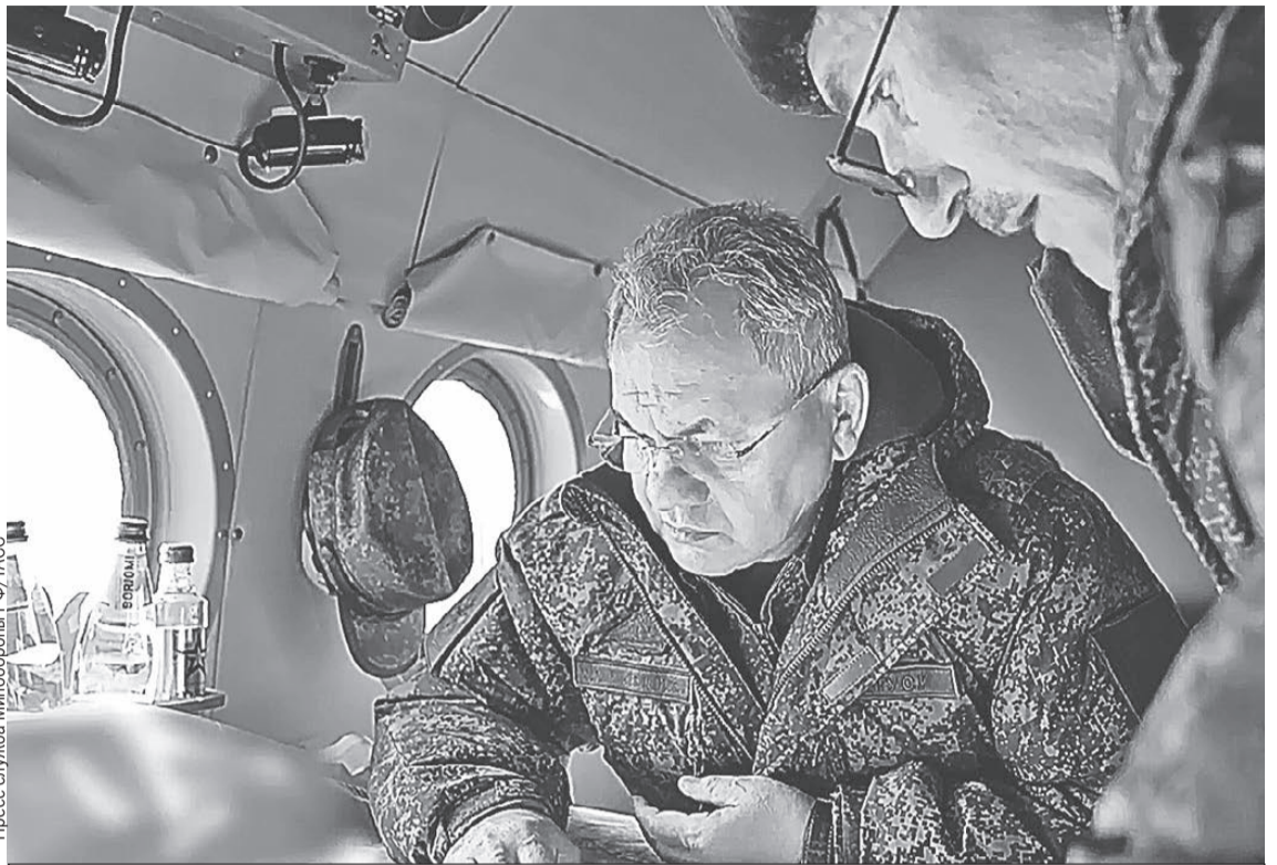
Сергей Шойгу облетел группировку войск в районах проведения СВО, проверив передовые позиции российских подразделений.

Минобороны подчеркнуло, что самое пристальное внимание главы военного ведомства России во время этой инспекции было уделено всестороннему обеспечению военной группировки. Сергей Кужугетович смог увидеть, в каких условиях несет службу личный состав, участвующий в боях. Министр увидел, насколько обеспечены бойцы всем необходимым. И насколько отлажена работа медицинской помощи и тыловых подразделений. И сделал соответствующие выводы.