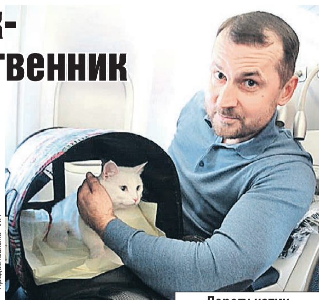
Дорогу котик перенес хорошо.