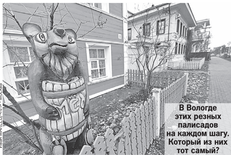
В Вологде этих резных палисадов на каждом шагу. Который из них тот самый?

Захотел, дескать, государь сделать Вологду столицей России, да купцы местные сообразили - невыгодно. Логика известная - придут москвичи, отождут бизнес. И устроили вологодские царя, как сейчас сказали бы, теракт. В строящемся храме