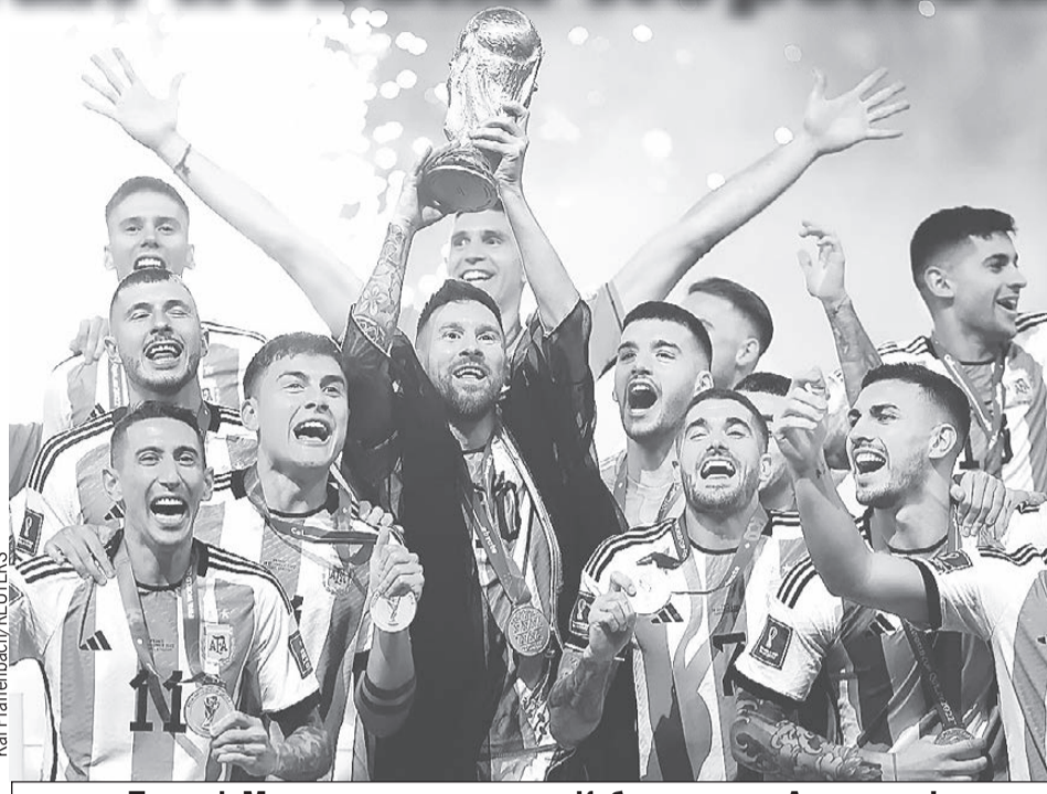
Триумф Месси и его партнеров. Кубок мира - у Аргентины!

Почти всегда он был лучшим. Он забивал самые важные голы и раздавал гениальные передачи. Он рычал на голландцев и утешал проигравшего хорвата Модрича. К финалу Лионель подошел с феноменальным результатом - 5 голов, 3 голевых паса, самое большое количество передач под удар, самое большое количество ударов. Именно так и надо сражаться за свою мечту.