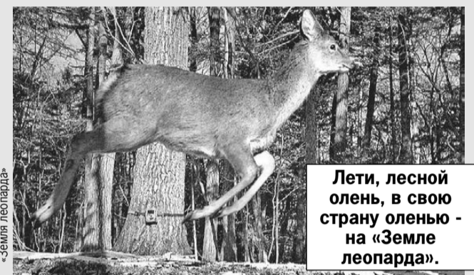
Лети, лесной олень, в свою страну оленью - на «Земле леопарда».

Этим кадром поделились сотрудники национального парка «Земля леопарда». Олень попал в объектив фотоловушки прямо во время прыжка, поэтому складывается ощущение, что дикий зверь научился летать.