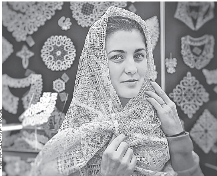
Главный плюс автостопа через всю страну - в каждом городе можно обзавестись сувениром. В Вологде - кружева. Теплые, красивые.