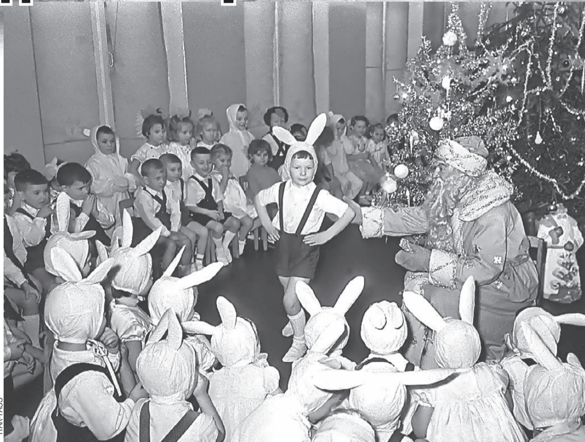
Мальчики-зайчики и девочки-снежинки - неизменная классика детской новогодней моды.

- Я ходил в садик в начале 60-х. Был в семье единственным ребенком, а вокруг меня тогда были родители, бабушки, прабабушка. Конечно, им всегда хотелось сделать для меня лучший праздник, поэтому они мастерили костюмы сами. Когда я в садик ходил, мой костюм позволил мне встать на табуретку и спеть Деду Морозу песню: «Я Петрушка маленький, маленький - удаленький». Все шили