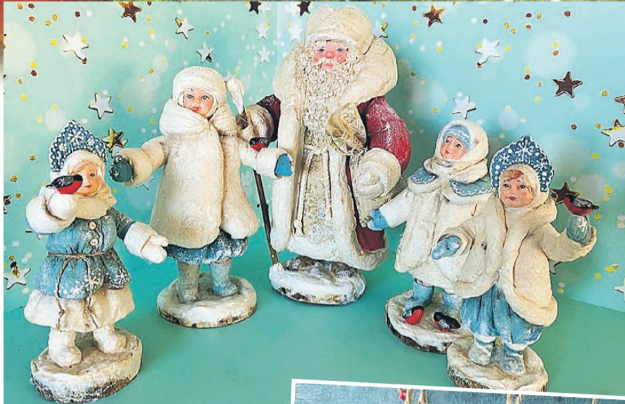
В коллекции Елены Георгиевой (на фото сверху справа) и Дедушки Морозы со Снегурочками, и дружелюбные котята.