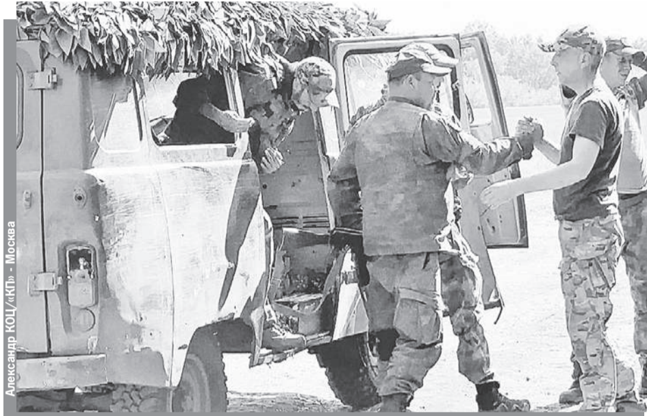
Прорвавшихся из ада окружения бойцов встречают боевые товарищи.