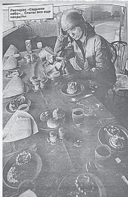
Ресторан «Седьмое небо»... Столы все еще накрыты.

Автор этого емкого пронзительного репортажа Владимир Веленгурин - прежде