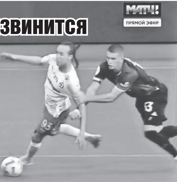
МТЧ! ПРЯМОЙ ЭФИР

- Переживаю, что придется обидеть «Оренбург».