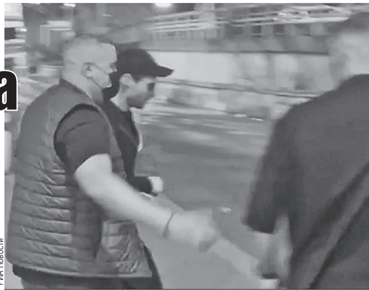
Выйдя из-под ареста, Павел Дуров (на фото он в черной кепке) на вопросы журналистов отвечать отказался и быстро прошел в поджидавшую его машину.

Руководство мессенджера, написало Politico, якобы «отказалось сотрудничать» с