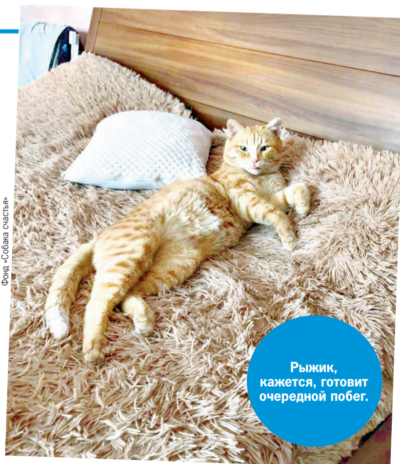
Фонд «Собака счастья»

Теперь Леопольд вернулся в родной дом. Целыми днями отлеживается бока на кровати, но, по мнению волонтеров, наверняка уже готовит очередной план побега - третий по счету. Однако хозяева теперь настороже и одного на прогулку хвостатого любителя кочевой жизни больше не отпускают.