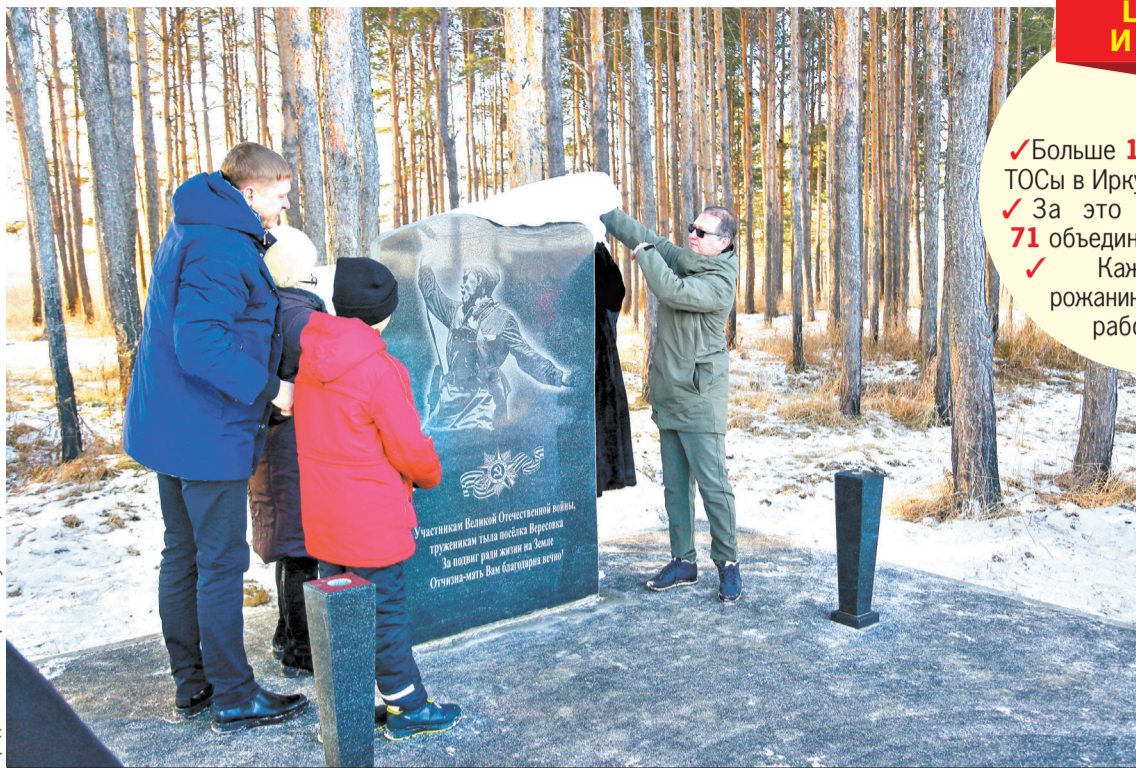
Памятный знак открыли в Вересовке благодаря инициативе активистов.