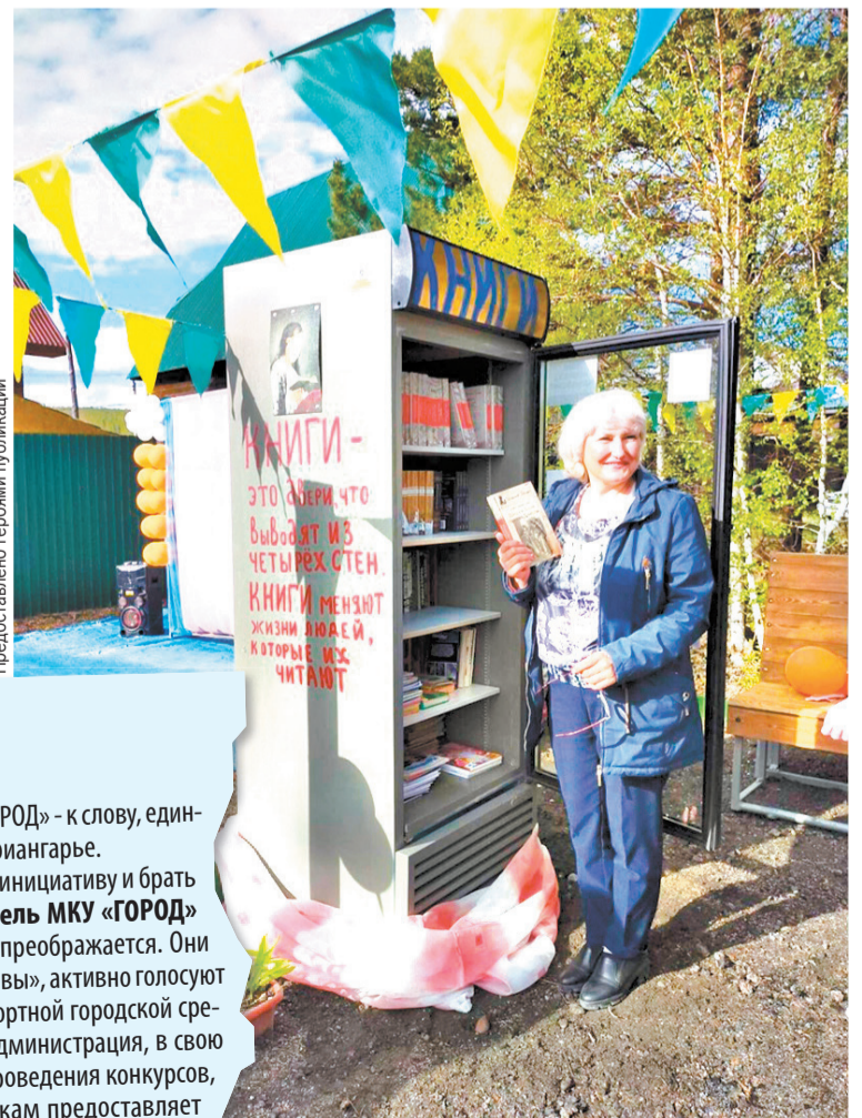
В Лесном обмениваются книгами.

Помимо этого, «Родные берега», равно как и другие городские ТОСы, устраивает праздники - жильцы вместе отмечают Новый год, Масленицу, дети с удовольствием участвуют в конкурсах рисунков и поделок. Мероприятия проводятся общими усилиями - жителям помогают управляющая компания и администрация.