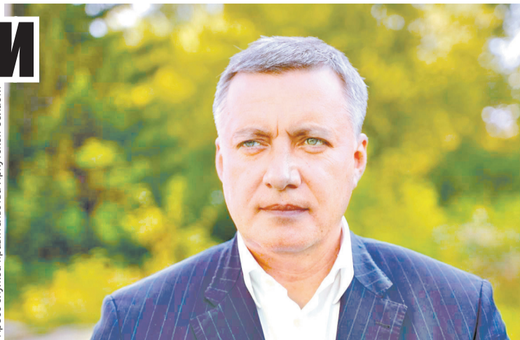
Губернатор Приангарья Игорь Кобзев утвердил программу празднования 85-летия региона.