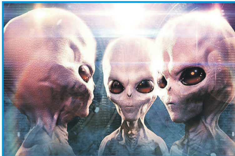
Дмитрий ПОЛУХИН/Космическая правда

На борту зондов не только графические инструкции, но и граммофонная пластинка, на которой записано обращение Джимми Картера - в то время президента США, короткие приветствия на 55 языках, включая русский, звуки земной природы, фрагменты музыкальных произведений. Часть пластинки содержит закодированные изображения. К пластинке прилагается граммофон с иглой и руководством по его использованию.