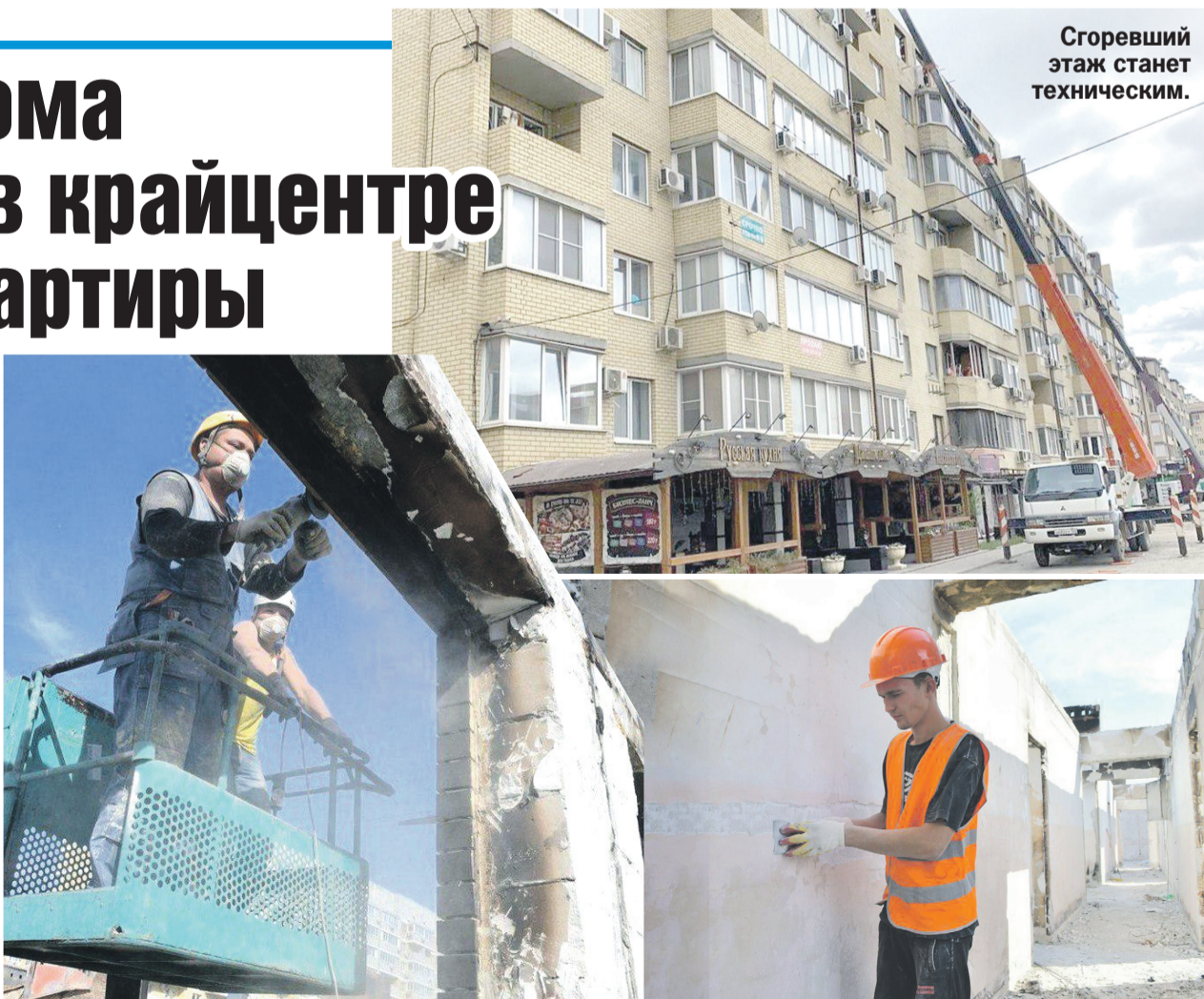
Сгоревший этаж станет техническим.

Владельцам квартир на седьмом этаже предоставят альтернативное жилье в собственность примерно той же квадратуры, отметили в мэрии.