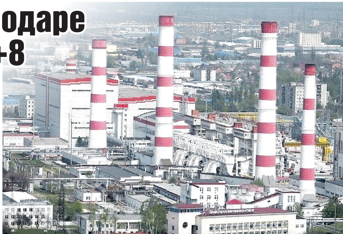
Теплосети готовы, запас топлива есть.

- Проведены 12 межведомственных комиссий, проверены и подготовка социальной сферы, и все предприятия, которые оказывают услуги в отопительный сезон. Это электро- и водоснабжение и другие услуги, необходимые не только в отопительный сезон, а круглогодично, - рассказал