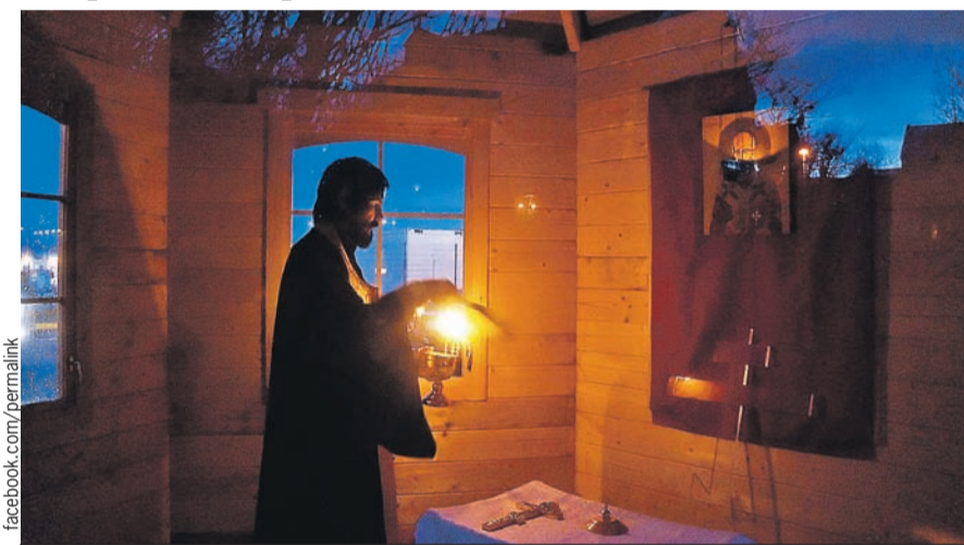
Скоро на этом месте возведут первый православный храм.

Православных в Исландии совсем немного (меньше 1000 человек). Но с тех пор как из Мо-