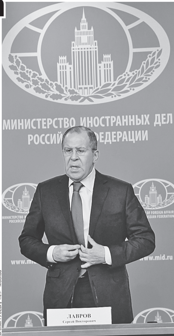
Евгения ГУСЕВА/«КП» - Москва

- Украинская тема искусственно делается более масштабной, чем она того заслуживает, и рассматривается как ось противостояния России и Запада в целом. Считаю такой подход ошибочным. Нужно смотреть не сквозь призму противостояния «авторитарной России» и «либерального Запада», а с точки зрения выполнения минских соглашений. Нашим зарубежным коллегам нужно отойти от безоглядной, бездумной поддержки линии Киева на срыв этих соглашений. При этом мы продолжаем уважать территориальную целостность Украины в тех границах, которые сложились после референдума весной 2014 года в Крыму.