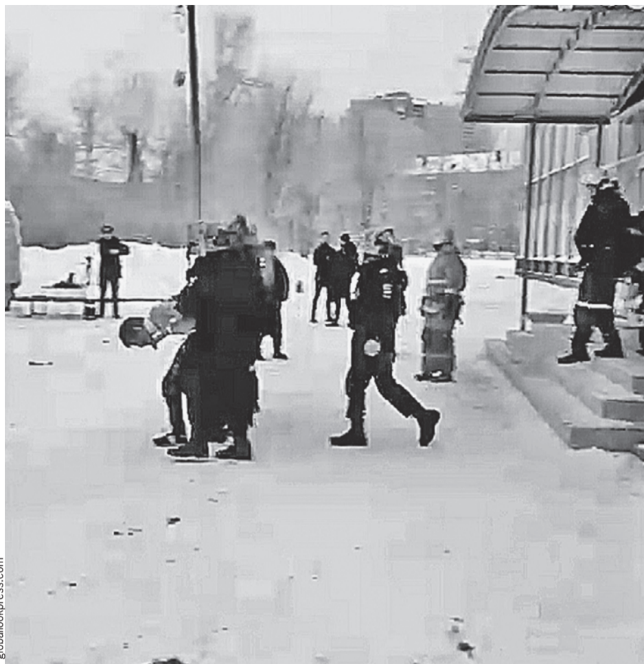
Во время задержания подростки (на фото - их ведут полицейские) не успели оказать сопротивление. Они до сих пор не могут внятно объяснить, зачем резали детей.

✓ 5 сентября 2017 года в подмосковной Ивантеевке ученик