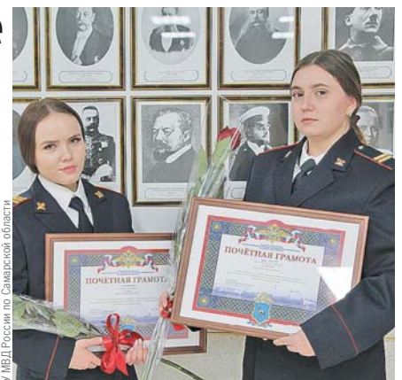
ГУ МВД России по Самарской области