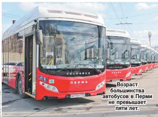
Возраст большинства автобусов в Перми не превышает пяти лет.