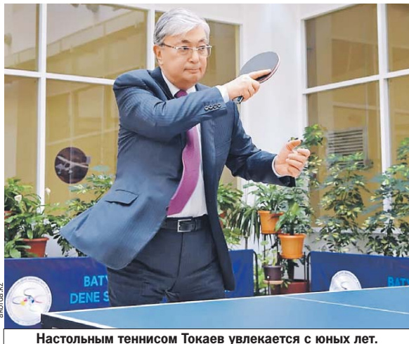
Настольным теннисом Токаев увлекается с юных лет.

По этому случаю «Комсомолка» вспомнила некоторые любопытные факты биографии лидера Казахстана.