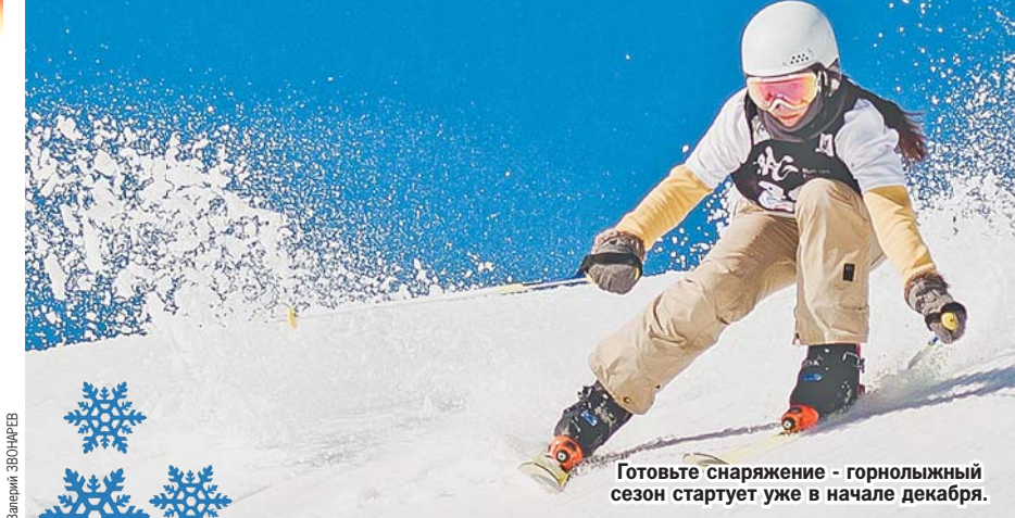
Готовьте снаряжение - горнолыжный сезон стартует уже в начале декабря.

Ски-пасс выходного дня стоит 1800 рублей, в будни - 1400. Экскурсионный подъем - 300 рублей.