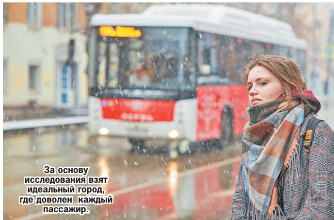
За основу исследования взят идеальный город, где доволен каждый пассажир.

4-е место в рейтинге занимает Казань, в прошлом году город был третьим. Практически по всем показателям столицы Татарстана отстает от лидера на десятки доли балла, но значительно уступает по ценовой доступности. При стоимости разового билета в 35 рублей, месячный проездной стоит 2800.