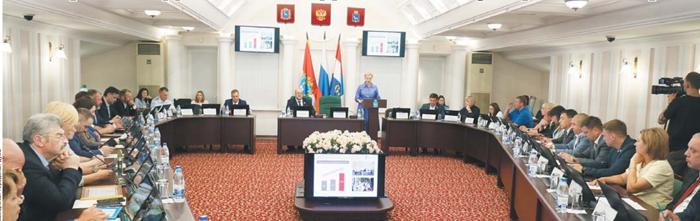
Самарская городская дума