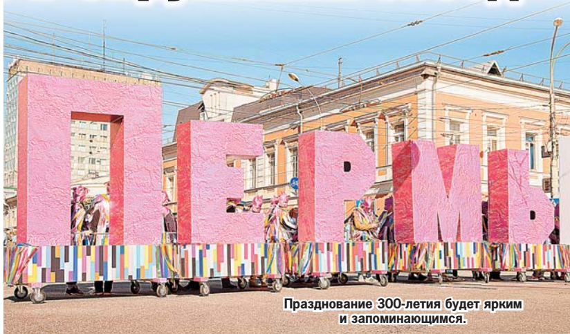
Празднование 300-летия будет ярким и запоминающимся.