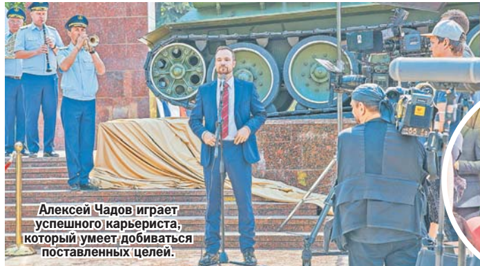
Алексей Чадов играет успешного карьериста, который умеет добиваться поставленных целей.

ны. Герои фильма будут яростно отстаивать свои принципы, но искусство заставит их примириться во имя любви. В результате чиновник избавится от категоричности, а искусствовед спустится с небес на землю.