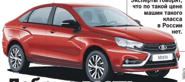
Эксперты говорят, что по такой цене машин такого класса в России нет.

- Lada Vesta выпускалась с 2015 года на вазовском предприятии в Ижевске, но потом производство было полностью перенесено на основную площадку в Тольятти, - рассказал автоэксперт Игорь Моржаретто. - Новая версия была презентована 22 февраля прошлого года, но в силу известных политических и экономических причин производство пришлось