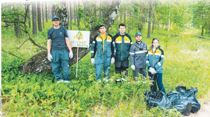
Нефтяники - активные участники всех экологических акций.

жизнедеятельности и нуждаются в санитарной очистке. Было решено провести субботник, в котором к коллективу минприроды присоединились наши друзья из «Роснефти» и РЖД.