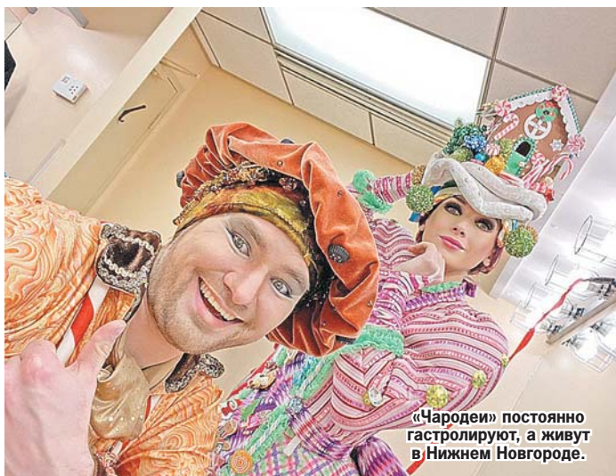
«Чародеи» постоянно гастролируют, а живут в Нижнем Новгороде.