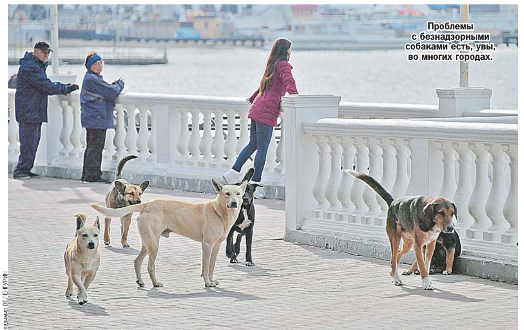
Проблемы с безнадзорными собаками есть, увы, во многих городах.