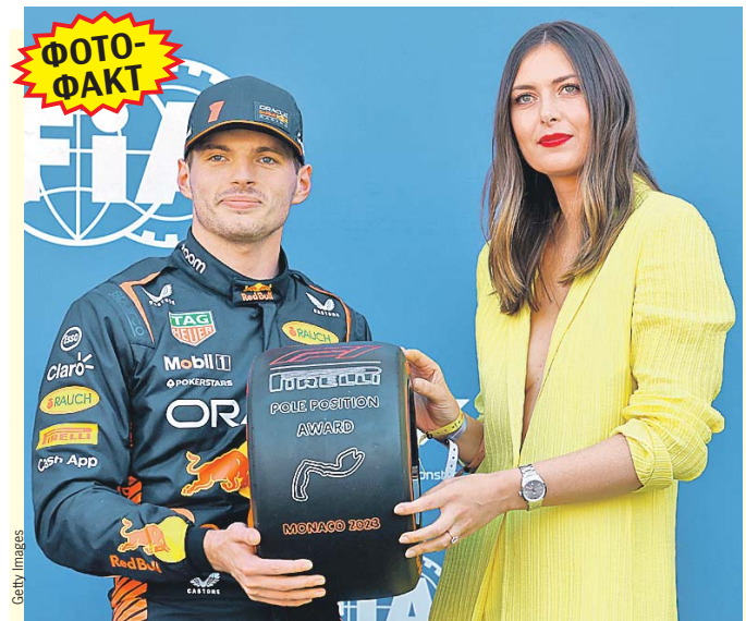
Мария Шарапова в откровенном наряде впервые после родов появилась на спортивных соревнованиях в качестве почетного гостя. Знаменитая теннисистка наградила гонщика «Формулы-1» Макса Ферстаппена за победу на Гран-при Монако.

А все для того, чтобы точно остаться в РПЛ. Лига же преобразилась от «колхозного панка» и провинциального стадиона советских времен. А значит, «Факел» должен и дальше нести в лигу свою атмосферу.