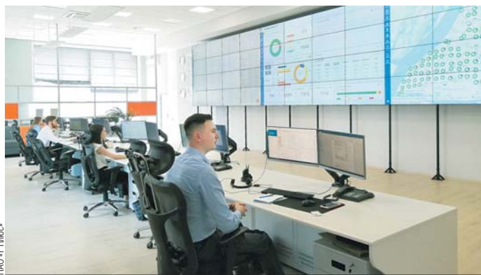
Диспетчеры и аналитики Центра каждый день 24 часа в сутки отслеживают качество тепла на входе в дома.

Повысить качество теплоснабжения призван и другой пилотный проект, который стартовал в Кирове и Самаре. Суть проста: индивидуальные тепловые пункты мно-