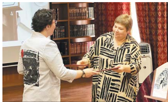
Самарская публичная библиотека станет обладателем уникальной информации, доступ к которой имеют лишь партнеры Всероссийского музея А.С. Пушкина.