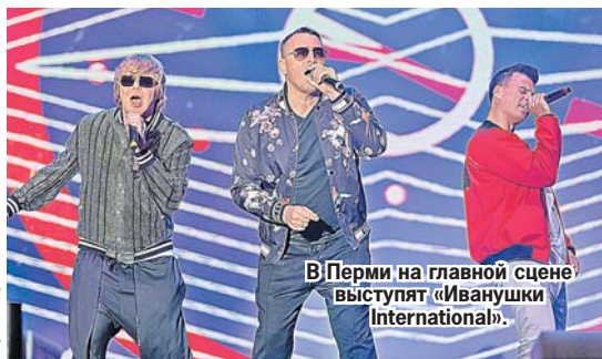
В Перми на главной сцене выступят «Иванушки International».

С 21:00 до 23:00 праздник продолжится выступлениями групп Artik&Asti и «Иванушки