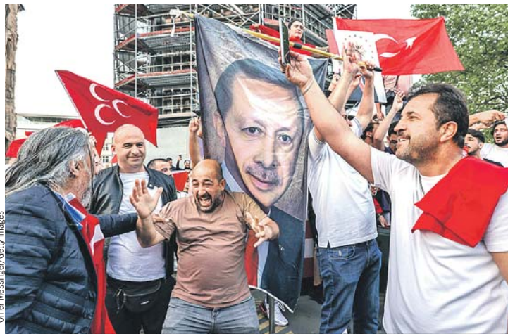
Странники Эрдогана празднуют его победу. Турецкий лидер останется на посту президента еще пять лет.

Любопытное мнение удалось получить от наших соотечественниц, имею-