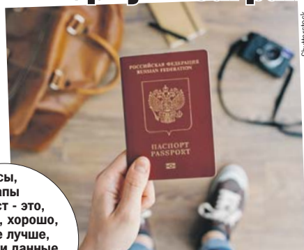
Усы, лапы и хвост - это, конечно, хорошо, но еще лучше, когда эти данные «защиты» в чип биометрического паспорта.

В Гознаке это объяснили тем, что спрос на загранпаспорта резко вырос, а микросхем для их производства не хватает. И дело не в санкциях: с 2013 года в паспортах нового образ-