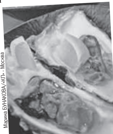
Оказавшись в Приморье, налегайте на морепродукты.

Добраться из Хабаровска до Владивостока автомобилем мы реши-