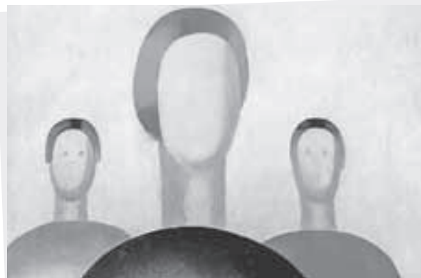
Глазки с полотна уже пропали, картина приняла первозданный вид.

Что до самой картины, то, по оценке реставратора, состояние сохранности картины сейчас соответствует состоянию при передаче картины на выставку. То есть ущерба нет, а есть лишь временная порча.