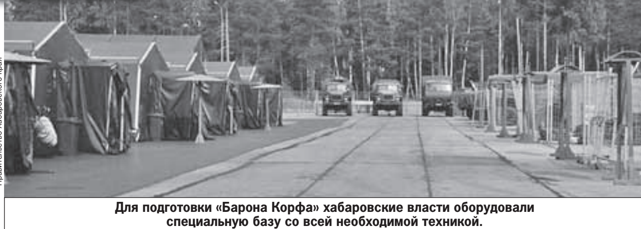
Для подготовки «Барона Корфа» хабаровские власти оборудовали специальную базу со всей необходимой техникой.

Важно! Незапятнанная биография. Неснятая или непогашенная судимость - мимо. Сидевшие и наркоман-