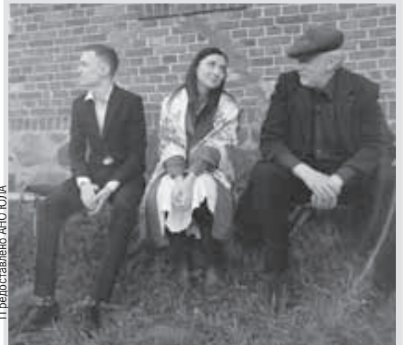
Участники проекта и эксперт, изображающий парторга переселенческого колхоза.

Был «переселенческий» физкультурный праздник, концерт художественной самодеятельности, полевые работы и многое другое. Сейчас идет монтаж фильма «Мир после войны: реконструкция», который скоро можно будет увидеть в интернете.