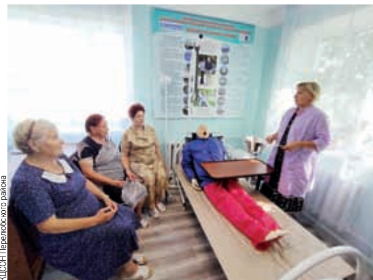
Специалисты КЦСОН учат правильному уходу за больными людьми.