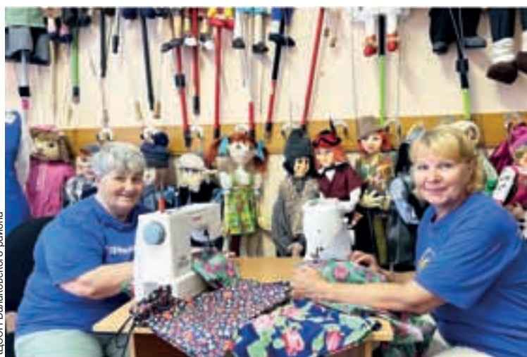
«Серебряные» волонтеры - на все руки мастера.

Получатели социальных услуг отметили, что важно продолжать вести активный образ жизни, чтобы обеспечить качественную жизнь и удовлетворение от своей жизни, а также помогать другим людям согласно своим возможностям, учитывая прогресс болезни.