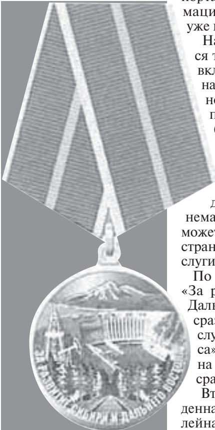
Лента новой награды зеленого цвета с желтой полосой посередине и белой окантовкой. А на самой медали отчеканена Саяно-Шушенская ГЭС.

Владимир Путин утвердил две новые госнаграды.