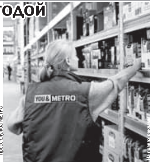
Покупки с запасом лучше всего планировать заранее.

Торговые центры такого рода расположены на всей территории России, они, как правило, работают допоздна, и люди приезжают сюда в поиске качественных продуктов по выгодным ценам.