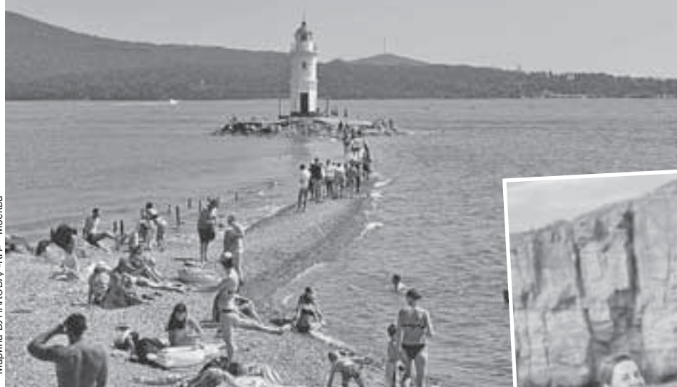
Маяк Токаревского - визитная карточка и место притяжения туристов.

ли не столько из-за любви к пейзажам, сколько из-за отсутствия других вариантов: выкладывать 60 тысяч на авиабилет в одну сторону не хотелось (так бывает не всегда, это бизнес-классовские остатки), а последние два билета в плацкарту увели из-под носа. Но мы мудро рассудили, что во Владивостоке без машины придется туго.