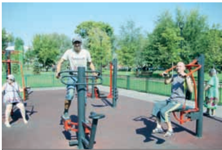
Подопечным заводского КЦСОН удалось совместить полезную прогулку и приятное общение друг с другом.

Еще одно специализированное направление - «Школа восстановления «Шаг за шагом». В КЦСОН занятия по этой программе для граждан, перенесших инфаркт, инсульт и переломы, проводятся каждый день. Получать положительные результаты людям помогает специализированное оборудование, приобретенное в рамках реализации региональной