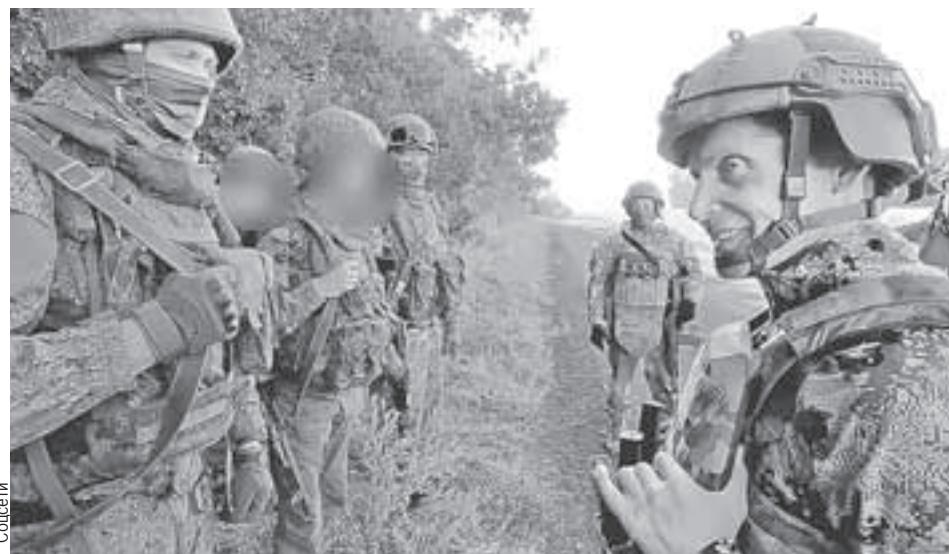
Губернатор Приморья Олег Кожемяко сам бывал в зоне спецоперации. Теперь создает с нуля батальон добровольцев «Тигр».

- К моему решению в семье отнеслись с уважением. Все прекрасно понимают, что нужно охранять Родину. Я сразу сказал: еду туда, чтобы они спали спокойно.