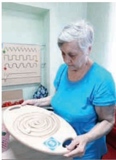
Подобными приспособлениями для восстановления функций обеспечены практически все центры соцобслуживания.

Ряд специализированных методик для поддержания здоровья людей старшего поколения применяется на базе КЦСОН Балашовского района. Одна из них - модуль «Учебная кухня» для пожилых людей и граждан с ограниченными возможностями здоровья.