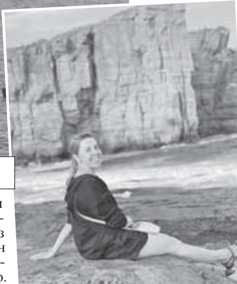
Финальная точка мыса Тобизина. Только вы, скалы и буйные волны.

Р. С. Лично для меня Дальний Восток - прекрасное место для отпуска. Для комфорта массового туриста здесь много чего не хватает - от не то чтобы приличных, но хотя бы проезжаемых дорог до элементарных мусорных баков в местах притяжения народа. Но из памяти все это сотрется довольно быстро, а останется липкий приморский загар, шум волн, крики жирных чаек и ощущение, что сюда обязательно нужно вернуться.