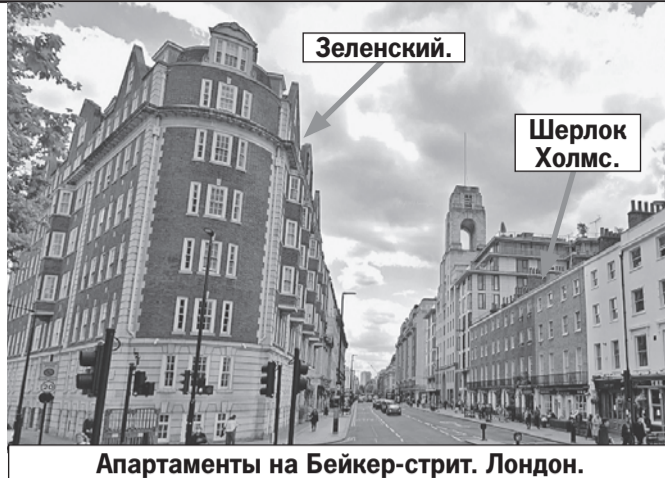
Апартаменты на Бейкер-стрит. Лондон.