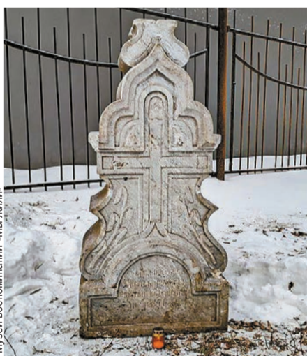
Имя погибшей на надгробии было сбито, поэтому его пришлось устанавливать по метрике.

трогательная надпись: «Милая дорогая дочь на добрую память от мамы. А. В. В.». На другой грани читается текст: «прожившая на св т 18 л т умерла от родов».