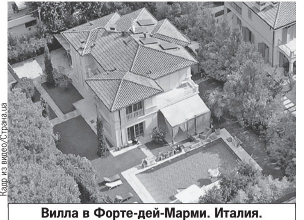
Вилла в Форте-дей-Марми. Италия.