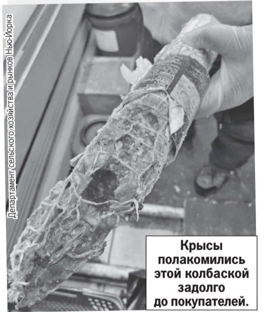
Крысы полакомлись этой колбаской задолго до покупателей.