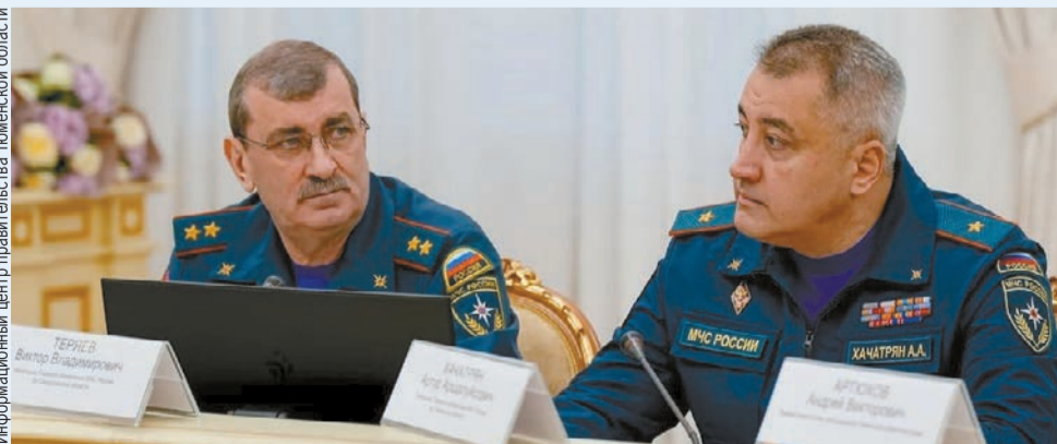
Заседание по вопросам паводка.

В итоге встречи в правительстве области достигнута договоренность об эффективном сотрудничестве между федеральными, региональными и муниципальными властями, промышленными организациями и общественностью. Это, по мнению Александра Моора, поможет подготовиться к любым потенциальным рискам в 2025 году.