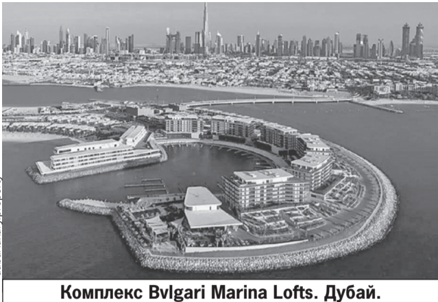
Комплекс Bvlgari Marina Lofts. Дубай.