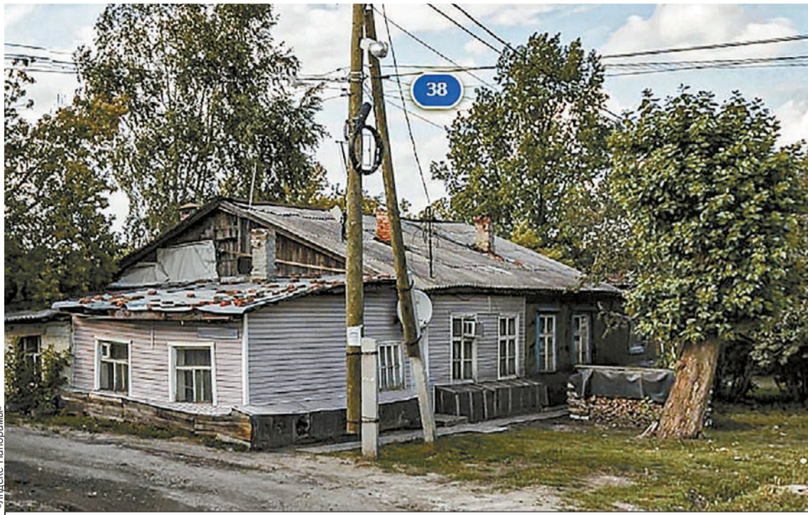
Жильцам приходится мириться с невыносимыми условиями.

Оценка жилых помещений проводилась в 2019 году, однако через три года ее резуль-