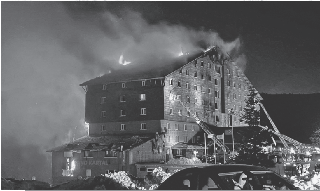
Облицованный деревом горный отель вспыхнул факелом. Сигнализация не сработала, автоматической системы пожаротушения в гостинице вообще не оказалось. Лестницы спасателей не доставали до верхних этажей, где люди оказались в огненной ловушке.

«Было жутко, как в фильме ужасов. Люди кричали: «Почему не тушат огонь?»