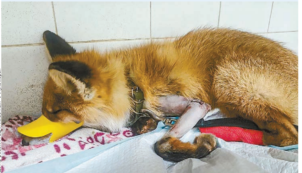
Центр реабилитации животных «У Лукоморья»

Специалисты реабилитационного центра сообщают, что Фоксик навсегда останется в зоопитомнике, где за ним будут присматривать волонтеры. Лис просто не выживет в условиях дикой природы в своем нынешнем состоянии инвалида.