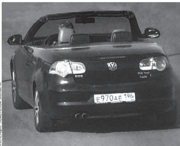
Госавтоинспекция Тюменской области

Второе место в антирейтинге занял 57-летний автовладелец из Тюмени, которому принадлежит автомобиль «Форд». Он накопил 235 неоплаченных штрафов за наруше-