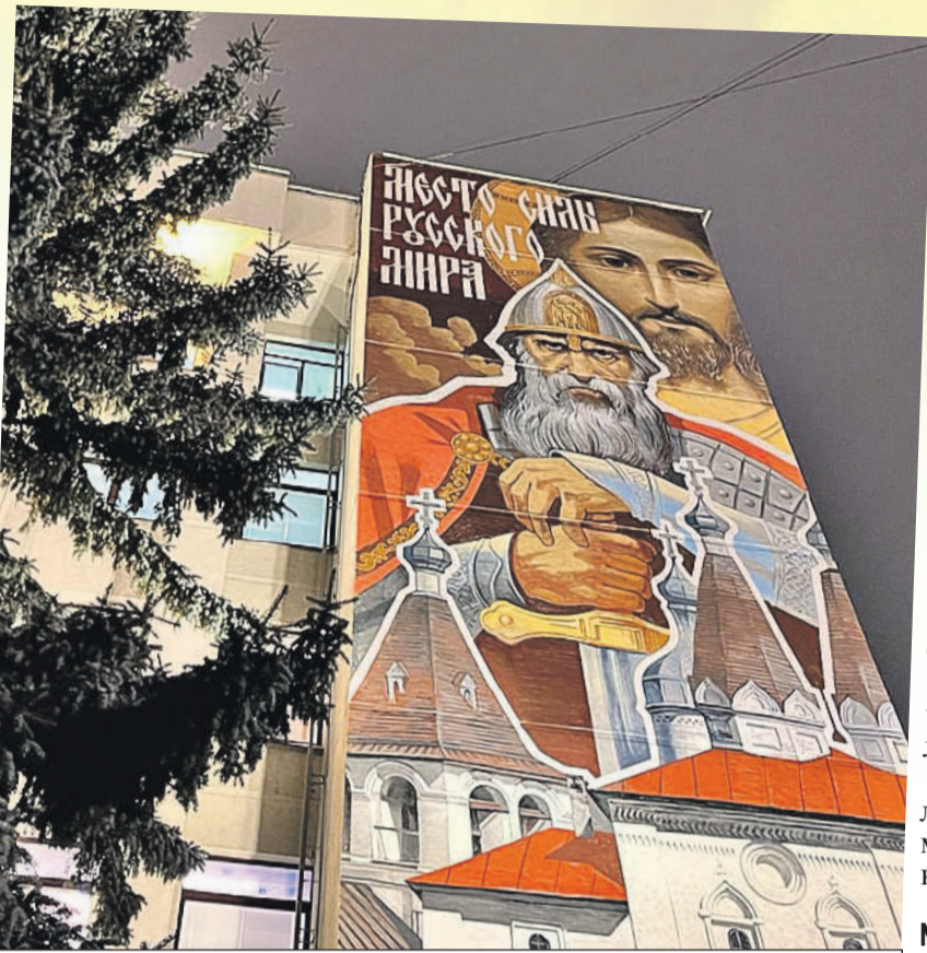
Такой плакат с былинным богатырем и надписью про то, что здесь «место силы Русского мира», висит на здании рядом с администрацией.

А вот в Вологде интересно. Тут обратный эксперимент.