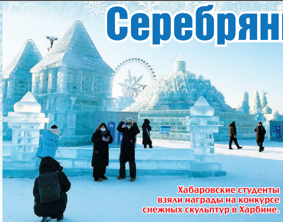
Хабаровские студенты взяли награды на конкурсе снежных скульптур в Харбине.