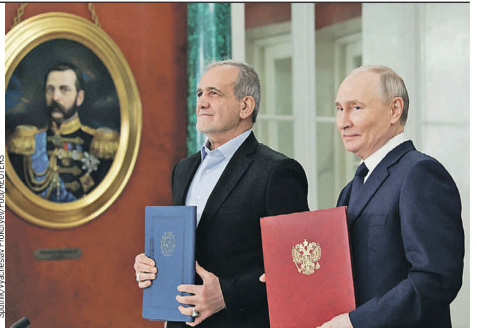
Два президента один император: Владимир Путин и его иранский коллега Масуд Пезешкиан под пристальным взглядом Александра II.

- Реализация этого проекта помогла бы наладить бесшовную логистику от России и Белоруссии до иранских портов в Персидском заливе, - сказал российский президент.