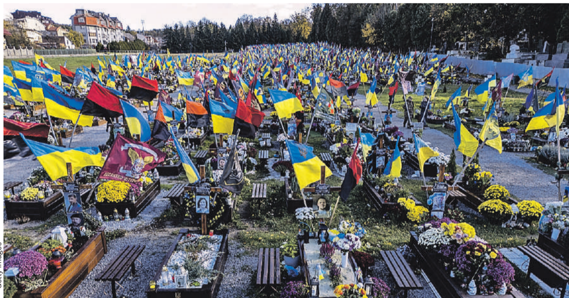
Русофобская политика киевских неонацистов обернулась смертями тысяч простых украинцев. Кладбище, подобных этому во Львове, в стране появилось множество.

- Президентство Байдена показало, что приоритеты Белого дома и простых граждан значительно отличались. Знакомые каждому американцу еще со школьных учебников слова о том, что в Америке народ