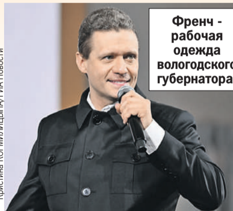
Френч - рабочая одежда вологодского губернатора.

деля к неделе, квартал к кварталу и так далее. Было - стало. Я объехал все муниципалитеты области, отвечаю на все вопросы.