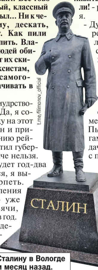
Памятник Сталину в Вологде открыли месяц назад.