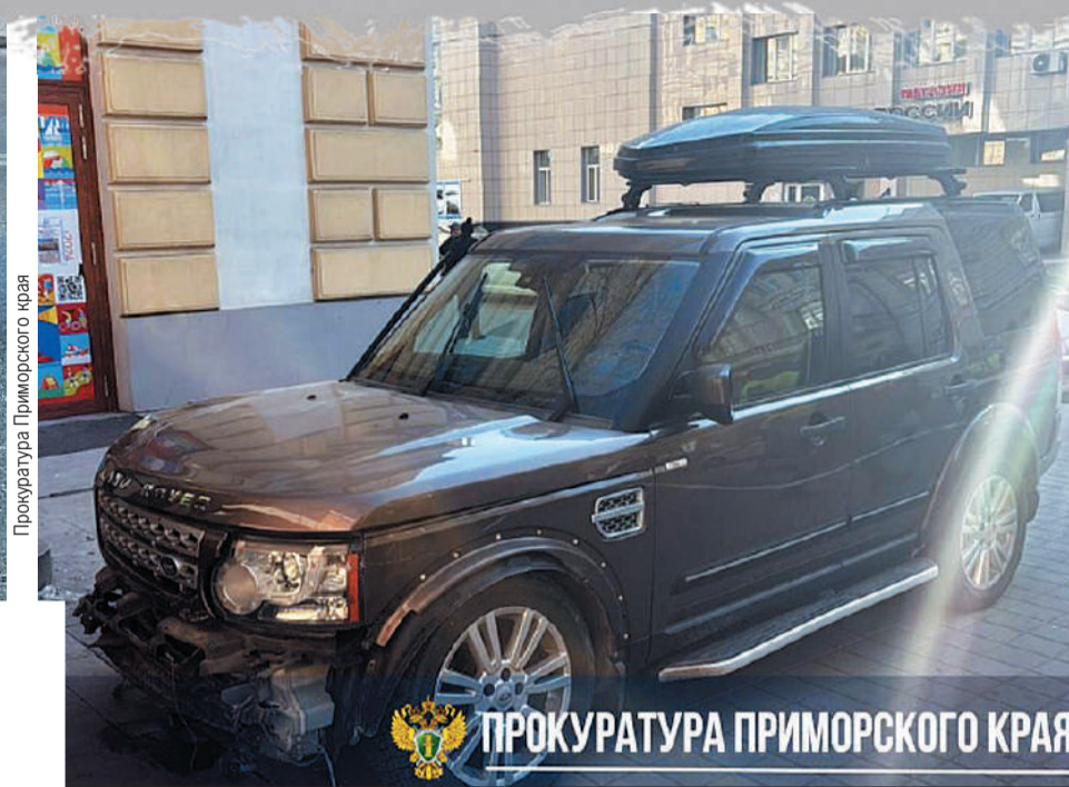
Прокуратура Приморского края