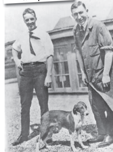
Фредерик Бантинг и Чарльз Бест