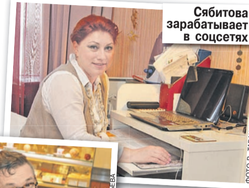
Сябитова зарабатывает в соцсетях

гинас, там хранится его коллекция старинного костюма. Как написали литовские журналисты, Васильев, опасаясь, что сокровища отберут, поспешил известить мэрию литовского городка, что он против политики России. Многие думали, что история с письмом поставит крест на дальнейшем сотрудничестве Александра Александровича с Первым каналом: его уволят из «Модного приговора». Но этого не произошло. Хотя передачу пока в эфир не выпускают. И, видимо, не выпустят в бли-