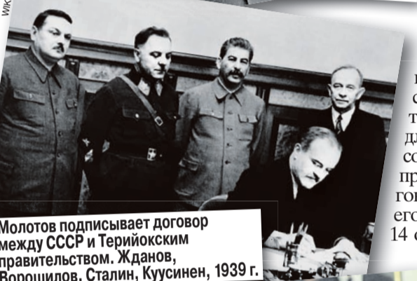
Молотов подписывает договор между СССР и Терийокским правительством. Жданов, Ворошилов, Сталин, Куусинен, 1939 г.