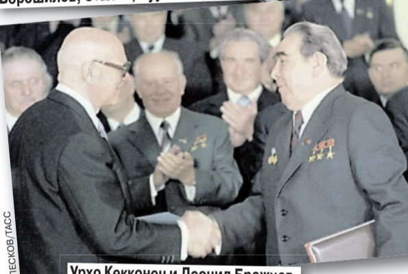
Урхо Кекконен и Леонид Брежнев