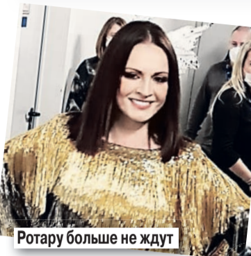
Ротару больше не ждут

- Во-первых, «Песня года» - это бренд, который будет существовать столько, сколько люди у нас в стране вообще будут слушать музыку, - уверена Лолита. - Ее не станут проводить, только если опять, не дай бог, ковид. Или возникнет такая финансовая ситуация, что будет, простите, не до песен. Во-вторых, если говорить о сегодняшней «Песне года», то она не нуждается в ради-