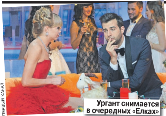
Ургант снимается в очередных «Елках»