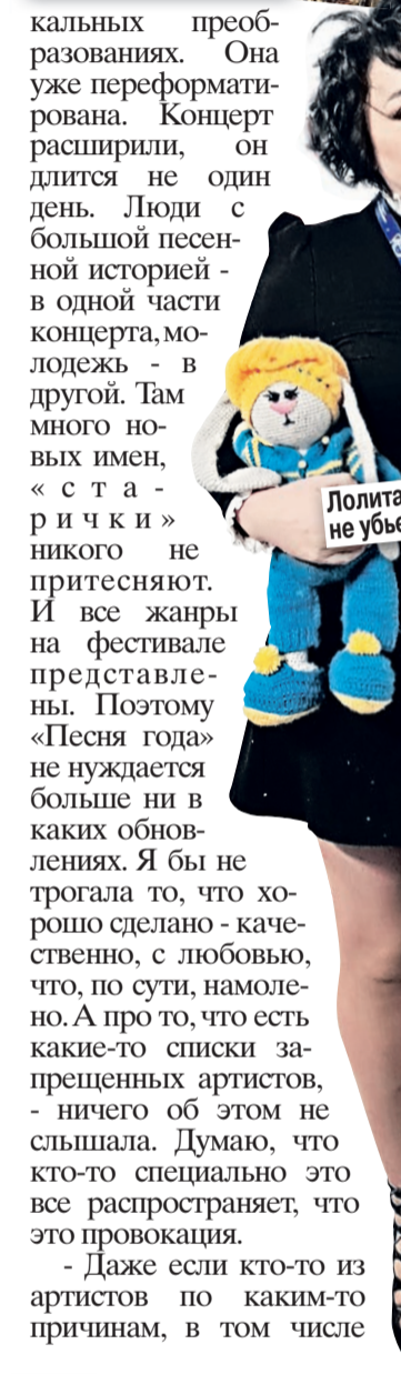
Лолита: нашу «Песню» не убьешь!

политическим, не сможет участвовать в «Песне года», то сам фестиваль от этого не пострадает, - считает Иосиф Пригожин. - Есть ли кем заменить выбывших? Да конечно, есть! У нас многие артисты не могли попасть на этот фестиваль, в очереди стояли! Всегда в программе было 53 участника. А тех, кто хотел бы там выступить, - гораздо больше. У нас сотни талантливых артистов!