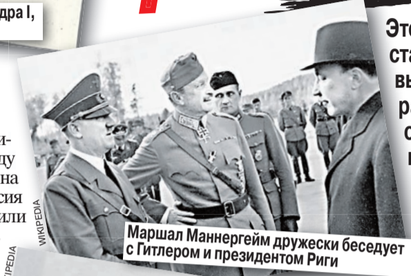
Маршал Маннергейм дружески беседует с Гитлером и президентом Риги

Александр I сохранил в Суоми самоуправление, протестантство, национальный банк. Налоги и таможенные сборы использовались внутри княжества, охраняемого русскими войсками. Кроме того, он передал Финляндии Выборгскую губернию. Приведу неподтвержденную гипотезу. Александр, воспитанный бабушкой Екатериной II, не чурался либерализма и, взойдя на престол, создал команду младореформаторов. Но дальше декларирования идей дело не пошло. Возможно, предоставив Финляндии тепличные условия, он рассматривал ее как полигон для будущих реформ. Но Финляндия из «приюта убогого чухонца» превратилась в успешное княжество, имеющее с Россией мало общего и мечтающее о независимости, которую приблизил Февральская революция. Декрет о создании Финляндской республики 6 декабря 1917 года подписал Ленин, уверенный, что местная Красная гвардия перебьет буржуев и их приспешников.