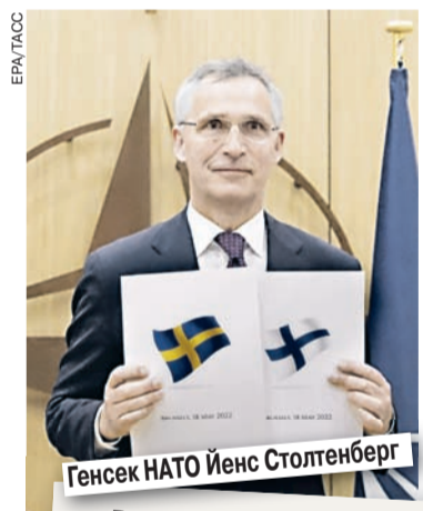
Генсек НАТО Йенс Столтенберг

В преклонном возрасте Молотов любил давать интервью: «Умно поступили, что не присоединили Финляндию. Имели бы рану постоянную». Сталин оказался не менее прозорлив, чем Александр I. В 1947 году был подписан договор «О дружбе, сотрудничестве и взаимопомощи...», действовавший