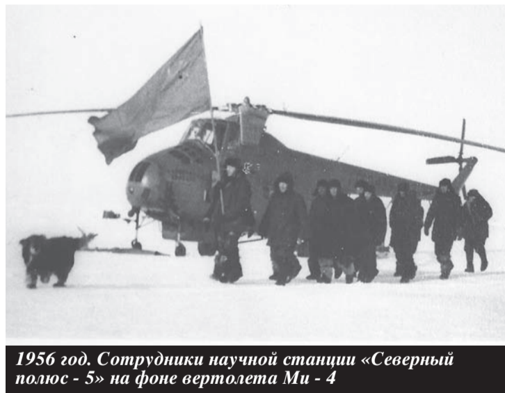
1956 год. Сотрудники научной станции «Северный полюс - 5» на фоне вертолета Ми - 4

ях на высоте 8 км, но и зависть коллег к успеху, заскорузлый бюрократизм наших чиновников, а также нарушать нежизнеспособные инструкции по применению вертолета. Машина Колошенко совершила тогда