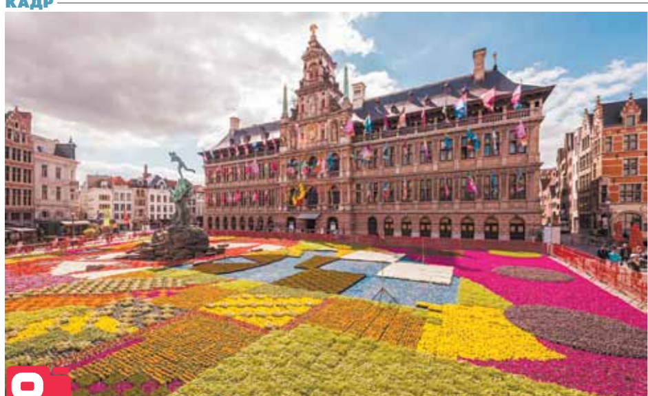
Около 173 тыс. горшков с различными цветами и травами выставлены на площади в Антверпене (Бельгия). Инсталляция создана в честь 450-летия знаменитой местной ратуши.