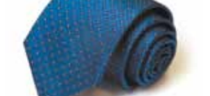
Похожий галстук теперь появится в коллекции Владимира Путина.