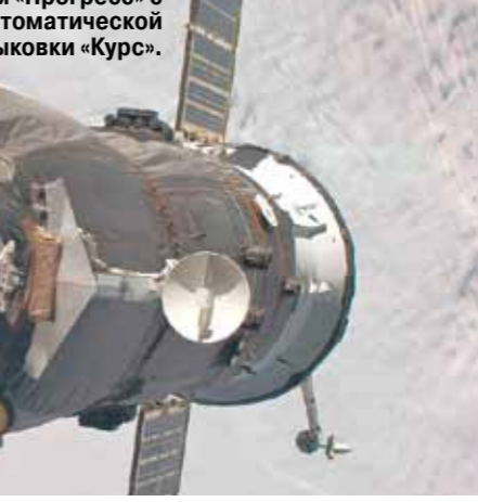
Момент стыковки корабля «Прогресс» с МКС при помощи системы автоматической стыковки «Курс».

Сейчас мы выясняем это. Понимание глубины вопроса здесь действительно необходимо. Но как достичь его, если многих молодых специалистов влечет в космическую отрасль после вузов?