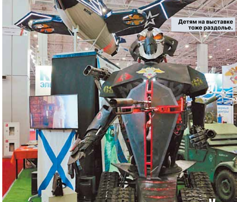
Детям на выставке тоже раздолье.

Среди представленных экспонатов реактивные системы залпового огня «Торнадо-Г» и «Смерч», ракетный комплекс «Искандер-М», тактический ЗРК Тор-М2У, пусковая установка зенитного ракетного комплекса С-400 и многое другое. Своими руками можно даже пощупать те самые знаменитые ракеты «Калибр», которые наделали столько шуму в мире, когда российские