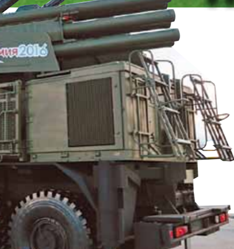
Российские системы ПВО очень интересовали короля Бахрейна.

ракетные катера из акватории Каспийского моря впервые пустили их по объектам террористов в Сирии. Военные говорят, после такой рекламы за этими ракетами выстроилась целая очередь из представителей иностранных армий, желающих их купить.