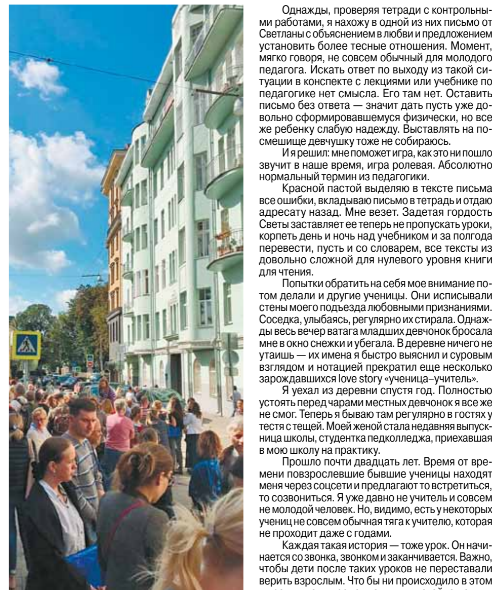
Родители волнуются о судьбе школы.