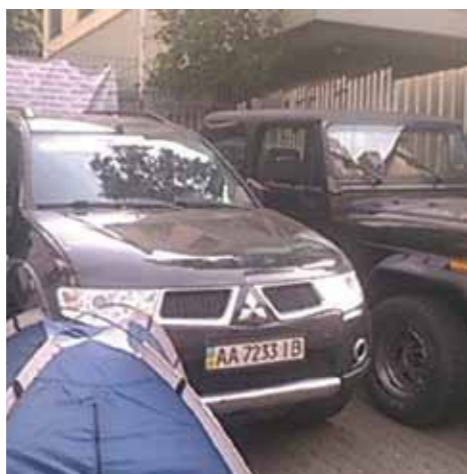
Автомобили «профессиональных украинцев», которыми заблокировали вход на телеканал «Интер».

автомобили от входа на телеканал. Боевики начали переговоры с телевизионщиками, по результатам которых первые заявили, что «Интер» должен изменить свою редакционную политику, а вторые ответили: «Дырку вам от бутика». Несмотря на это, неонацисты решили не поджигать журналистов во второй раз, а тихо разойтись по домам.