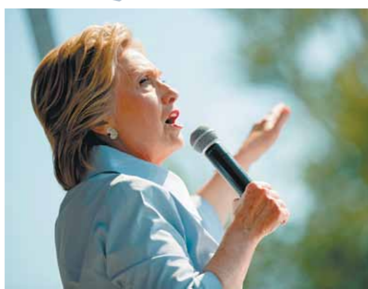
Обеспокоенность Клинтон ходом предвыборной кампании объяснима: по данным недавнего опроса CNN, Трамп, хоть и немного — на 2%, но опережает ее по популярности. За экс-госсекретаря пока готовы голосовать 43%, за ее соперника-республиканца — 45%.