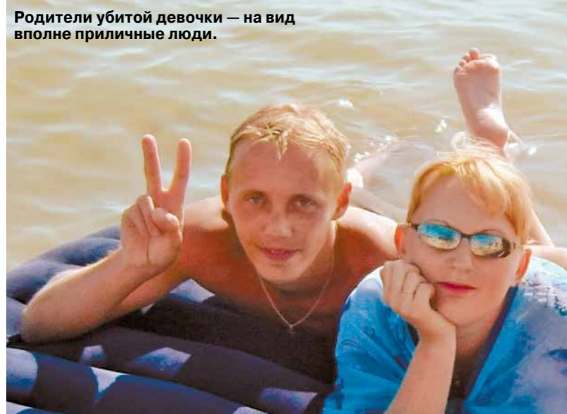
Родители убитой девочки — на выезде вполне приличные люди.