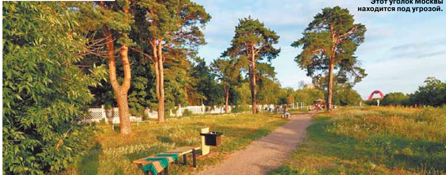
Этот уголок Москвы находится под угрозой.

Очередные гектары московского леса пали под напором застройщика. На этот раз под пилу пустили огромные сосны рядом с одним из зданий Курчатковского института на улице Живописная, вл. 21. И снова последовали протесты местных жителей. С чем они связаны — выяснял «МК».