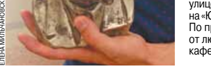
Талисман ласт-стопперов — бюстик Ленина.