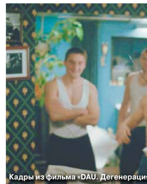
Кадры из фильма «DAU. Дегенерация».