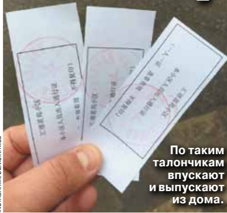
По таким талончикам пропускают и выпускают из дома.