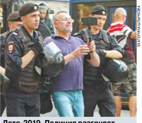
Лето-2019. Полиция разгоняет акцию несистемной оппозиции.

Речь — о несистемной оппозиции. «Есть, и всегда была, и всегда будет такая часть общества в любой стране, которая не согласна с действующей властью.