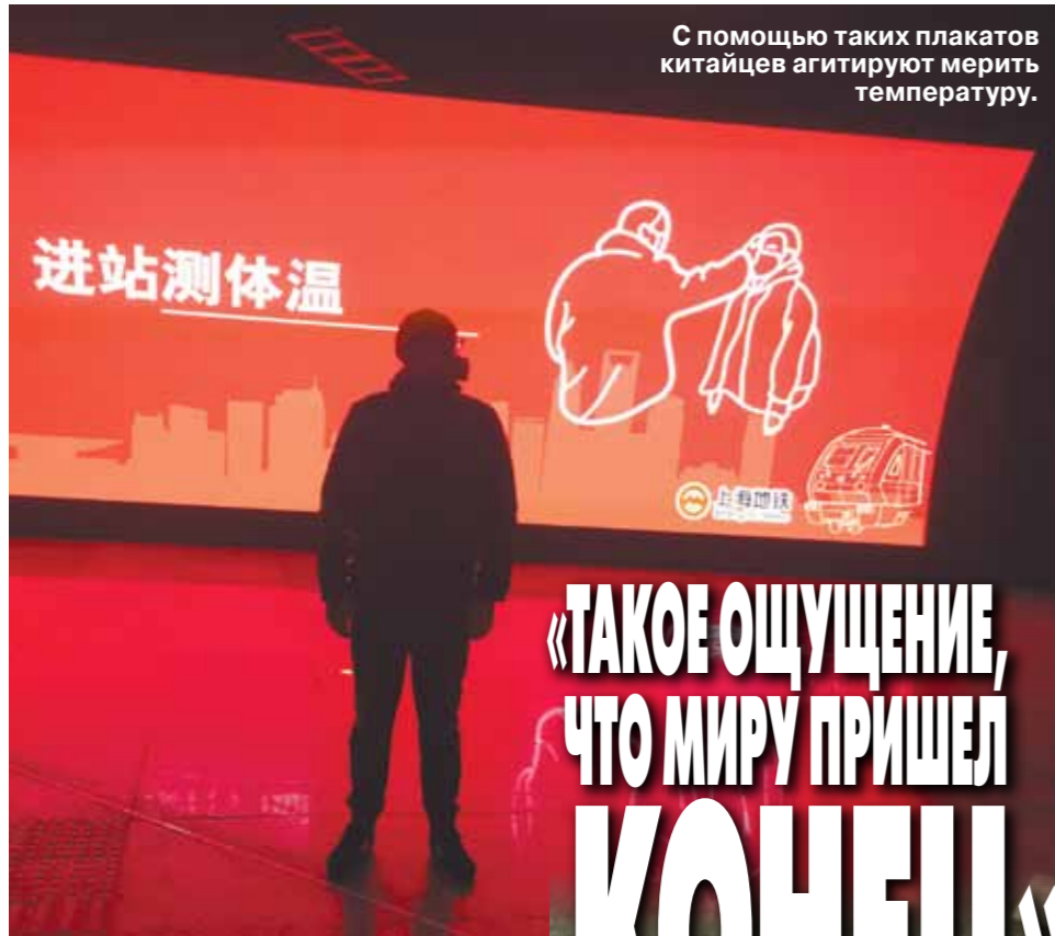
С помощью таких плакатов китайцев агитируют мерить температуру.