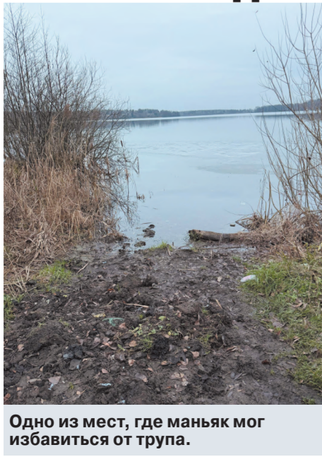
Одно из мест, где маньяк мог избавиться от трупа.