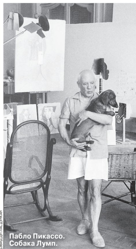
Пабло Пикассо. Собака Лумп.

Так что подзаголовок здесь тоже не совсем корректный. Впрочем, Лумп наверняка с нами согласился бы. И вот почему.