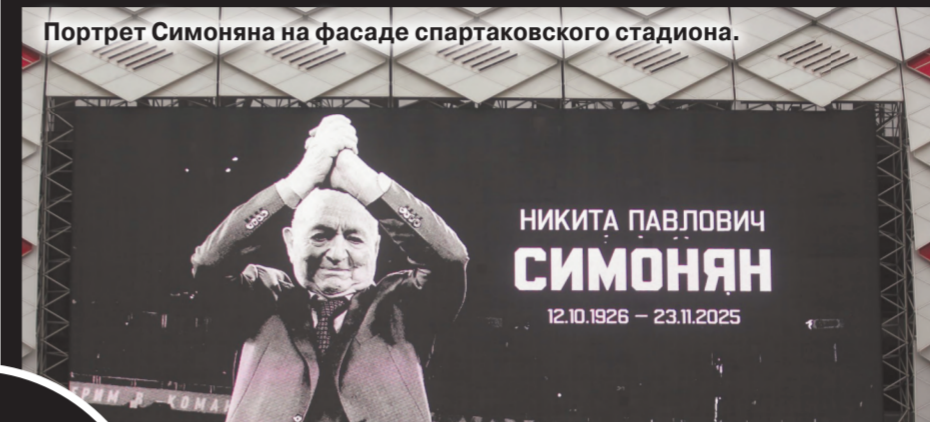
Портрет Симоняна на фасаде спартаковского стадиона.