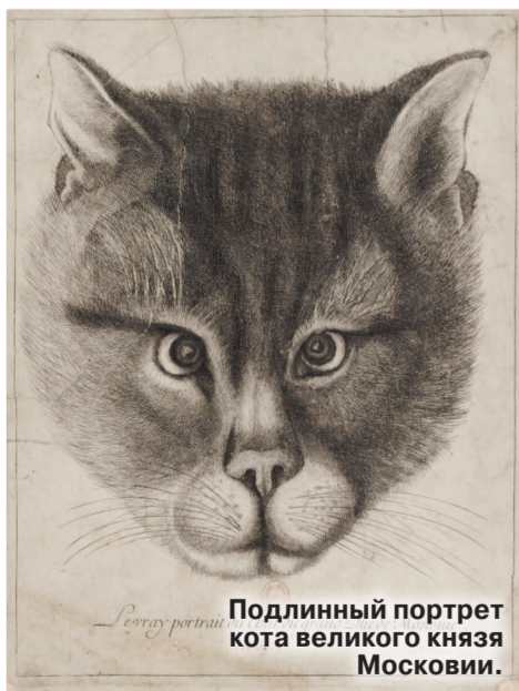
Портрет Вацлава Холлара

В Национальной библиотеке Франции хранится удивительная гравюра, о существовании которой большинство из нас даже не подозревает. «Подлинный портрет кота великого князя Московии» 1663 года — работа чешского художника Вацлава Холлара — единственный подобный образец в истории искусств, считается, что этот портрет — самое раннее изображение домашней кошки на гравюре в России. А изображен на нем любимец самого царя Алексея Михайловича Романова. Имени пушистика история не сохранила, но зато до нас дошел его умильный старинный портрет. Примечательно, что тогда в России подобных живописных образов, настолько реалистичных, было довольно мало, а если и выполнялись чьи-то портреты, то это уж точно не были животные, да и сам портрет в современном его понимании распространен не был — тогда предпочтению отдавали парсуне, раннему жанру портрета, характерному для России в том числе в эпоху Алексея Михайловича.