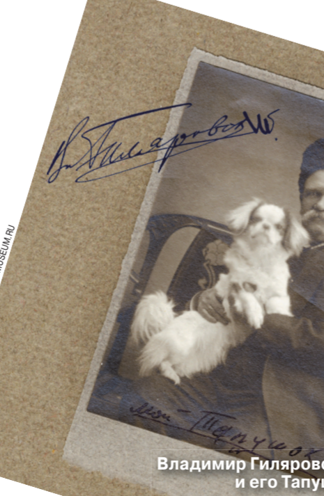
Владимир Гиляровский и его Тапушок.

Сегодня мы назвали бы Гиляровского дог-волонтером — вполне справедливо. Он сам подробно описывал, как жестоко