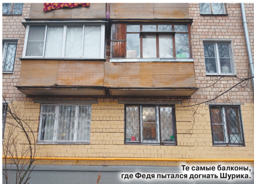
Те самые балконы, где Федя пытался догнать Шурика.

Вот и два балкона, через перила которых пытался перелезть Федя, чтобы ухватить Шурика. Они, конечно, на втором этаже — значим выше, второй и безопаснее, и смотреть удобнее. И место приметное: единственный в этом доме стýк между двумя секциями, где балконы примыкают друг к другу, в остальных местах они одиночны. Увы: теперь оба балкона застеклены, но только не перелезть, но и не представить себе такого. Хотя вон, этаким выше все-таки