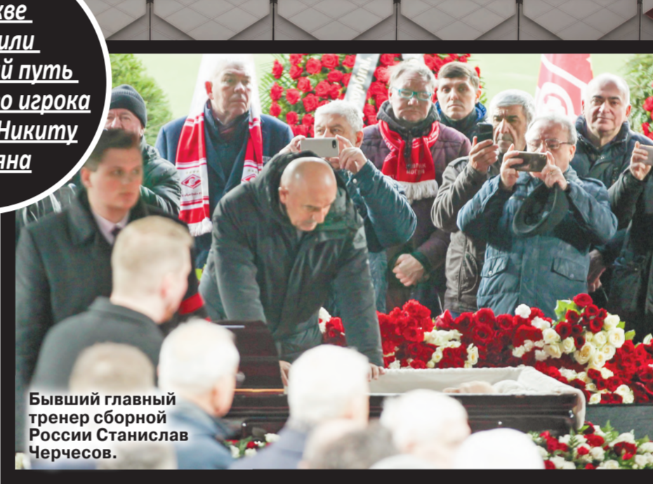
Бывший главный тренер сборной России Станислав Черчесов.

команде Никиту Симоняна ценили товарищи по «Спартак» и нашей национальной сборной, уважали соперники, искренне любили миллионы болельщиков, для которых он был признанным кумиром». После чего от себя Дегтярев добавил, что в его сердце Симонян остался человеком, от которого веяло любовью. «Он всегда делился своим опытом, давал мудрые советы, работал до последних дней. Судьба Никиты Павловича неразрывно связана с нашей страной. Он был с ней в минуты радости и горечи. Он был предан команде, бился за нее и за свою страну. Для всех нас