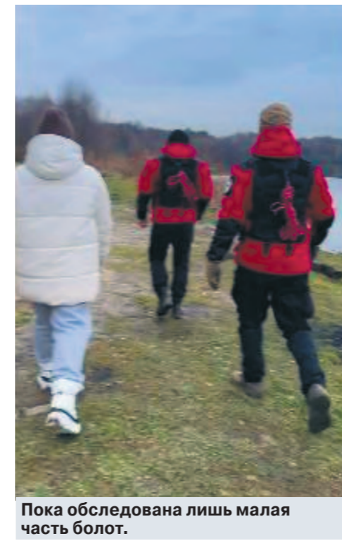
Пока обследована лишь малая часть болот.