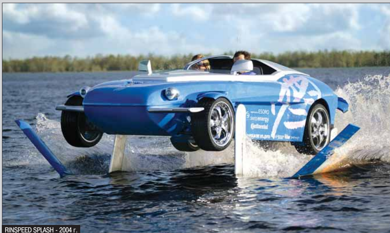
RINSPEED SPLASH - 2004 г.

автономный парковщик, то все будет гораздо сложнее и в споре возникнет еще один субъект, донести до которого аргументы сторон будет непросто, это займет немало времени.