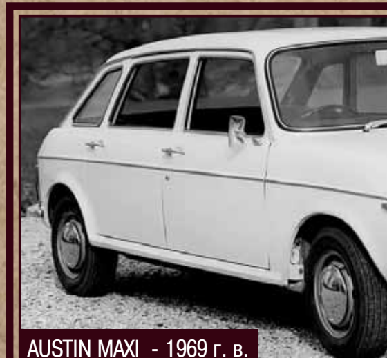
AUSTIN MAXI - 1969 г. в.

опережал мир на добрые десять лет: пятидверный хетчбэк (первый в Британии) с огромным объемом салона (спасибо фирменной поперечной компоновке силового агрегата), 5-ступенчатой КПП и гидравлической подвеской, сохраняющей положение кузова горизонтальным. На практике дело обстояло хуже. Во-первых, машина была непривлекательной. Тут сложились традиционное для Исигониса наплевательское отношение к дизайну и отделке и требование перенести без изменений двери с более крупной модели Austin 1800. Последнее привело к несуразно длинной базе при минимальных свесах — не самый привычный силуэт. Во-вторых, кто-то придумал соединить рычаг переключения скоростей с коробкой тросами: дескать, так будет плавно. Но вместе с резкостью ушла и точность. Журнальные испытатели соревновались в образности при описании переключения передач на Maxi. Например, сравнивали процесс с размешиванием тростью патоки в чане. В-третьих, 1,5-литровый мотор оказался слаб, а другого поначалу не было. Несмотря на все претензии, машину запустили в производство. Но что заметили специалисты, заметили и рядовые британцы. Старт продаж вышел вялым. Это, с одной стороны, подвигло к авральному обновлению Maxi, а с другой — к сокращению программы