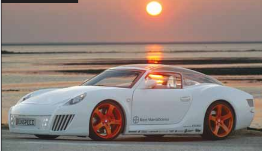
RINSPEED ZAZEN - 2006 г.

Люди хотят и ждут от электроники, чтобы она всегда работала на 100%, но при этом не всегда сами готовы трудиться с такой же самоотдачей и надежностью. Вот почему мы видим большое количество аварий на дорогах. И полностью переложить всю ответственность на электронику не получится никогда. Электроника неизбежно будет допускать ошибки и погрешности. Вместе с тем мы легко принимаем ситуацию, когда ошибку за рулем допустил человек, и очень неохотно принимаем вероятность ошибки электроники. Например, если, паркуясь, вы задеваете чужую машину, то на вас рассердятся, вы расстроитесь, но в конце концов как-то договоритесь между собой и будете жить дальше. А если в вашем автомобиле в такой же ситуации работал так называемый