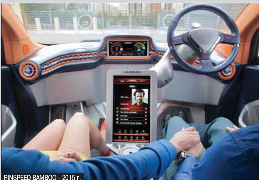
RINSPEED BAMBOO - 2015 г.

берешь и что-то даешь взамен. Тут можно говорить о том, что мы прежде всего осуществляем связь профессионалов, через работу в Rinspeed специалисты узнают о возможностях, потребностях и интересах друг друга.