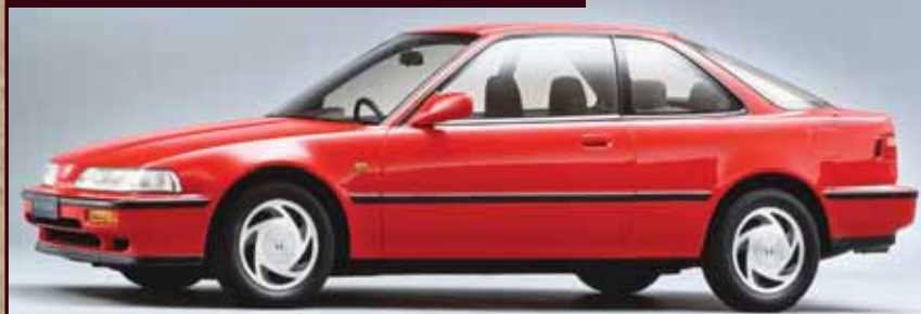
HONDA INTEGRA XSI COUPE - 1989 г. в.

Технология VTEC показала себя на практике с самой лучшей стороны, распространившись с годами на весь модельный ряд «Хонды». Было разработано множество разновидностей под разные задачи. В настоящее время существуют модификации VTEC для работы с непосредственным впрыском, турбонаддувом и даже в составе гибридной силовой установки. ■