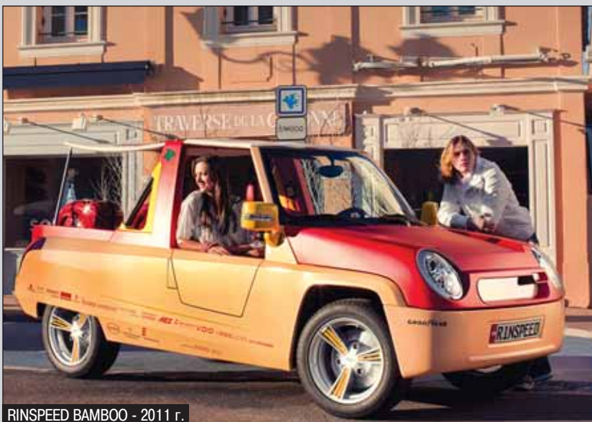
RINSPEED BAMBOO - 2011 г.