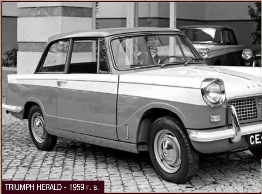
TRIUMPH HERALD - 1959 г. в.