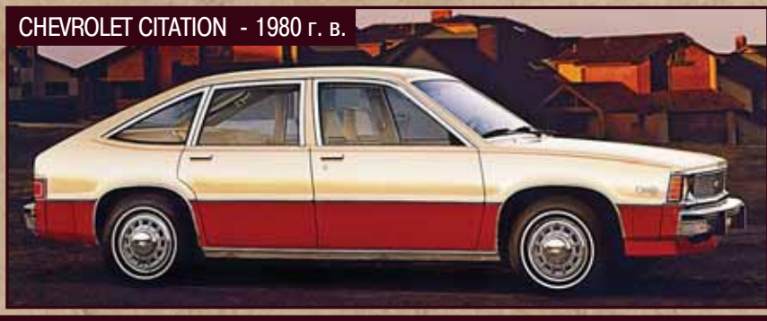
CHEVROLET CITATION - 1980 г. в.

по развитию модели. Уже через год КПП получила «нормальный», жесткий привод; экстерьер и салон оживили, насколько это вообще было возможно; появился более мощный и тяговитый 1,75-литровый мотор (76 сил с одним и 91 с двумя карбюраторами). Однако негативный образ модели уже сформировался, и корпорация British Leyland в этом рыночном сегменте полагалась в дальнейшем на консервативный Morris Marina. Что касается Austin Maxi, то он выпускался до 1981 года, благодаря своей практичности неизменно находя покупателей – достаточно для сохранения на конвейере, но в разы меньше оптимистичных предпремьерных прогнозов.