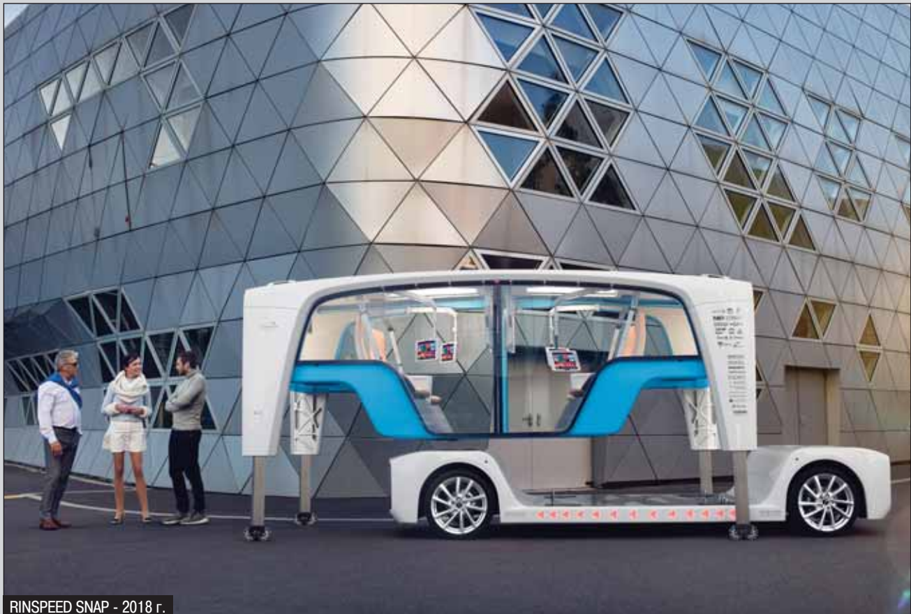
RINSPEED SNAP - 2018 г.

Фрэнк: Да, вы правильно заметили, что такое сотрудничество – это процесс, в котором ты что-то