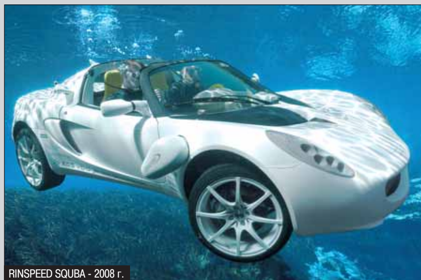
RINSPEED SQUABA - 2008 г.