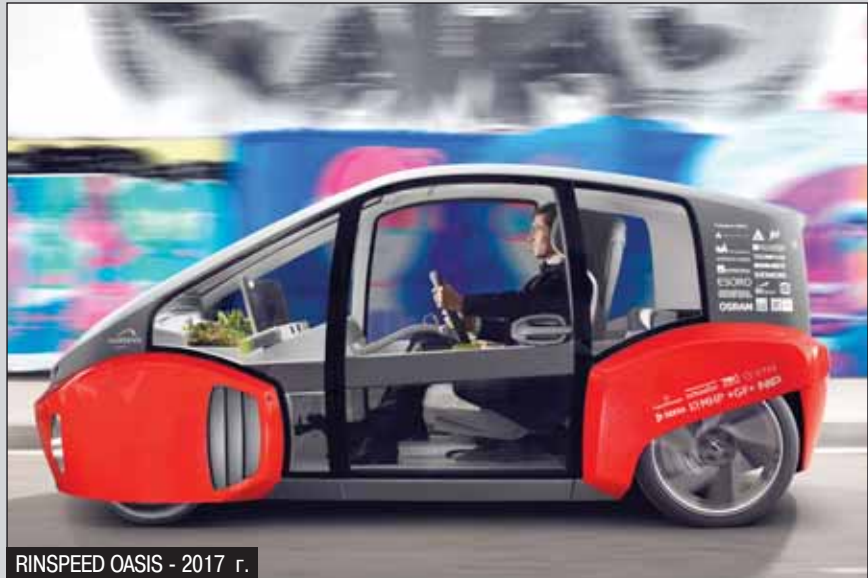
RINSPEED OASIS - 2017 г.

Фрэнк: Я хотел бы провести границу между тем, что мы делали раньше, и тем, чем занимаемся теперь. Фантастические,