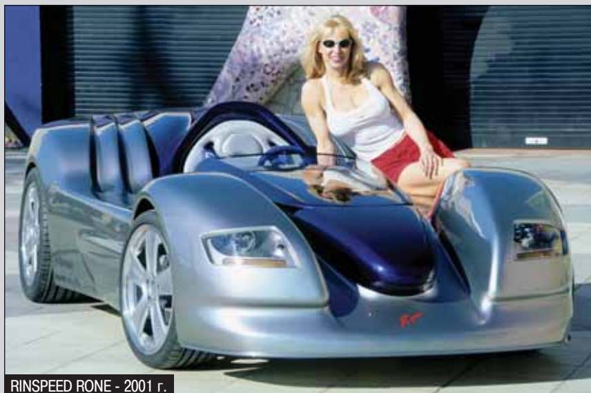
RINSPEED RONE - 2001 г.

некоторое время мы пересмотрели модель бизнеса. Последние 25 лет трудимся над развитием технологий будущего. На ваш вопрос однозначно ответить сложно. Уже 12 лет,