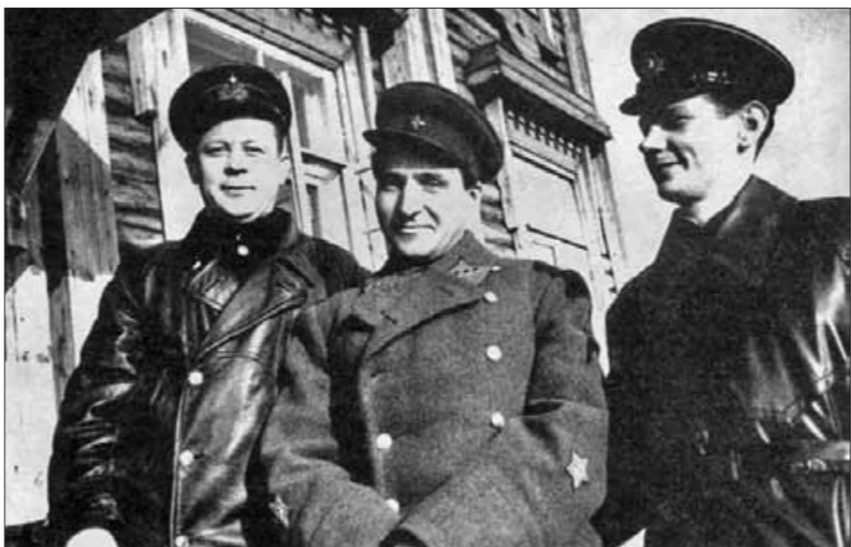
● С военными моряками. Мурманск, весна 1942 г.