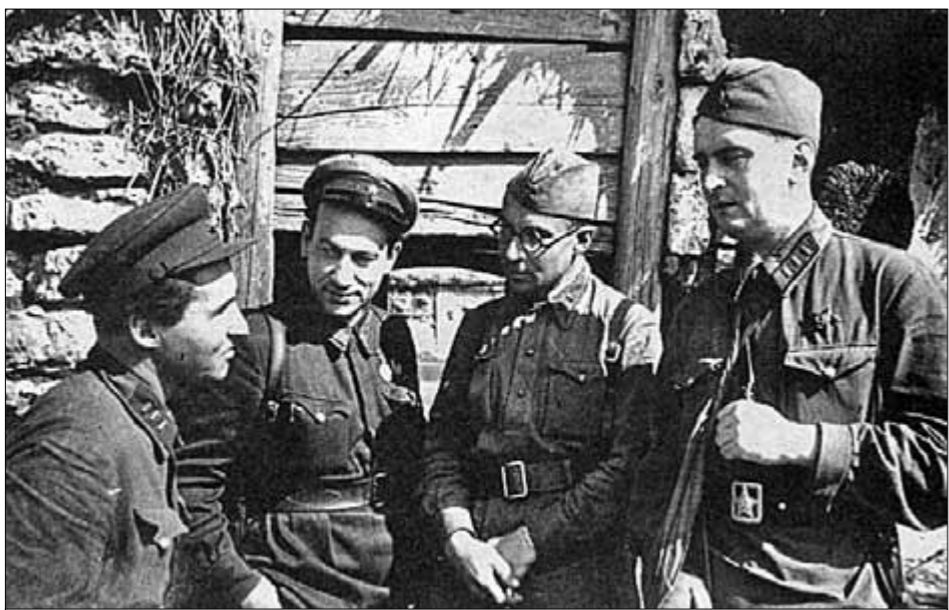
● К.М. Симонов (слева) с военными фотокорреспондентами в дни обороны Москвы, 1941 г.

По Симонову, война для кадрового офицера — это экзамен, который неизменно когда состоится, но к которому надо готовиться всю жизнь. Ни в одной отрасли деятельности не