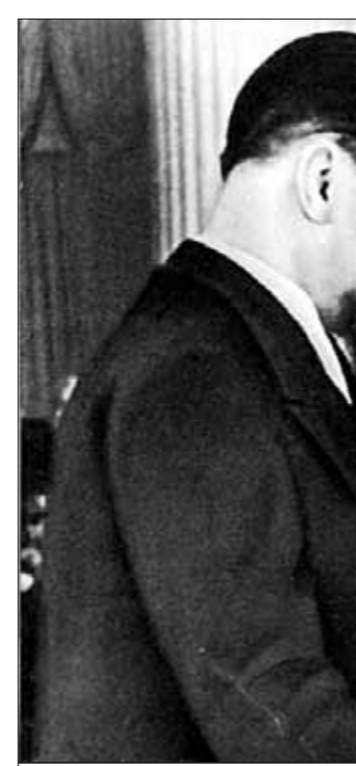
Председатель Президиума Верховного Совета СССР К.Е. Ворошилов вручает третью золотую медаль Героя Социалистического Труда академику И.В. Курчатову.

13 марта 1948 года состоялась вторая, более результативная встреча К. Фука с А.С. Феклистовым. Среди переданных К. Фуком материалов были новые теоретические сведения, относящиеся к сверхбомбе. Экспериментальные данные содержали очень важную информацию о величине сечений некоторых ядерных реакций, необходимую для расчётных оценок возможности термоядерной детонации. Однако переданные