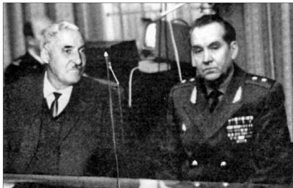
● К.М. Симонов и М.А. Гареев, 1978 г.