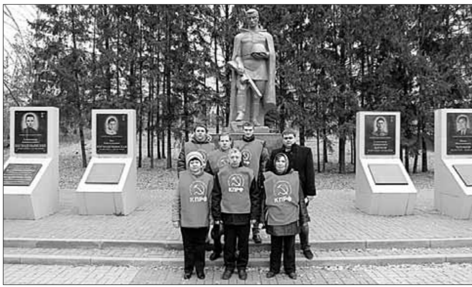
Пресс-служба Тамбовского обкома КПРФ

КОММУНИСТЫ И КОМСОМОЛЬЦЫ Октябрьского района города Тамбова провели агитпробег в Гавриловском районе области. Агитационная бригада, состоящая из восьми человек, побывала в сёлах Гавриловка и Бессоновка. Коммунисты посетили практически каждый дом, квартиру, распространили около 1,5 тыс. экземпляров газеты «Наш голос». Жители района радушно встречали агитаторов, благодарили, многие интересовались, как вступить в ряды КПРФ. Вопреки заблуждениям результатам на выборах кандидатов от «Единой России», в действительности жители поддерживают коммунистов и с нетерпением ждут прихода к власти настоящих патриотов.