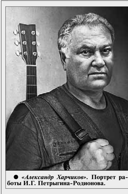
● «Александр Харчи́ков». Портрет работы И.Г. Петрыгина-Родионова.