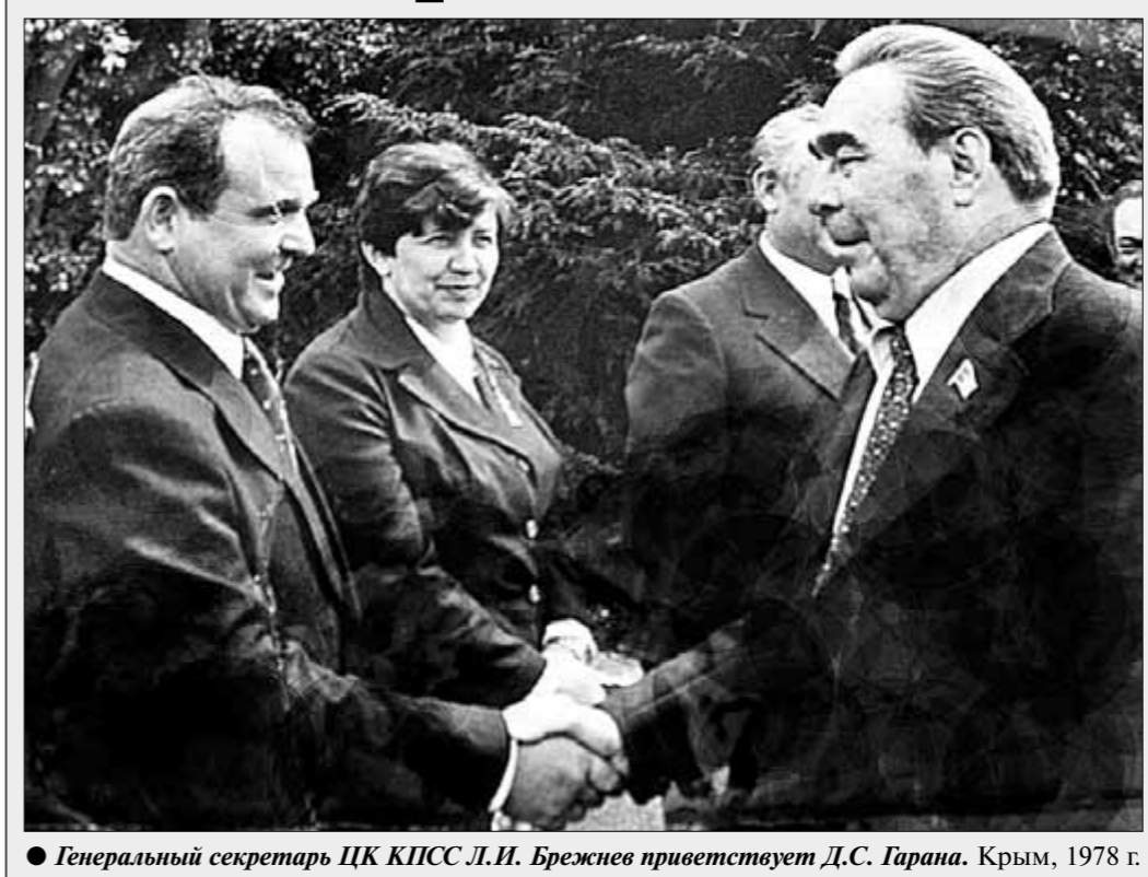
● Генеральный секретарь ЦК КПСС Л.И. Брежнев приветствует Д.С. Гарана. Крым, 1978 г.

ристов, вы остались в родном колхозе и до последнего времени трудились на его земле. Не скучно ли почти 50 лет быть на одном месте и заниматься ежедневно одним и тем же делом?