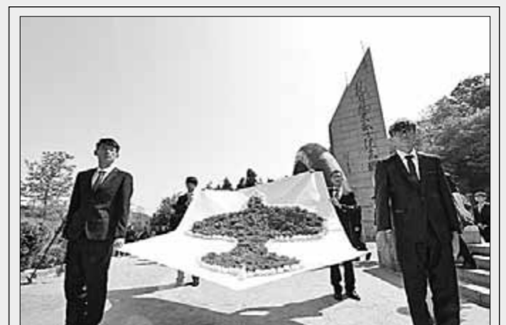
Представители общественности г. Нанкина у мемориала павшим лётчикам-героям почтили память советских добровольцев, отдавших жизнь в боях с японскими агрессорами.

«В этих исторических документах речь идёт о первом сражении, в котором принимали участие советские военнотруженики. 22 ноября 1937 года советский отряд лётчиков-добровольцев совершил первое воздушное сражение в Нанкине.