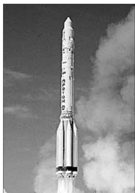
«Протон» может послужить ещё не одно десятилетие.

Случайных людей в руководстве космическими делами раньше не бы-