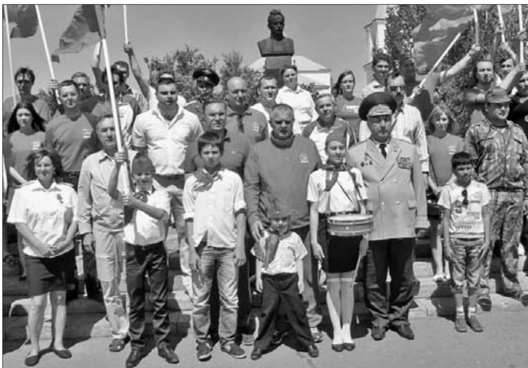
● У памятника писателю.