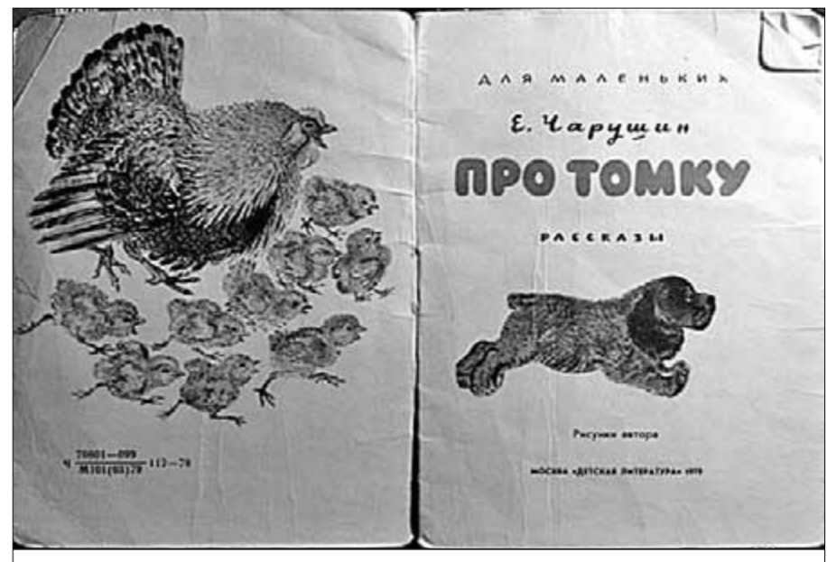
Художник Е. Чарушин.