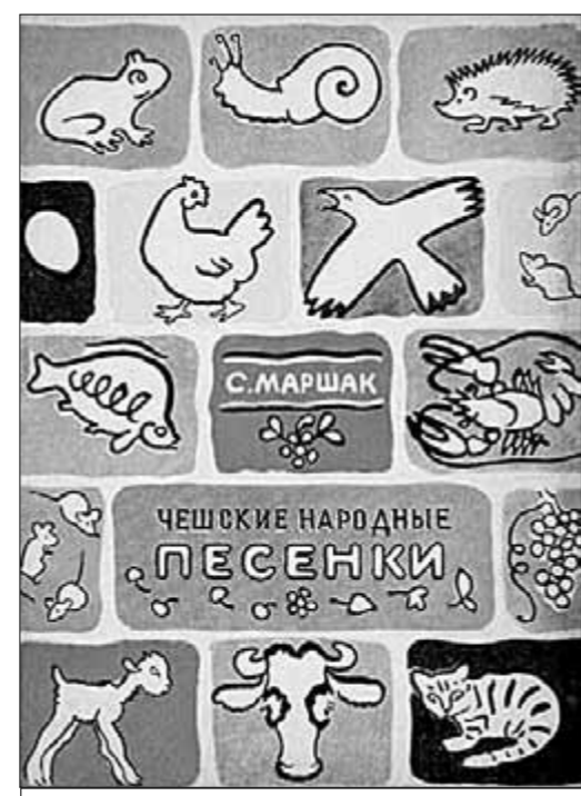
Художник М. Митурич.