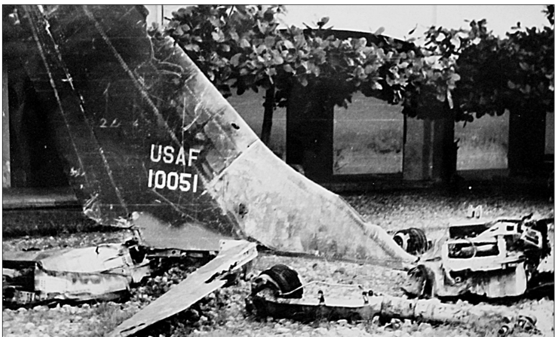
● Американский стервятник, сбитый в небе Ханоя. 1965 г.