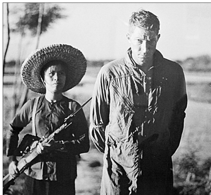
● Ещё один американский агрессор отлетел.