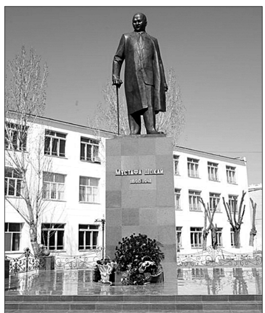
Как заявляют современные биографы Мустафы Шокая, он ужаснулся условиям содержания соотечественников в концлагерях и наотрез отказался возлагать работу по созданию Туркестанского легиона. После этого фашисты якобы решили расправиться с ним.

пье на открытом воздухе устраивались замечательные лекции, политические диспуты. Я тоже прочёл доклад о Туркестане». Очень специфический «концентрационный лагерь», не правда ли? Спустя три недели Мустафу Шокая отправляют в Берлин, где уже началась работа по формированию «национальных частей» — отрядов из попавших в плен представителей различных национальностей СССР. Ему предлагают сотрудничество, и он пишет докладную записку о создании «национально-освободительной армии Туркестана», а также посещает лагерь для военнопленных. Однако во время одной из таких поездок Шокай заразился тифом и 27 декабря 1941 года умер в берлинском госпитале.