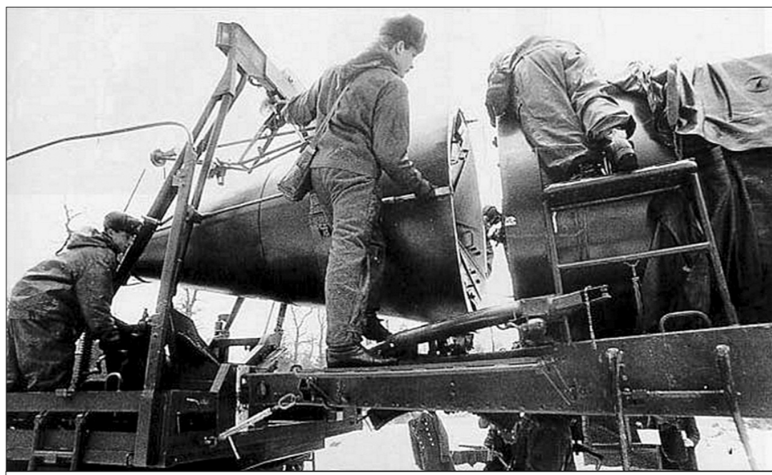
● Установка лёгкой боевой части на ракету Р-12.

— Такие публикации, особенно за рубежом, появляются на протяжении десятилетий. Им нельзя верить. Немецкий физик Манфред фон Арденне не