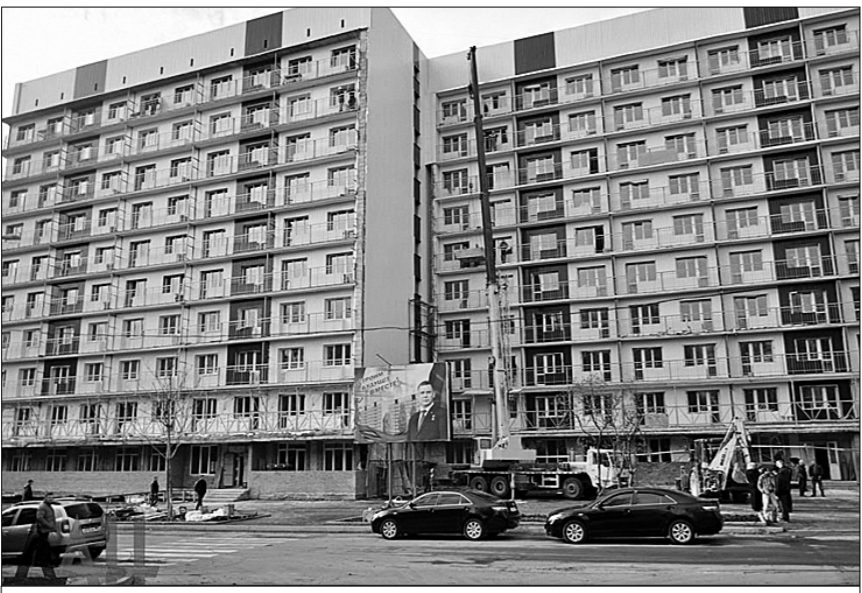
● Полным ходом идёт подготовка новых квартир для переселения семей из разрушенных украинскими войсками домов.

Подразделение базируется в помещениях Донецкого казённого завода химических изделий. В нём есть bunker, где можно укрыться во время обстрелов. А вот жилища расположенных поблизости домов уже более трёх лет приходится быть в постоянном страхе, фактически на линии фронта. «Куда их девать? Ну куда пенсионеры пойдут? Молодёжь поначалу подалась в Россию. Теперь вот возвращаются многие: не нужны они там никому, а у нас, в Донецке, рабочие руки ох как требуются», — поясняет один из ребят.