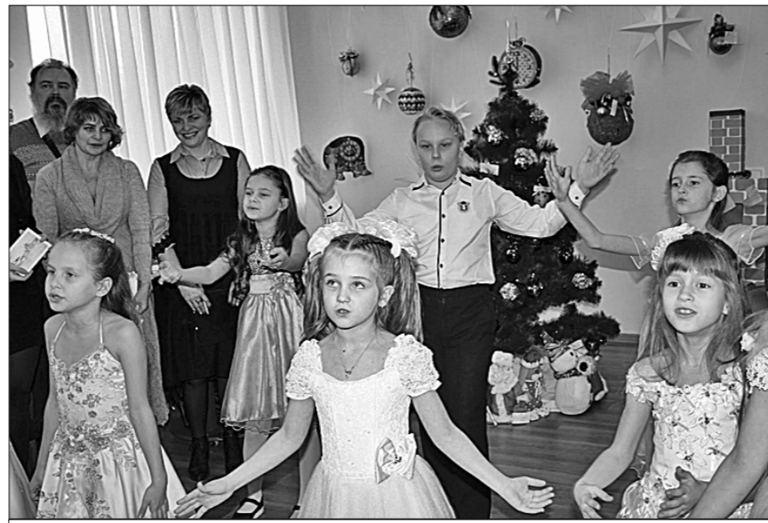
● Участники республиканского конкурса творческих работ «Новогодняя игрушка».

Власти молодой республики научились рачительно использовать каждую копейку. Сейчас 70% стройматериалов поступает из РФ. Упор же в строительной отрасли делается на собственные