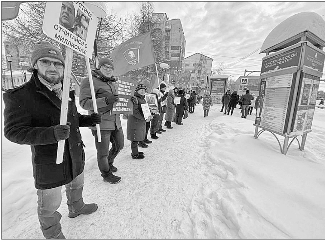
В Сыктывкаре по инициативе горкома КПРФ 2 февраля прошёл пикет, на котором активисты выразили своё негативное отношение к предлагаемым поправкам в Конституцию страны и к новому составу федерального правительства.

ТА ПОСПЕШНОСТЬ, с которой Кремль пытается внести весьма сомнительные изменения в Основной Закон нашей жизни, свидетельствует о том, что на самом верху озабочены лишь одной проблемой: как продлить до бесконечности нахождение Владимира Путина у власти.