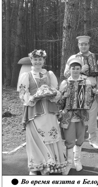
Во время визита в Белоруссию.