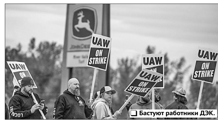
Бастуют работники ДЭК.