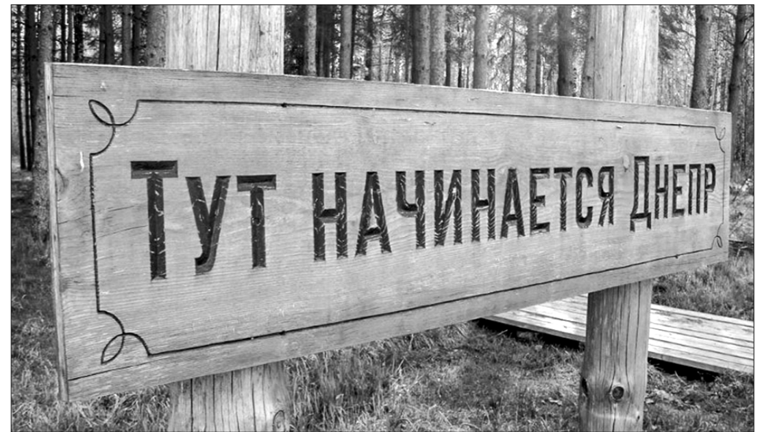
Исток Днепра в Смоленской области.

Однако смоленские областные и городские чиновники, к сожалению, к идее объединения славянских городов Приднестровья отнеслись, мягко говоря, очень прохладно. Губернатор области Алексей Островскому (член ЛДПР) было вручено обращение от ветеранских, патриотических и других общественных организаций. В письме уважаемые граждане разъяснили важность и нужность объединения славянских городов, стоящих на берегах Днепра. Обращение подписали ветераны КГБ и МВД, ветераны госслужбы, представители творческих союзов и разных обществен-