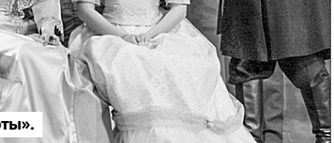
«На всякого мудреца довольно простоты».

Тридцать поражение в Крымской войне — и вслед за ним неизбежно давно назревшие перемены в русской жизни. В ожидании их Островский много и упорно работал и был востребован как лучший драма-