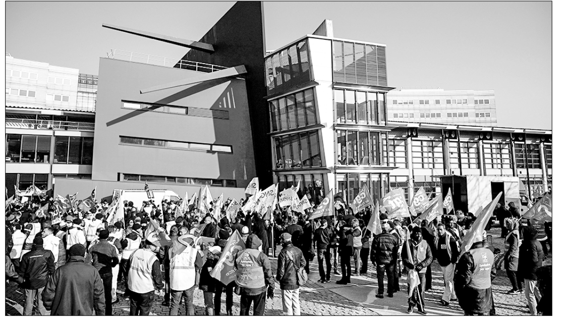
Николай ПЕТРОВСКИЙ. □ Бастующие авиадиспетчеры во Франции.

ше работают в главном терминале «Бритиш эйрвэйз», куда отправляются и прибывают многие международные рейсы, прекратили работу с 31 марта по 11 апреля. Сотрудники службы безопасности бастуют из-за низкой заработной платы после того, как отклонили предложение аэропорта о её повышении на 10%. Авиакомпания в связи с этим объявила, что во время забастовок будет отменять 32 рейса в день, всего более 300 рейсов. Интересно, что европейские авиакомпании, не желая идти навстречу требованиям своих работников и их профсоюзов, одновременно высказывают своё разочарование эскалацией забастовок. При этом они отмечают: «Собственные усилия, направленные в течение нескольких месяцев на решение проблемы нехватки рабочей силы, чтобы вернуться к допандемическому уровню перелётов. Возникает резонный вопрос: зачем же игнорировать законные требования об увеличении зарплат и улучшении условий труда для сотрудников этих компаний, что решило бы многие проблемы самих работодателей?»