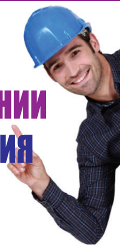
График работы: 2/2 Мы предлагаем: Полное соблюдение ТК РФ. Официальную з/плату. Выплаты 2 раза в месяц. Бесплатную спец. одежду. Корпоративные подарки. Место работы: г. Железнодорожный

Тел. + 7 (985) 741-69-45; + 7 (495) 660-32-05, доб. 55-13