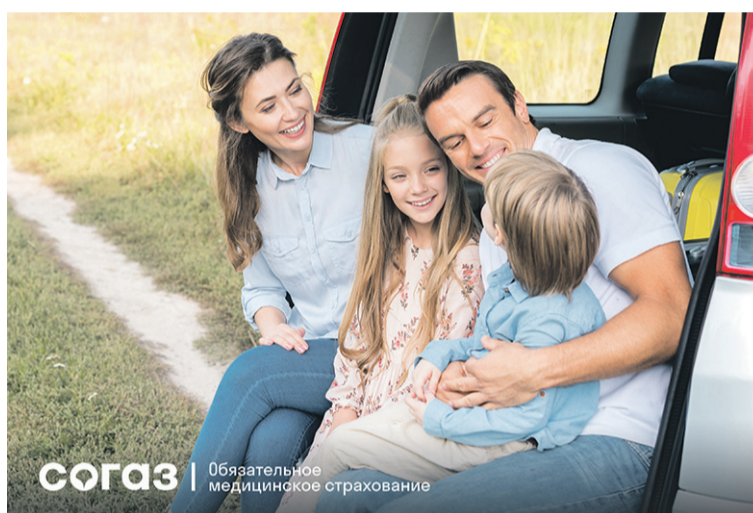
СОГАЗ | Обязательное медицинское страхование

– Страховые компании информируют о возможности прохождения курса реабилитации пациентов, перенесших COVID-19, а именно: граждан в возрасте старше 40 лет, имеющих сопутствующие хронические заболевания, а также застрахованных в возрасте старше 70 лет (для застрахованных старше 70 лет проводится мониторинг своевременности госпитализаций и в необходимых случаях оказывается содействие в её организации). Также граждане всегда могут обратиться к страховым представителям по вопросам получения медицинской помощи, как для лечения COVID-19, так и для прохождения реабилитационного периода, мы всегда готовы помочь и оказать содействие.