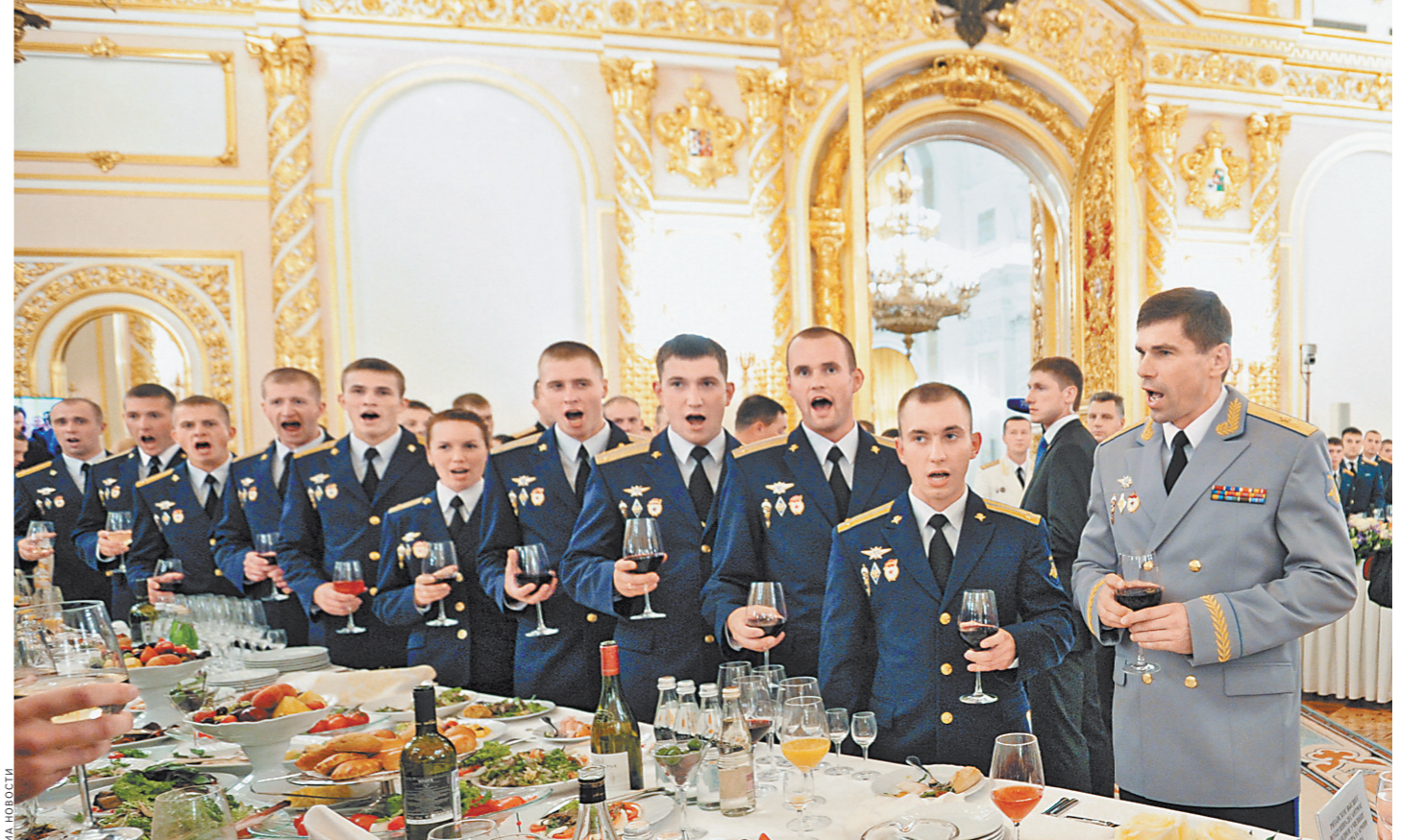
Без троестратного «Урал» не обходится ни один прием в Кремле лучших выпускников военных вузов.