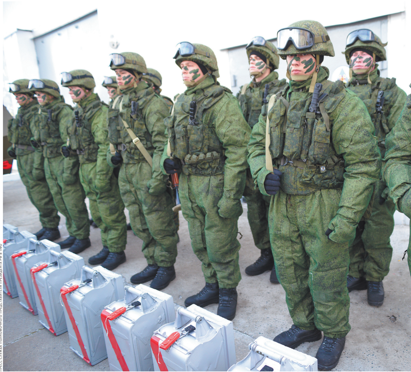
Подразделение постоянной готовности всегда на боевом посту.

В настоящее время Российская Федерация успешно выполняет четвертый заключительный этап Конвенции, в рамках которого предстоит уничтожить оставшийся запас отравляющих веществ. По состоянию на ноябрь 2015 года в Российской Федерации уничтожено 92% имевшихся запасов.