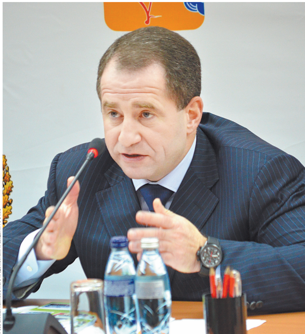
За эти годы ни на одном из объектов не было зафиксировано ни одного чрезвычайного происшествия.

В этой связи приоритетной задачей ОЗХО станет расширение круга участников Конвенции о запрещении химического оружия в мире, а также контроль за строгим выполнением ее положений. В настоящий момент участниками Конвенции являются 192 государства мира. Всего 4 страны — Египет, Израиль, КНДР и Южный Судан — остаются вне правового поля этого международного документа. Государствам-участникам важно принять национальные меры по уголовному преследованию за нарушения Конвенции, организовать сотрудничество с другими странами для выполнения своих обязательств, обеспечить безопасность людей и защиту окружающей среды. Кроме того, необходимо создать эффектив-