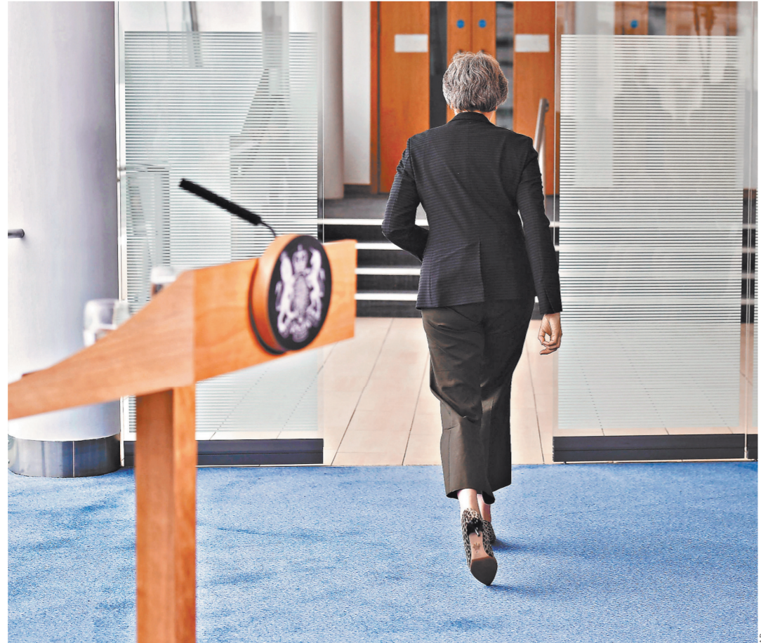
С чем останется Мэй? Возможно, с соглашением, но в одиночестве.

сле выборов 8 июня 2017 года, когда Мэй хотела упрочить свое влияние в Британии, а вместо этого потеряла 12 мест в парламенте, именно юнионисты стали той политической силой, которая, по договоренности с тори, должна была дать им недостающее голоса. Но накануне юнионисты не только воздержались в ходе голосования по финансово-бюджетным вопросам, но еще поддержали поправку оппозиционной Лейбористской партии. И это, конечно, неспроста. По данным источников ВВС в руководстве этой политической формации, это было «политическое послание» Мэй по поводу ее готовности «отделить Северную Ирландию от остальной части Британии». И это послание Тереза Мэй должна расшифровать однозначно — она не сможет «провести» соглашение с Евросоюзом через парламент. ●