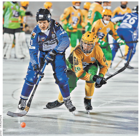
Казанское «Динамо» после шести туров чемпионата российской Суперлиги идет в числе лидеров.

А самое главное, что он по жизни максималист, ведь его девиз — быть первым! Обновленная команда, поддержка правительства, молодой перспективный тренер, верные болельщики, высокие поставленные задачи — всё это будет способствовать развитию данного вида спорта, и не сомневаюсь, что у татарстанского хоккея с мячом перспективное будущее!