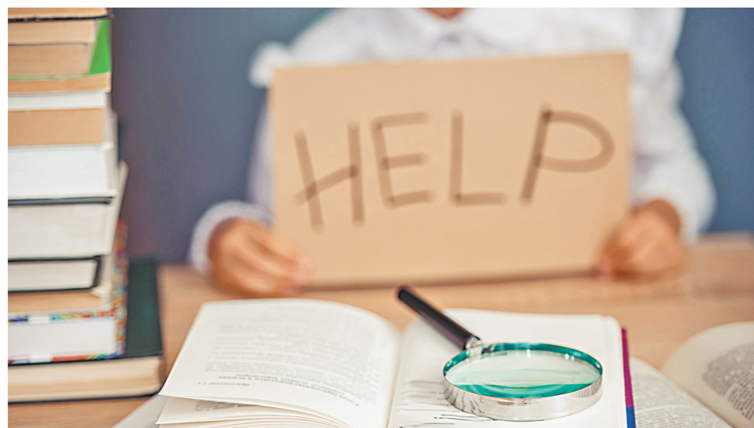
Жестокость в школах — сложнейшая проблема. Зачастую и ученики, и учителя живут в состоянии хронического стресса.

Б уллин, взаимные оскорбления и унижения, физическое насилие... Когда школа превратилась в арену для взаимной травли? Почему учитель, который когда-то для многих семей был родным и близким человеком, превратился в мучителя? Вот факты. Сахалин: учительница русского языка и литературы унижает девочку перед всем классом, называет ее «приемной» из-за дырки в кофте. Оренбург: учитель физкультуры надел на голову третьеклассника плавок. Томская область: учительница ударила второклассника головой о парту, став фигурантом уголовного дела. Но самое тиражируемое видео последних недель — из Комсомольска-на-Амуре.