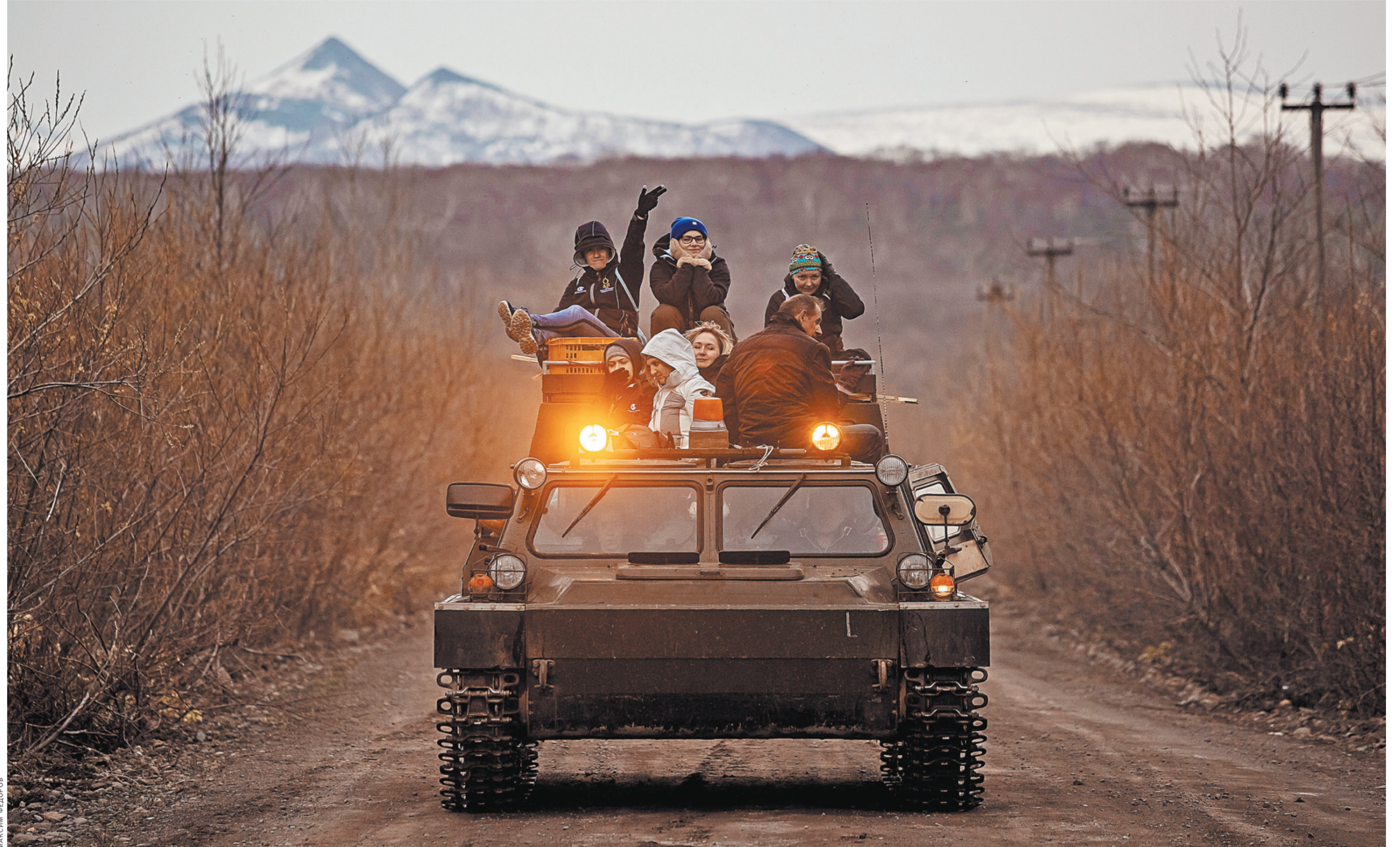
Врачи экспедиции «Рубеги России» возвращаются в Курильск после рабочего дня.