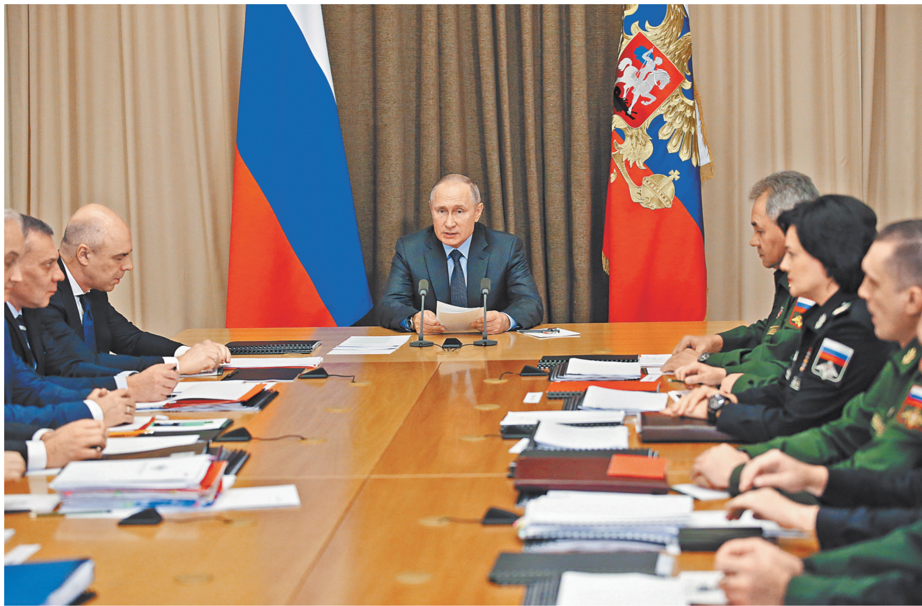
Владимир Путин продолжил серию совещаний по военной тематике.