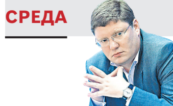
Андрей Исаев первый заместитель руководителя фракции «Единая Россия» в Государственной Думе