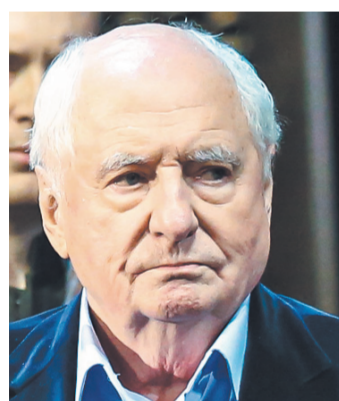
Первым лауреатом премии «Достояние российского театра» стал Марк Захаров.