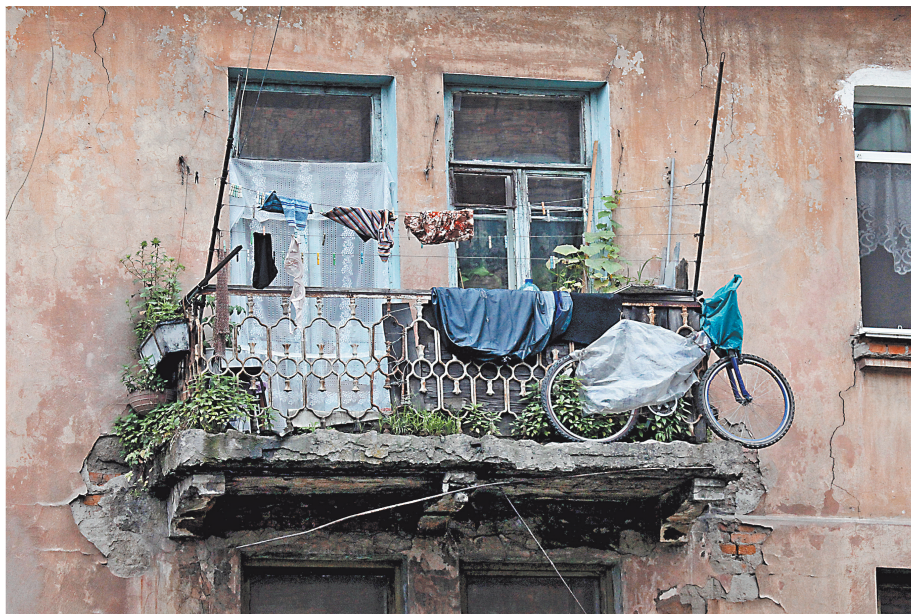
До нового года предстоит дополнительно расселить 200 тысяч квадратных метров аварийного жилья, которые были выявлены в 2017 году.

1 < Сколько в этом году еще осталось людей, которых нужно расселить из аварийного жилья?