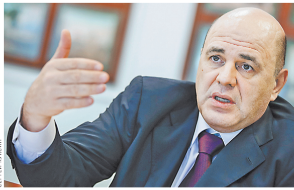
Михаил Мишустин: Кассовая реформа позволила создать условия для снижения расходов бизнеса.

Новая система — это не только комфортные условия ведения бизнеса, включая отмену во всех форм кассовой отчетности, электронную регистрацию касс, снижение контрольной нагрузки со стороны налоговых органов, но и выравнивание конкурентной среды, качественно новый уровень защиты прав потребителя, легализация теневой части потребления и рост поступлений в бюджет. Технология онлайн-касс заложила основу для цифровой трансформации сферы ретейла и открыла новые возможности для бизнеса, потребителей и государства.