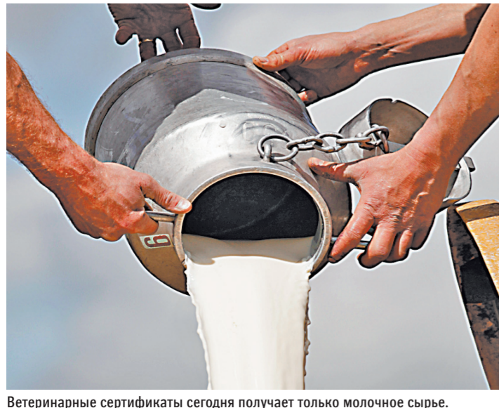
Ветеринарные сертификаты сегодня получает только молочное сырье.

На бумажных сертификатах бизнес терял из-за бюрократии и коррупции до 30 миллиардов рублей в год