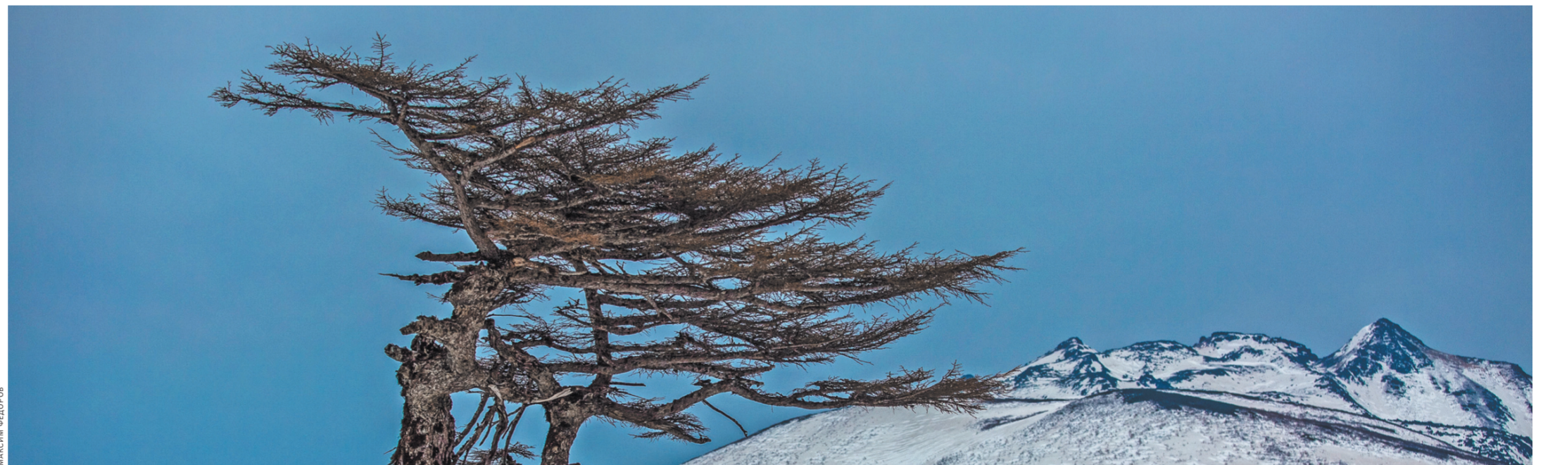
Суровая красота и вулкан Богдан Хмельницкий.