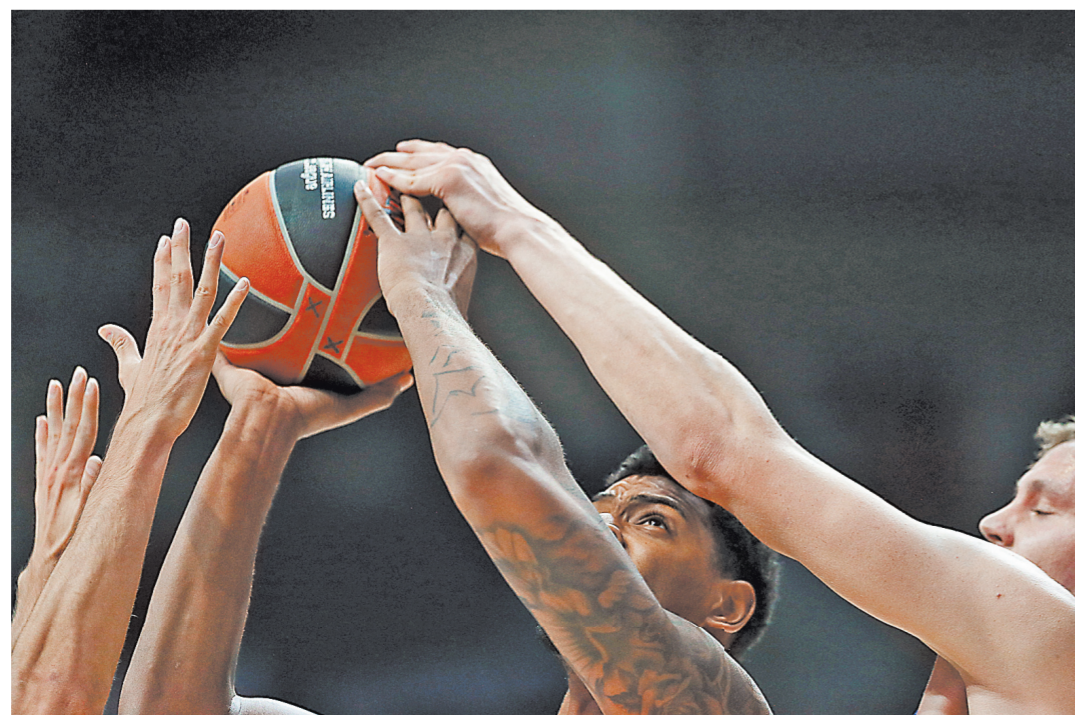
Чтобы уйти с предпоследнего места в Евролиге, «Химкам» надо обязательно обыграть «Будучность».