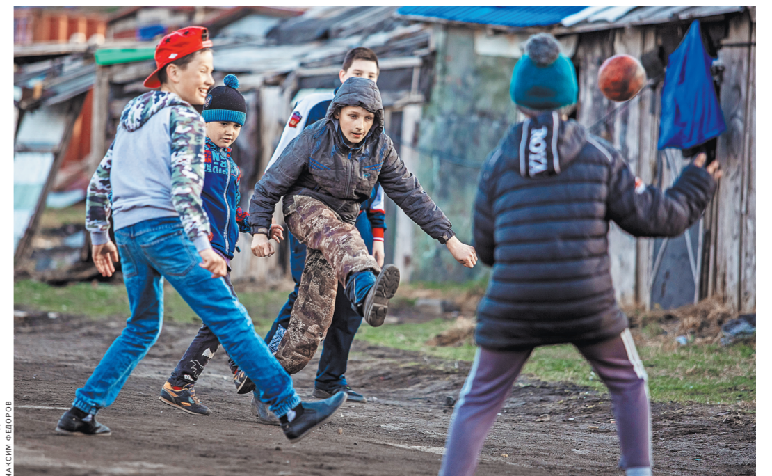
Дворовый футбол до сих не вышел из моды на Итурупе.