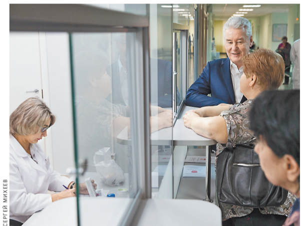
Сергей Собянин во время визита в диагностический центр № 5 пообщался не только с врачами, но и с пациентами.

— Фоторепортаж на сайте rg.ru/sujet/1560