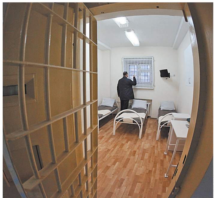
Теперь подробно прописана процедура, как пригласить в СИЗО нотариуса.

Нотариус Москвы или лицо, его замещающее, вправе совершать нотариальные действия в любом из следственных изоляторов города. Однако раньше организация свиданий нотариуса с заключенным зачастую затягивалась по организационным при-