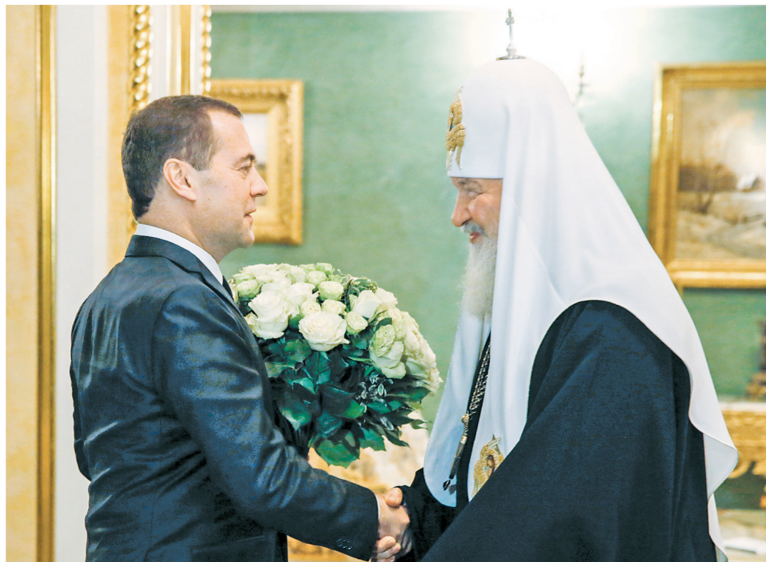
Дмитрий Медведев пожелал Патриарху здоровья и сил для того, чтобы исполнять первосвятительское служение.

— Сердечно вас поздравляю, Ваше Святейшество, с днем рожд-