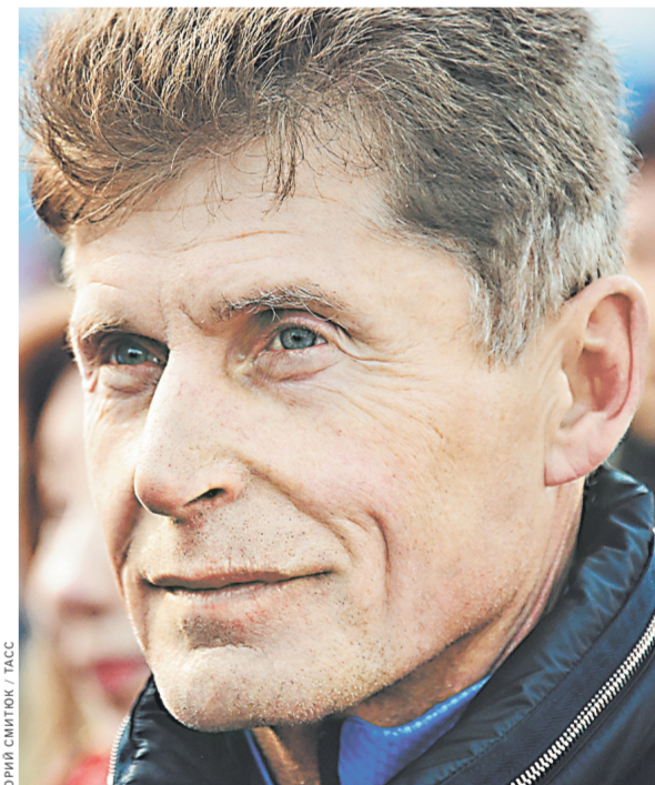
Олег Кожемяко примет участие в выборах в качестве самовыдвиженца.

Среди реальных дел, в которые скептики не верили, стал проект «Приморская рыба». В крае рыба здесь была дороже, чем в далекой Москве, а власти и сами добытчики только разводили руками: дескать, во всем виноваты посредники, которые взвешивают цены. Но уже через месяц Олег Кожемяко смог заключить соглашение о сотрудничестве между рыбооблававшими предприятиями Дальнего Востока и торговыми сетями края, установившие предельную цену на семь видов рыб. Действует