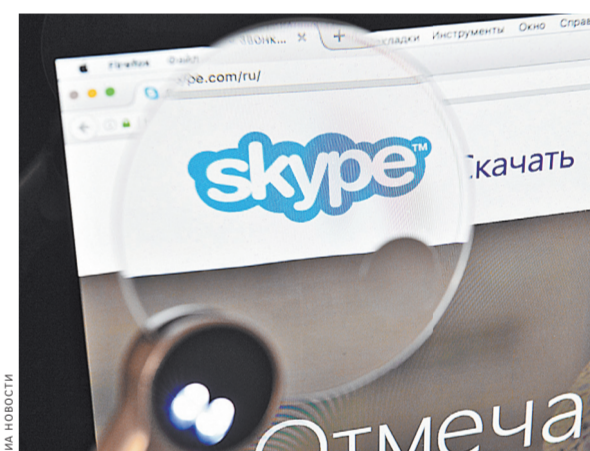
Как выяснилось, программа уже не пользуется большой популярностью у пользователей, ее вытеснили более современные аналоги.

Подготовили Александр Гавриленко, Ирина Варламова, Елена Мационг