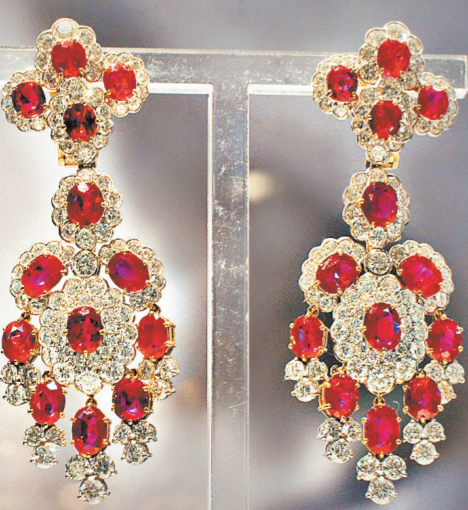
В этих серьгах вставки из рубинов и бриллиантов. Подобное украшение однозначно лучше задекларировать при ввозе.