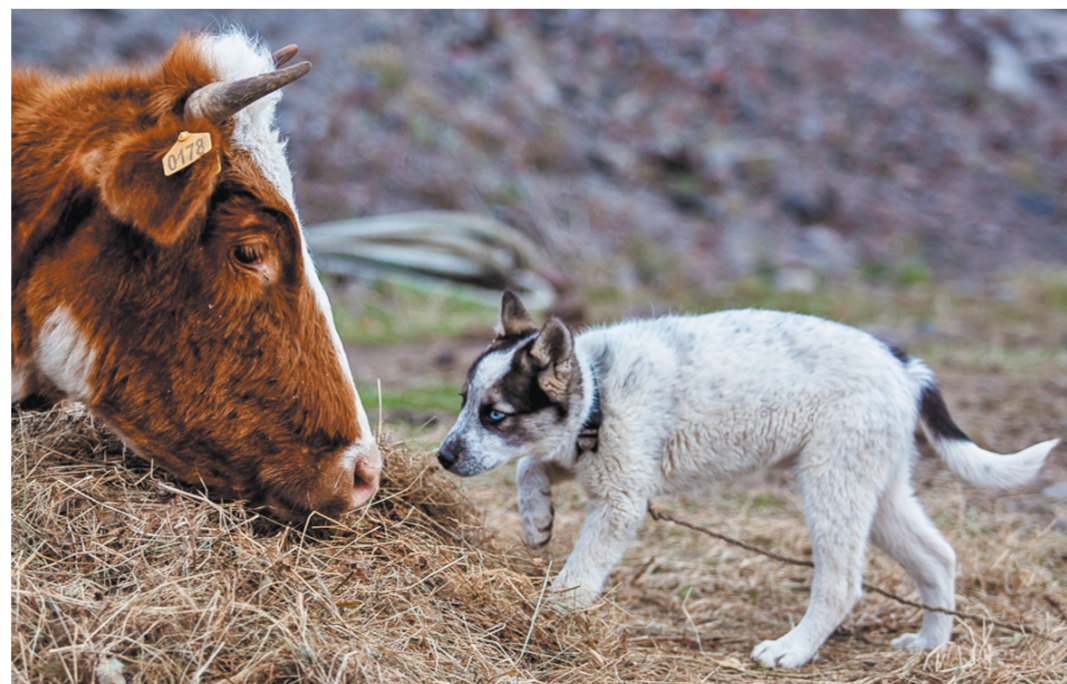
Зорька провалилась в ущелье. Собака неделю ее охраняла, и благодаря истощенному лаю псыни люди узнали о беде.