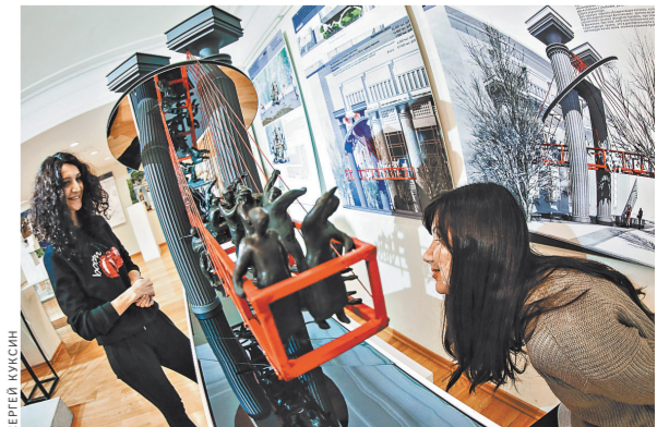
Создание макетов будущего памятника москвичи уже знакомятся в здании Союза архитекторов России.