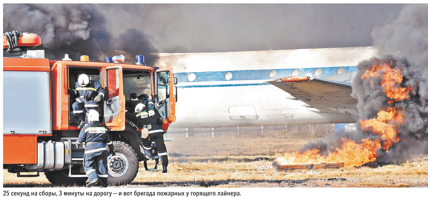
25 секунд на сборы, 3 минуты на дорогу — и вот бригада пожарных у горящего лайнера.

РАКУРС В Новой Москве открылась крупнейшая электростанция Есть контакт