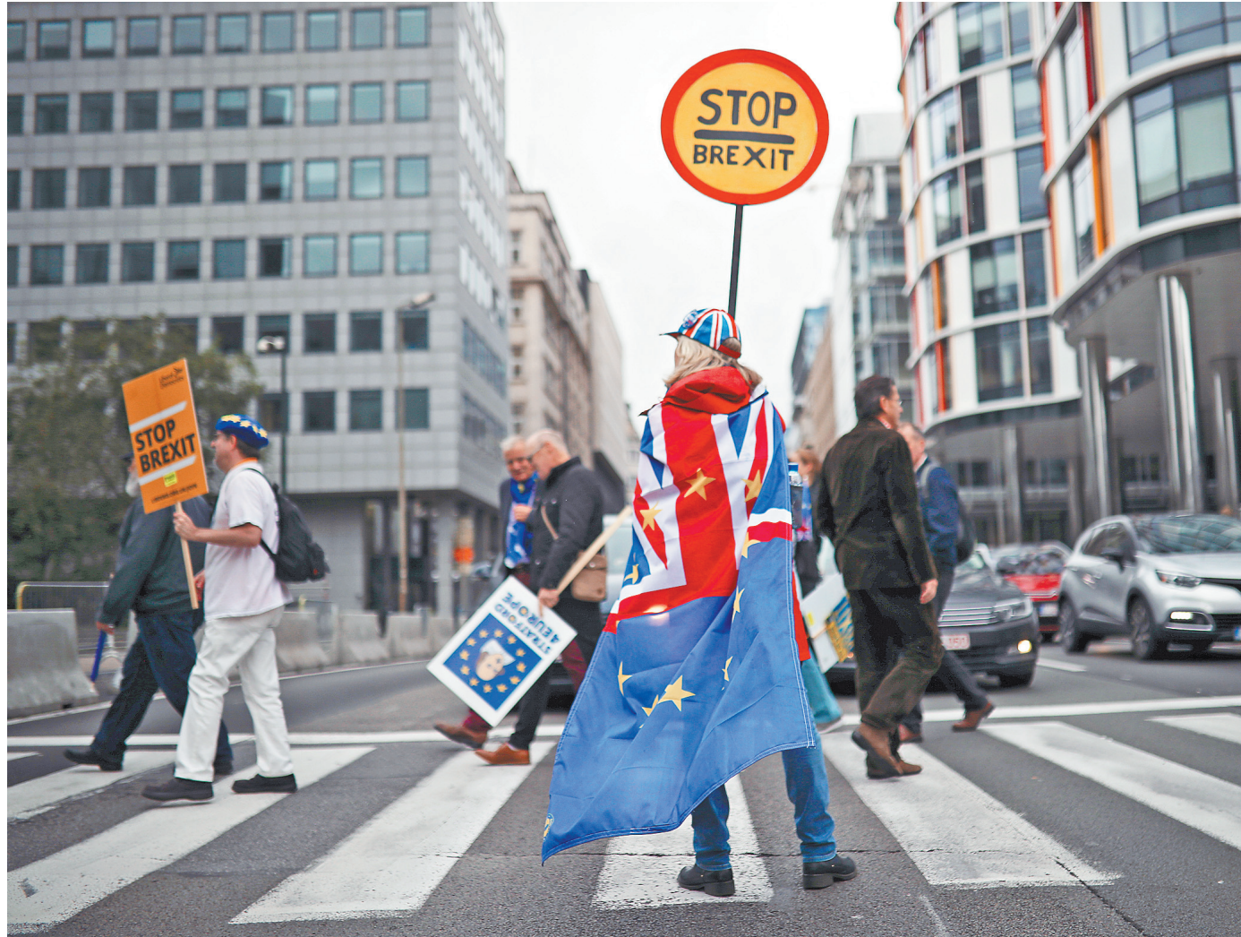
В Брюсселе к саммиту готовятся не только представители стран-членов ЕС, но и местные противники «брекзита».

Напомним, что в случае, если к 19 октября британский парламент не одобрит какое-либо соглашение, премьер обязан попросить у Брюсселя отсрочки. Ранее Борис Джонсон клялся, что не сделает этого ни при каких обстоятельствах. Однако, по информации собеседников издания The Daily Telegraph, даже среди убежденных брекзитеров уже нет прежней уверенности, что выход должен любой ценой состояться 31 октября. Многие из них считают, что если при этом Джонсон не нарушит обязательство осуществить «брекзит», можно было бы и по-