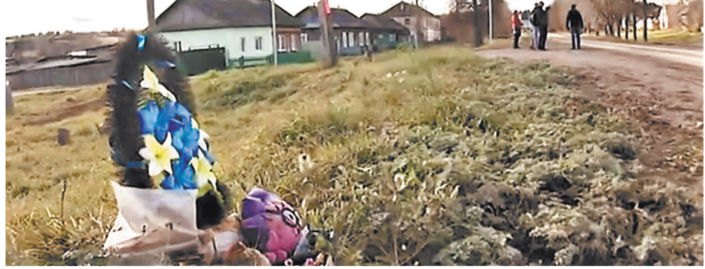
На месте гибели мальчика лежат его любимые игрушки.

ПАМЯТЬ Даниил Гранин продолжает учить «прощать и помнить»