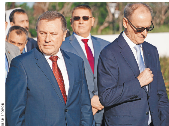
Посол России на Кубе Андрей Гусков и секретарь Совета безопасности РФ Николай Патрушев.

Наиболее серьезно это, в частности, сказалось на энергетической безопасности республики. Последнее время на Острове регулярно случаются перебои с по-