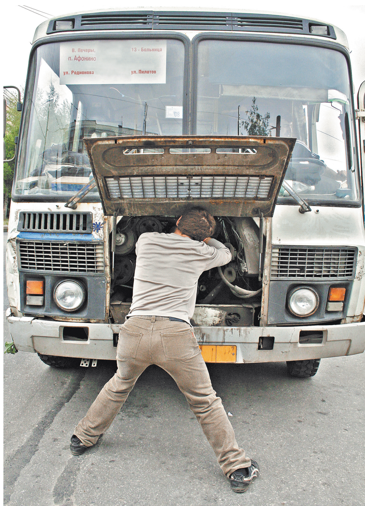
Перевозчики оттягивают ремонт до последнего — на плановое ТО нет денег. И если сохранять низкие социальные тарифы, нужны дотации на безопасность.

1 < Если, например, сломаются одновременно несколько автобусов, придется выводить на линию другой без маршрутной карты, чтобы не сорвать перевозку. Так что для эффективной борьбы с нелегальными такси нужно обеспечить наличие маршрутной карты и свидетельства на право эксплуатации маршрута.