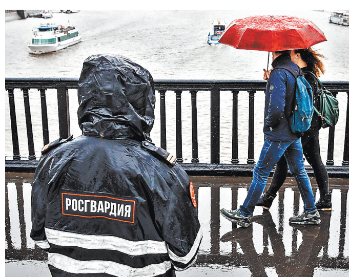
Обязательная проверка росгвардейцев на детекторе лжи поставит заслон взяточникам, негодяям и просто дуракам.

Например, таким исследованием подлежали бы все граждане России, получающие и имеющие доступ к сведениям, составляющим государственную тайну. А сведения эти есть в любом ведомстве, даже в министерстве культуры. По сути, прозрачные стали бы все отечественные чиновники, высокопоставленные и не очень. В первую очередь, конечно, правоохранители и силовики — полицейские, военные, чекисты, прокуроры, судьи, спасатели, таможенники, тюремщики. ■