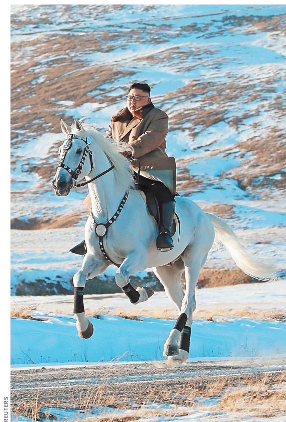
Ким Чен Ын заручился поддержкой «священных сил» вулкана.

Лидер Северной Кореи Ким Чен Ын вновь привлек к себе всеобщее внимание, забравшись на белом коне на священный корейский вулкан Пэктусан. Если для обычных людей это выглядит как простой пиар-ход или некоторое поперство, то у экспертов на этот счет иное мнение: обычно это место вождь Страны чучхе посещает перед принятием важных решений. Не исключено, что Ким Чен Ын стал готовиться к ухудшению отношений с США и новому витку напряженности в регионе.