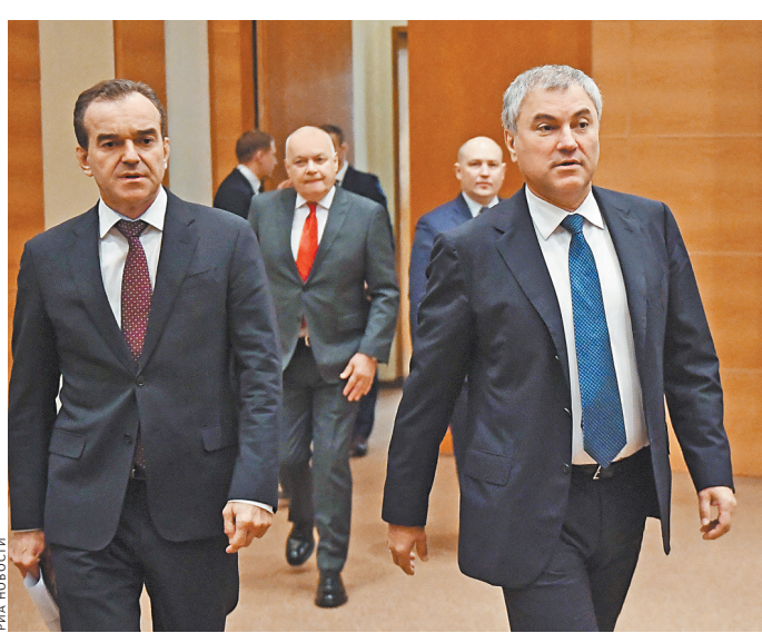
Вячеслав Володин (справа) считает, что с принятием базового закона 2020 год станет годом создания в стране отрасли виноградарства и виноделия.

Сроки прохождения закона обещают быть сжатыми. «Этот базовый закон, и если сможем принять его до конца года, мы сможем уже с уверенностью говорить, что следующий станет годом создания отрасли виноградарства и виноделия», — заявил спикер Госдумы Вячеслав Володин. Он добавил, что закон позволит создать рабочие места, увеличить доходы бюджетов винодельческих регионов — Крыма, Кубани, Ставрополья, Ростовской и Астраханской областей, Дагестана. ●