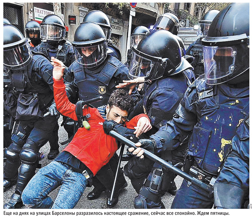
Еще на днях на улицах Барселона разразилось настоящее сражение, сейчас все спокойно. Ждем пятницу.

Международный аэропорт Барселона в среду тоже работал в обычном режиме, и даже не было видно никакого полицейского усиления. При этом в воскресенье там пришлось отменить десятки рейсов из-за того, что протестующие перекрыли дорогу и вход в само здание, и тысячи людей не смогли попасть на самолет. Но это не означает, что в любой момент толпы недовольных не могут заблокировать его снова. Как и весь город. Ждем пятницу. ●