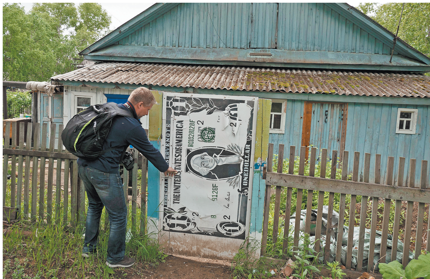
Платить дачные взносы лучше вовремя. Пока их не списали со счета в банке.

По новому дачному закону, кстати, перечислять взносы на счета СНТ можно только безналично. Однако на практике эта норма работает не везде. По информации Союза дачников Подмосквы, до 20 процентов председатели продолжают собирать взносы наличными, потому что нет ни контроля, ни ответственности. Существуют также недобросовестные правления, которые ежегодно состав-