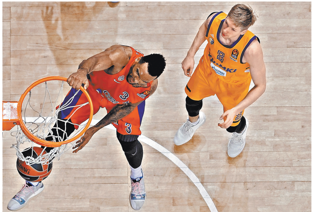
В рамках Евролиги ЦСКА пока ни разу не проиграл «Химкам» на домашней площадке.

18 октября, пятница, «Матч ТВ» 21.25. «Олимпиакос» (Греция) — «Зенит» (Санкт-Петербург). Прямая трансляция.