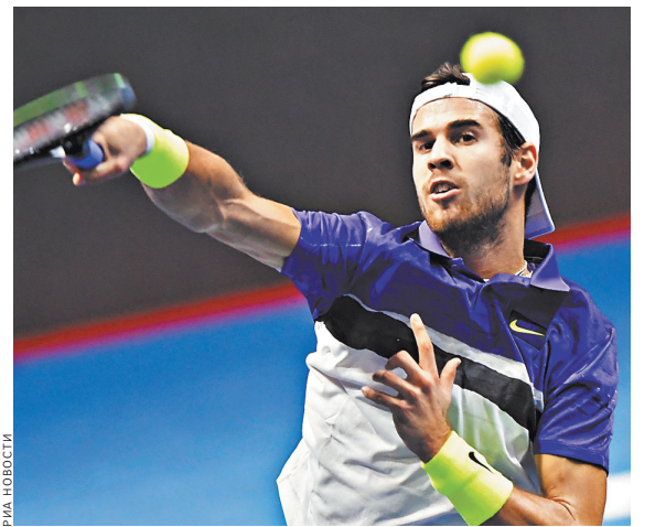
Карен Хачанов был приятно удивлен тем, что уже в первом круге играл в Москве при полных трибунах.

Победу в Китае Даниил отпраздновал в минувшее воскресенье, после чего прилетел в Москву, где должен был выйти на домашние корты. Однако из-за сильной физической и моральной усталости он решил не рисковать и отказался от участия. В концовке сезона россиянину еще предстоит сыграть на более важных турнирах, в том числе на Итоговом чемпионате в Лондоне и в финале командного Кубка Дэвиса в Мадриде. ●