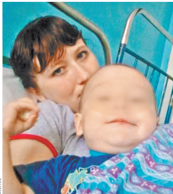
На память осталось только фото с любимым сыном.

Андрей Андреев, «Российская газета», Киров, Наталья Козлова