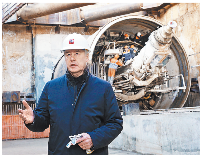
Мэр Москвы Сергей Собянин осмотрел стройку Большой кольцевой линии в районе Зюзино, где появятся три новые станции.