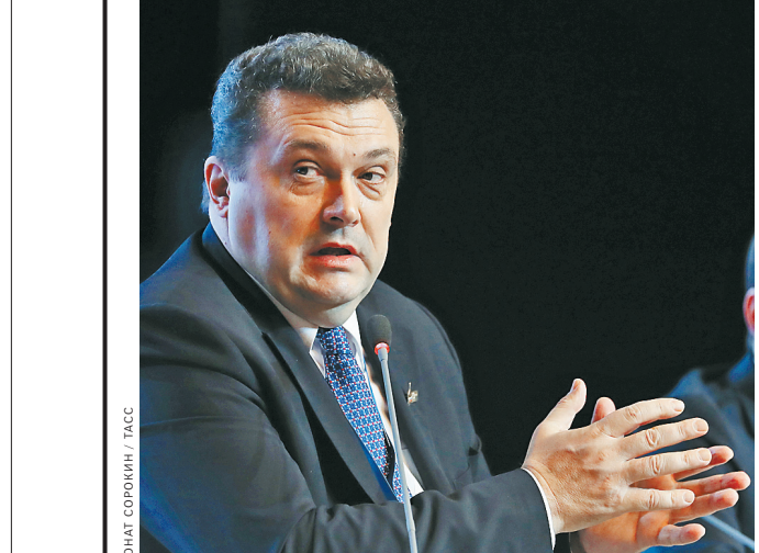
Владимир Соловьев — всегда в прекрасной творческой форме, неравнодушный, доброжелательный и очень мобильный.