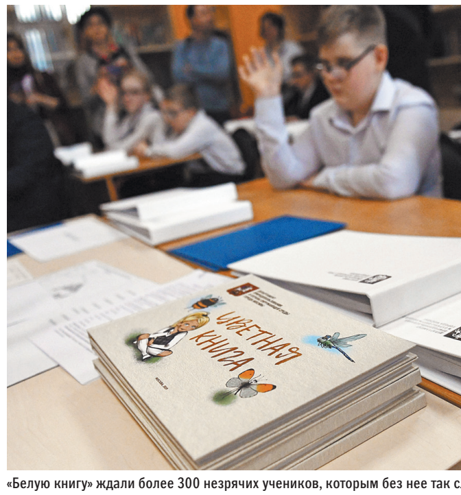
«Белую книгу» ждали более 300 незрячих учеников, которым без нее так сложно представить красоту природы.

— Фоторепортаж смотрите на сайте rg.ru/sujet/1560