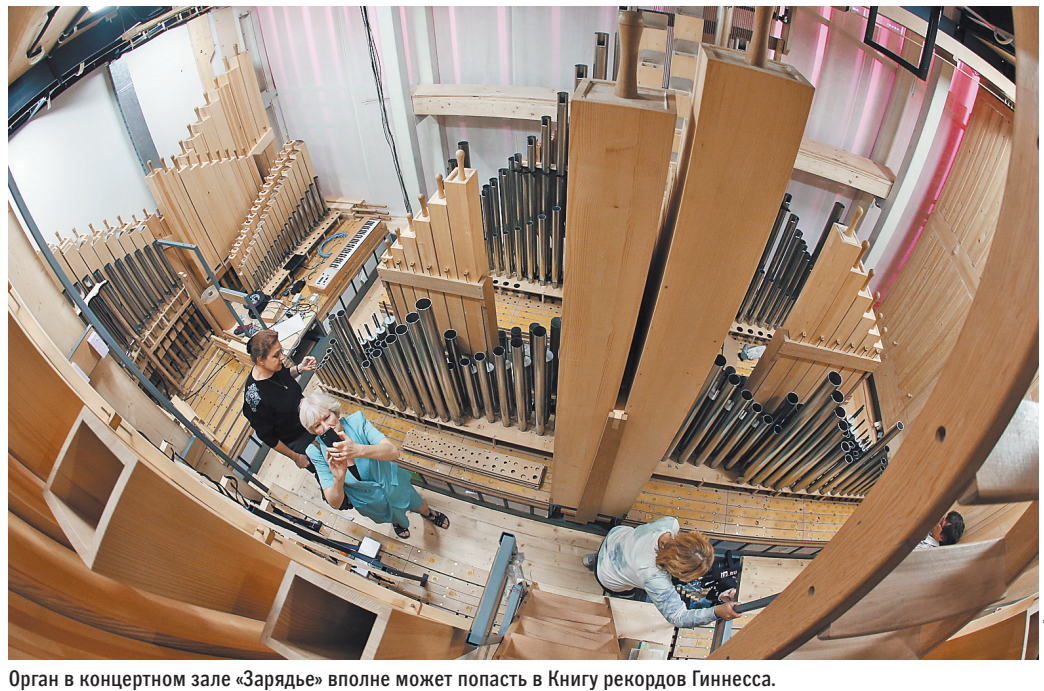
Орган в концертном зале «Зарядье» вполне может попасть в Книгу рекордов Гиннесса.

Потому что орган — король инструментов, уникальный товар. Орган, подобный тому, какой мы открываем, в мире появляется, наверное, раз в 100–150 лет. Это будет самый большой орган в Москве и один из самых крупных в Европе: в нем будет порядка 6 тысяч труб, 85 регистров.