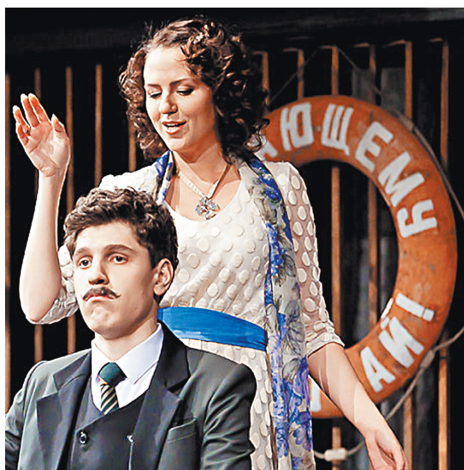
За 30-летнюю историю НГДТ поставил более 120 спектаклей. Каждая новая постановка — событие. Теперь театр в очередной раз выгоняют из дома.

Наталья Решетникова, «Российская газета», Новосибирск