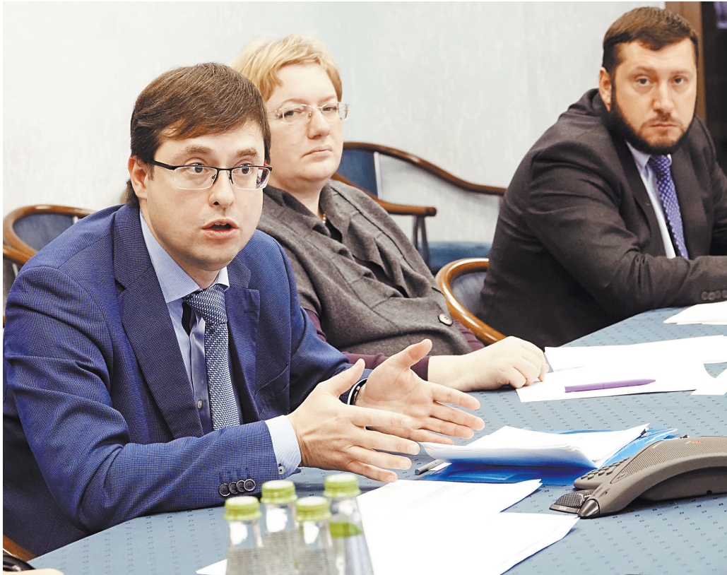
Алексей Лащёнов: В этом году льготы в беззаявительном порядке уже получили 5,6 миллиона граждан.

Их получили 5,6 миллиона граждан, уточнил Алексей Лащёнов. «Мы обменялись информацией с Пенсионным фондом России, с органами соцзащиты населения в регионах и с органами Росреестра».