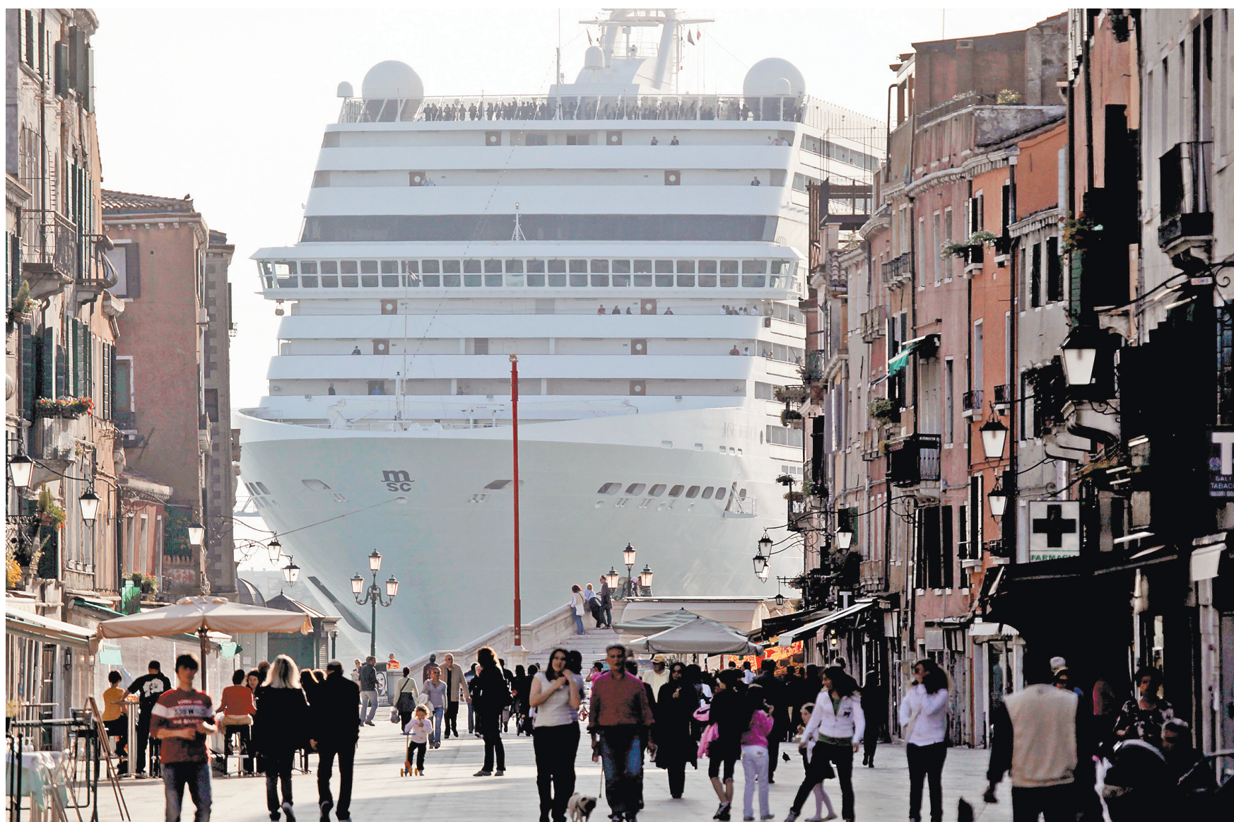
С 2020 года круизным лайнерам запретят заходить в Венецию. В прошлом это решение многократно откладывалась ввиду экономических причин — город ежегодно посещают 30 миллионов гостей и более 600 круизных судов. Теперь же власти решили действовать под влиянием местной общественности, которая, похоже, не собирается больше терпеть толпы туристов-однодневков и ставшие уже регулярными ЧП с круизными лайнерами, врезающимися в причалы и прогулочные катера. По словам министра инфраструктуры и транспорта Италии Паолы Де Микели, принять это решение было нелегко, но оно продиктовано «суровой необходимостью». Пока речь идет о временном запрете, который начнет действовать с нового года, но затем, как заверяет министр, будет принято окончательное волевое решение.

Тем временем, пока верстался номер стало известно, что фракция «Батькивщина» уходит в оппозицию правительству. Об этом заявила лидер партии Юлия Тимошенко, попутно обвинив украинского президента в пересечении «красных линий». «Мы объявляем оппозицию распродаже с молотка всех стратегических объектов собственности Украины, в том числе земли. Мы не разделяем такую политику», — заявила политик. Она также добавила, что намерена обжаловать принятие законопроекта в суде, сославшись на нарушения регламента. Помимо этого, «Батькивщина» подала представление в Конституционный суд страны для разъяснения 13 статьи конституции, согласно которой украинская земля является собственностью народа Украины.