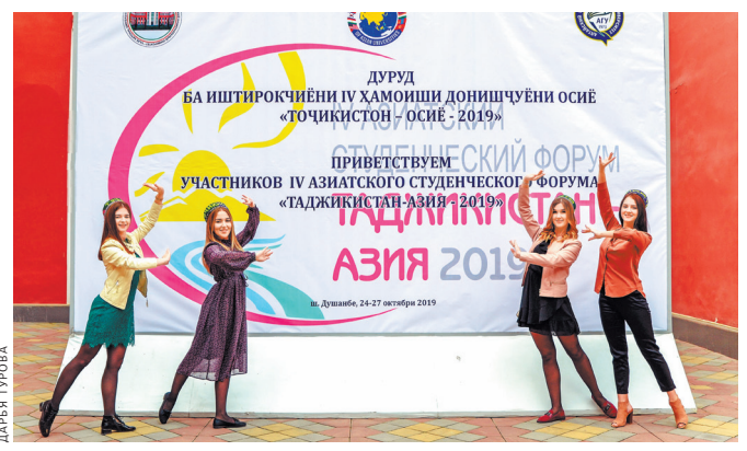
В IV Азиатском студенческом форуме приняли участие более 300 человек из 8 стран.