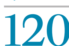
МЛЛИОНОВ тонн грузов в год должна составить пропускная способность БАМа

Информирование общественности и других участников оценки воздействия на окружающую среду на этапе уведомления, предварительной оценки и составления технического задания на проведение оценки воздействия на окружающую среду