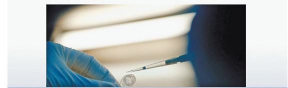
Вакцина-спирит из России «До финиша не решается никакая гонимая — и иногда побеждает те, кто не считался фаворитом. Что касается гонимых за вакциной, в настоящее время победа, что немаловажные победы, придут из России».