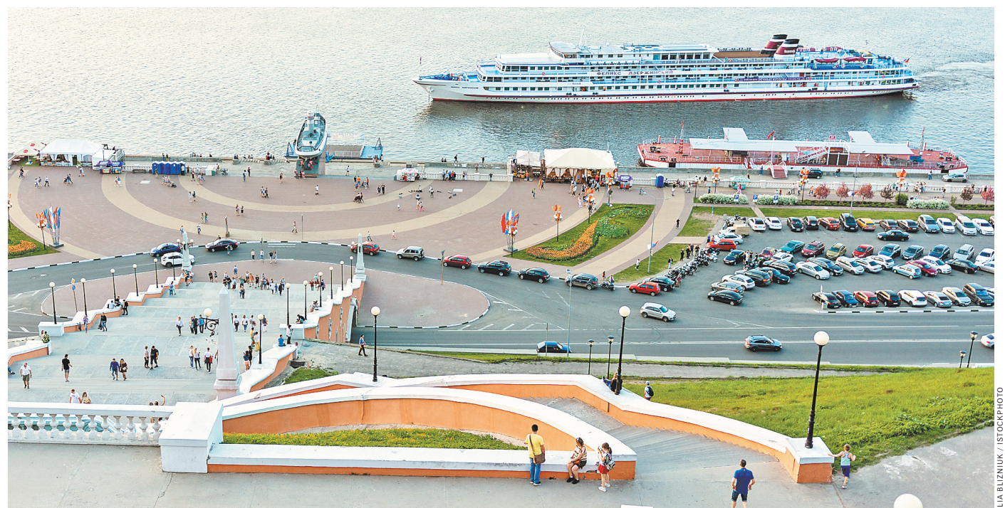
Красивая набережная в Нижнем Новгороде, да стоянка у причала дорого стоит. И некоторые круизные лайнеры проходят мимо, а туристов везут в Нижний на автобусах из Гордеева.

—Мы не можем себе позволить, чтобы дети наблюдались длительное время на территории лагеря в оздоровителе, —заявил руководитель управления Роспотребнадзора. По факту массового заражения детей в «Улыбке» следственное управление СК РФ по Ивановской области организовало доследственную проверку. В ведомстве уточнили, что устанавливается источник заражения, круг инфицированных, изучается документация учреждения. Свое санитарно-эпидемиологическое расследование проводит также региональное управление Роспотребнадзора. ●