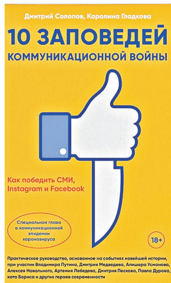
Для кого-то эта книга станет поводом понять, что всегда можно достигать успеха любым путем.