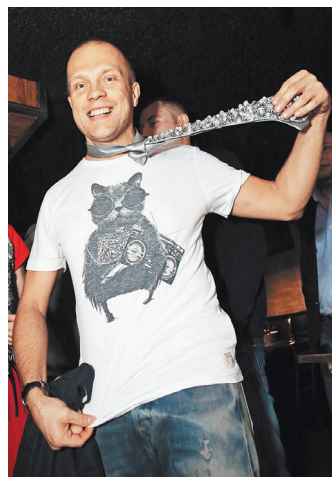
DJ Groove иногда играет и свои ремейки, порой ироничные, на грани с пародией.