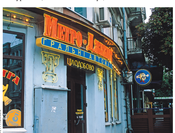
Возврат игровых автоматов, запрещенных с 2009 года, это одно из немногих выполненных обещаний Зеленского.

Впрочем, не факт, что даже подписанный Зеленским закон начнет работать. Национальное агентство по противодействию коррупции (НАПК) сразу после подписания документа Зеленским опубликовало список статей, которые гарантированно создадут лазейки для коррупции в сфере лицензирования, налогообложения и контроля игровых объектов.