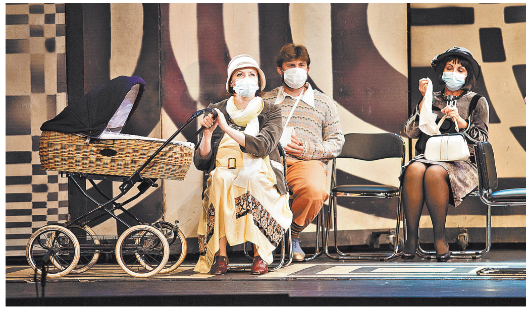
Зрители в зале, а иногда и артисты на сцене — в масках. Но все они друг друга прекрасно понимают.