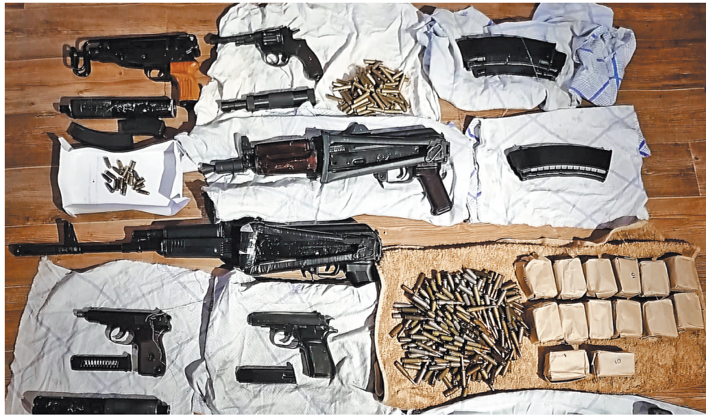
У членов ОПГ было изъято 10 боевых «стволов», 1200 боеприпасов и 3 глушителя для стрельбы.

Как сообщили корреспонденту «РГ» в Центре общественных связей ФСБ, в месте расположения нарколаборатории, в трех складских помещениях и в