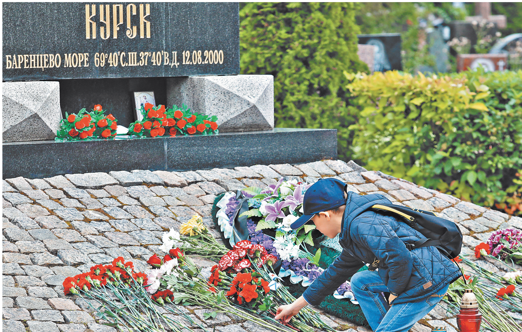
Вчера в Санкт-Петербурге, на базе Северного флота в Видяево, в Североморске, Севастополе, Калининграде и других городах России прошли памятные мероприятия, приуроченные к 20-летию гибели экипажа атомной подводной лодки «Курск». На траурных митингах говорили о мужестве и стойкости 118 моряков. Вспоминали их командира Героя России капитана первого ранга Геннадия Лячина. К монументам погибшим подводникам принесли венки, положили цветы. О подвиге экипажа «Курска» страна не забыла и не забудет никогда.

В «Делимобиле» согласны с тем, что настало время проработать ряд решений, направленных на повышение безопасности сервиса. В частности, компания разработала систему поощрения и мотивации водителей на безопасное и ответственное вождение. В режиме реального времени сотрудники каршеринга видят профиль и трекинг клиента и помогают ему в соблюдении скоростного режима, а в случае нарушения предупреждают уведомлениями, звонками и сообщениями вплоть до возможности блокировки его аккаунта в сервисе. «Это, конечно, крайние меры, но для нас вопрос безопасности является приоритетным», — говорят в компании. Мы понимаем, что люди, у которых был меньший разрыв между получением прав и вождением, более аккуратны за рулем. ●