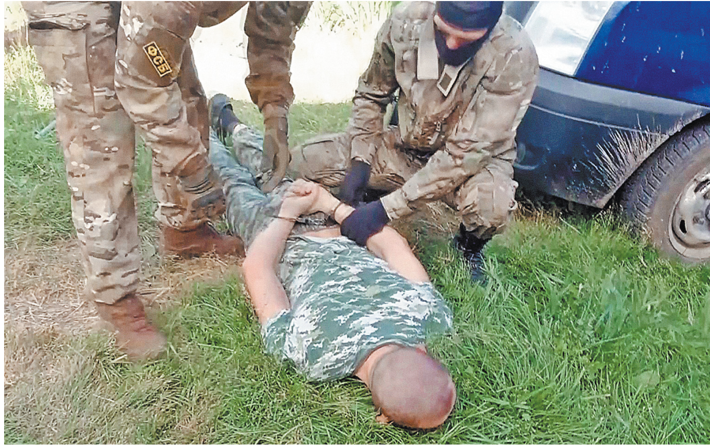
Задержанные бандиты сами опасны для здоровья производителей наркотиков не занимались. Это делали под угрозой расправы рабочие-мигранты.

«Что вы здесь делали мефедрон, амфетамин?» — спрашивал оперативник у подпольного рабочего. Тот отвечает, что не знает — просто все делали по инструкции. Действительно, на стенах лаборатории висели под-