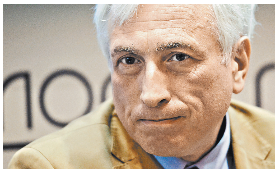
Леонид Млечин: Профессиональная журналистика — это индустрия, и ее необходимо поддержать.

В обществе есть мыслящие и неравнодушные люди, которым нужна адекватная информация. Потребность в профессиональной журналистике не исчезла. Мы видим появление новых журналистских структур, которые умело используют современные технологические возможности. Они сосредоточиваются на главном — на аналитической и расследовательской журналистике. И тем самым помогают зрителю, читателю, слушателю понять, что происходит в стране и в мире. И хорошо, что сегодня Instagram, WhatsApp и Facebook снова конкурируют между собой, что должно повысить спрос на высококачественную информацию. Но как сделать, чтобы доходы от рекламы вернулись в журналистику? ●