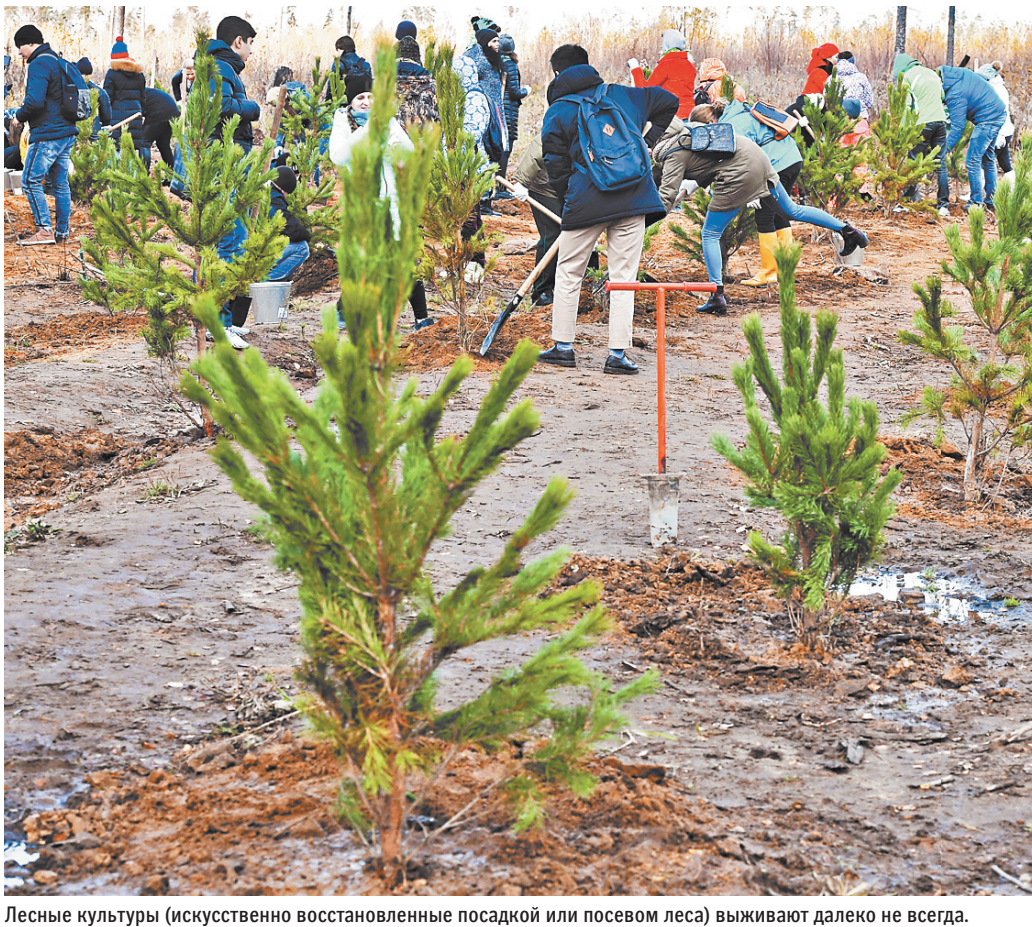
Лесные культуры (искусственно восстановленные посадкой или посевом леса) выживают далеко не всегда.