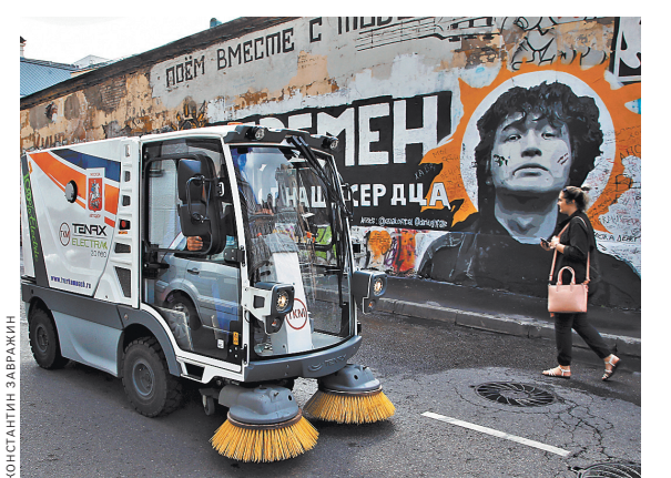
По мощности такой пылесос сопоставим с дизельными аналогами, только ест он электричество и не шумит.