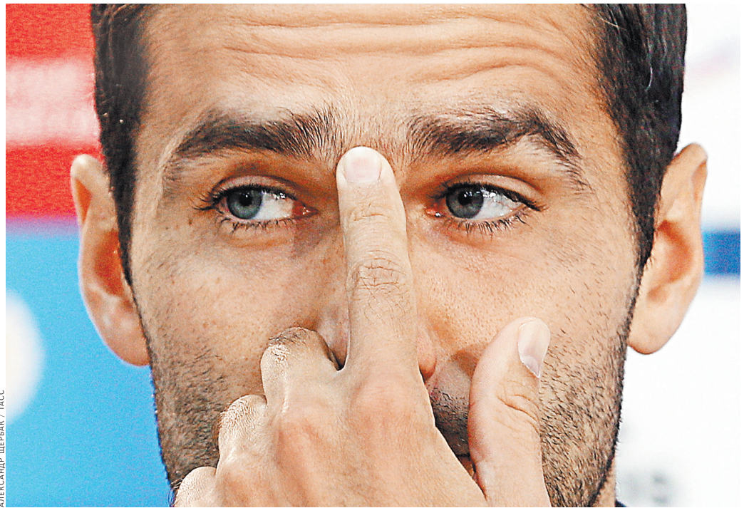
За избивание судью Роману Широкову может грозить уголовная ответственность.