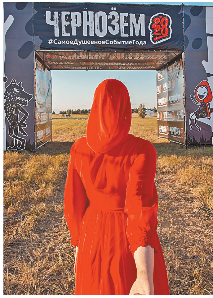
Первое массовое шоу в стране после коронавируса не состоится. Оно перенесено на следующий год.

Заявления с указанием банковского счета принимает ФНС, проше всего направить его через личный кабинет налогоплательщика или ИП. Можно также зайти на сайт ФНС, распечатать и направить по почте в инспекцию по месту нахождения организации или ИП. Оно рассматривается три рабочих дня. ●