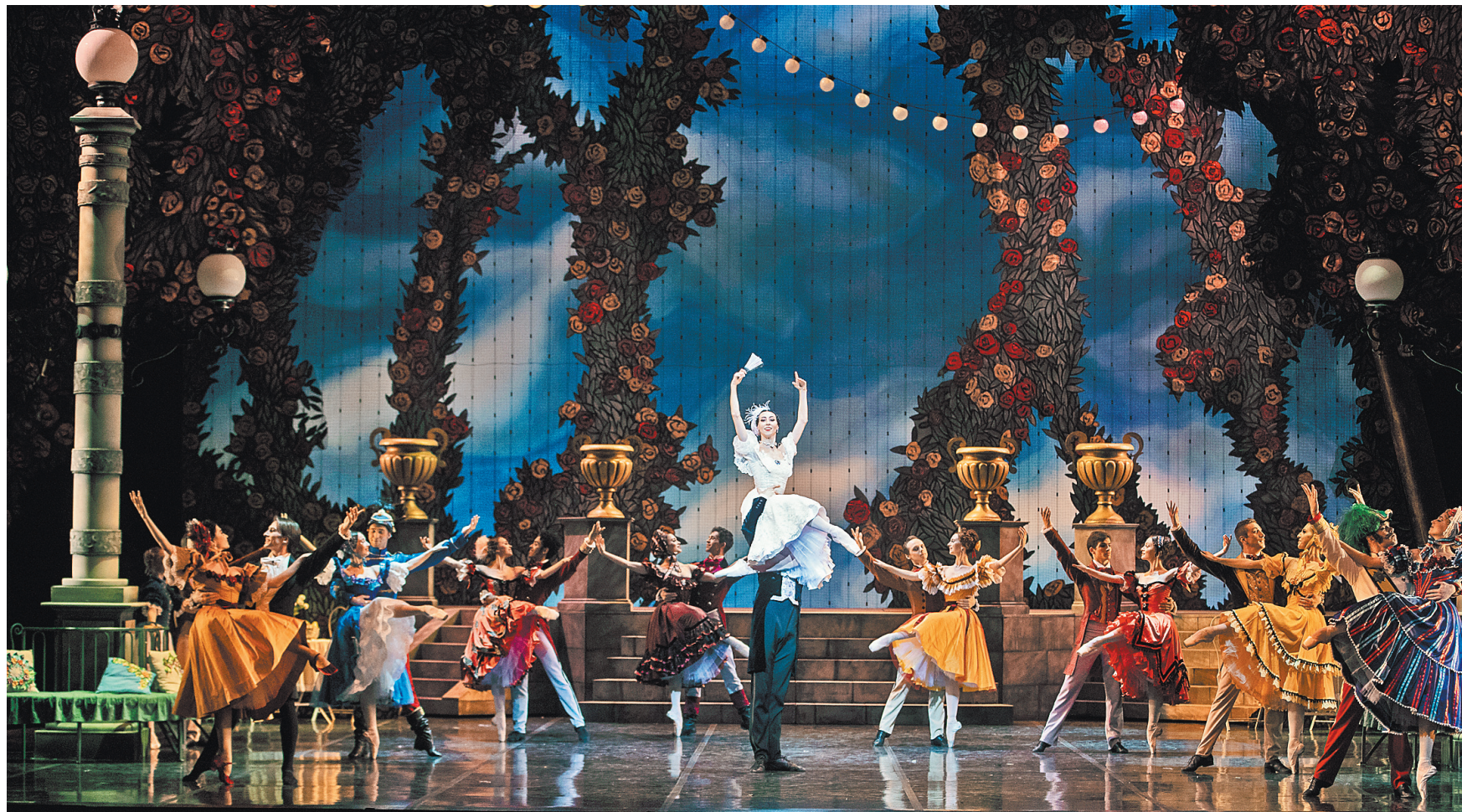
ПРЕСЛЕДОВАНИЕ САМАРСКИМ ТЕАТРОМ ОТЕЦ И ДЕТЯ