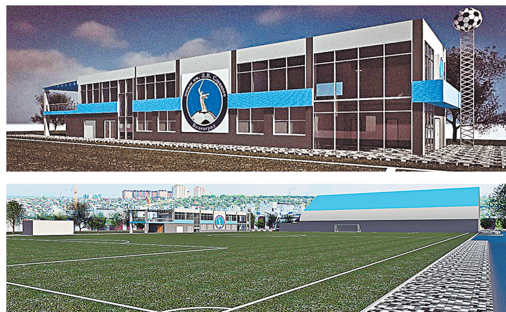
Каким будет новый стадион, сегодня можно увидеть на макете.