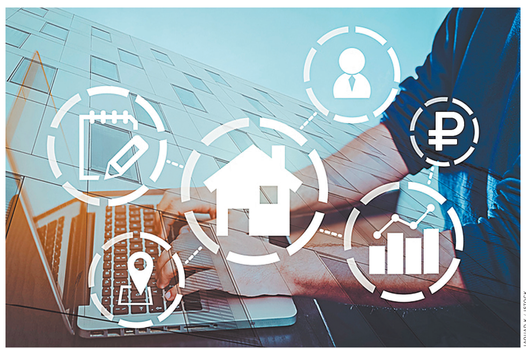
Новая система сокращает срок получения некоторых документов до нескольких минут.

Подготовили Ольга Игнатова, Марина Трубилина