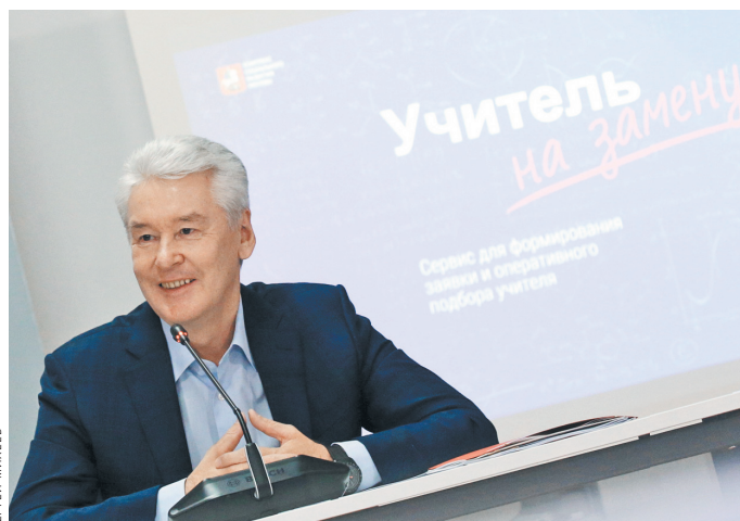
Мэр Москвы Сергей Собянин: Нам удастся прервать цепочки заболевания, не прибегая к тотальному закрытию города и сохраняя работу всех секторов экономики.

До конца ноября указом мэра решено продлить и домашний режим для пенсионеров 65+ и горожан, страдающих хроническими заболеваниями. ●