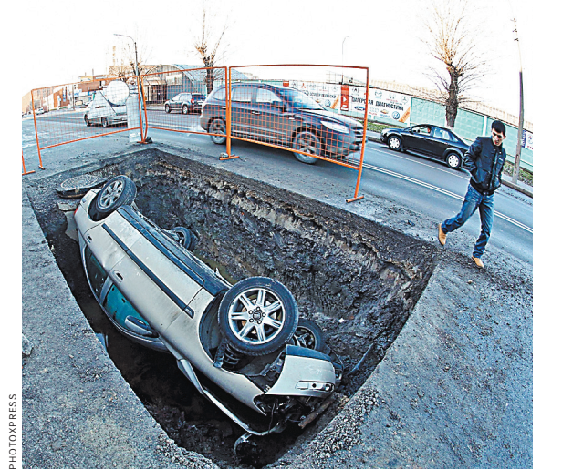
Повредившую машину в такой яме вправе требовать от дорожников компенсации ущерба.

Более 37,6 тысячи аварий с пострадавшими произошло с начала года из-за несоблюдения требований по эксплуатации дорог, в том числе из-за ям