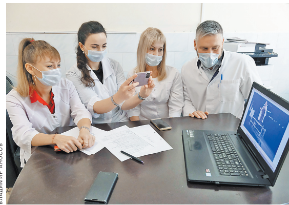
В основе спектакля — реальные события из жизни врачей краснодарской больницы скорой помощи.

В рамках хотим спектакля невозможно рассказать о каждом из тех, кто ежедневно возвращает людям здоровье и жизнь. «Аритмия человечности» — лишь малая часть большой истории, которая все еще пишется. И, как надеются авторы спектакля, после снятия всех ограничений он войдет в репертуар театра и будет идти на малой сцене. Пока же — его можно увидеть в онлайн-формате на сайте театра. ●