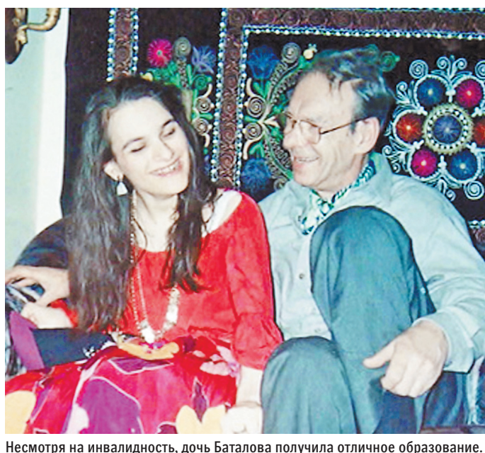
Несмотря на инвалидность, дочь Баталова получила отличное образование.

Всего же в прошлом году нотариусы России совершили более 46 миллионов нотариальных действий. Так что ошибки действительно единичны, как правило, хватает первой степени единичности.