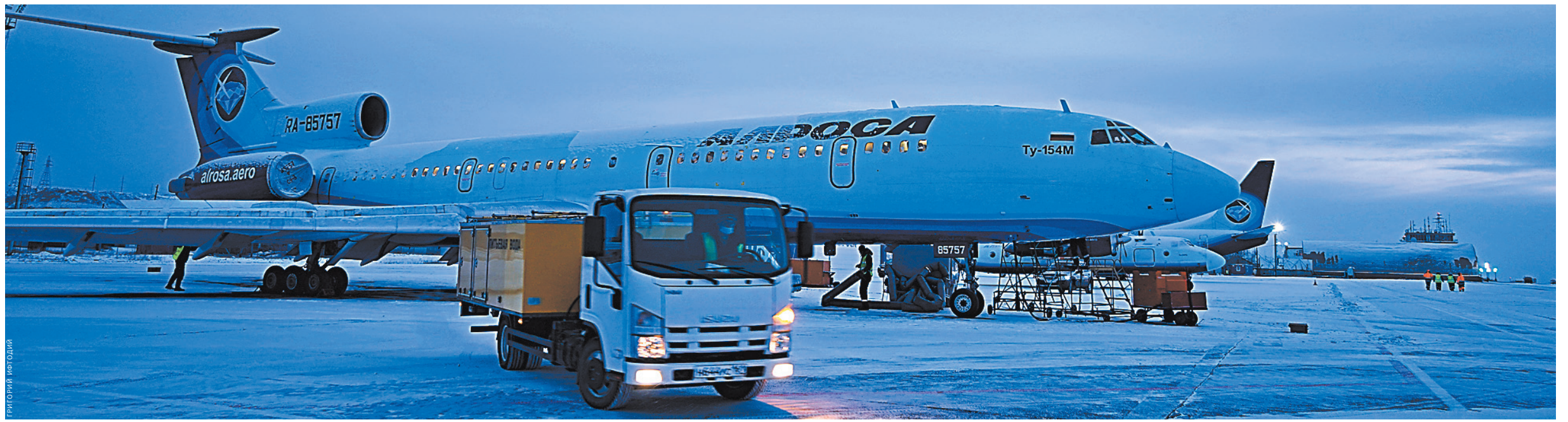
Подготовка к полету Ту-154 в аэропорту города Мирный (Якутия).

Он остро переживал за судьбу отечественной авиации, самолетостроения. Переживал за то, что наши гражданские самолеты могут быть вытеснены из мирового воздушного океана «боингами» и «эрбасами». Опасения оправдались: воздушные иномарки прочно прописались в российском небе.