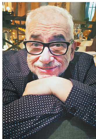
Михаил Яснов ушел, но еще при жизни заслужил имя классика детской поэзии.

Он охотно брался переводить непереводимое. И это не только тончайшие перемены смыслов Верлена и Кокто, но и детские песенки, ритмичные считалочки и рифмованные разговоры, перевести которые, в сущности, невозможно, можно только перевосоздать — и Михаилу Яснову удавалось это без малейшего видимого напряжения.