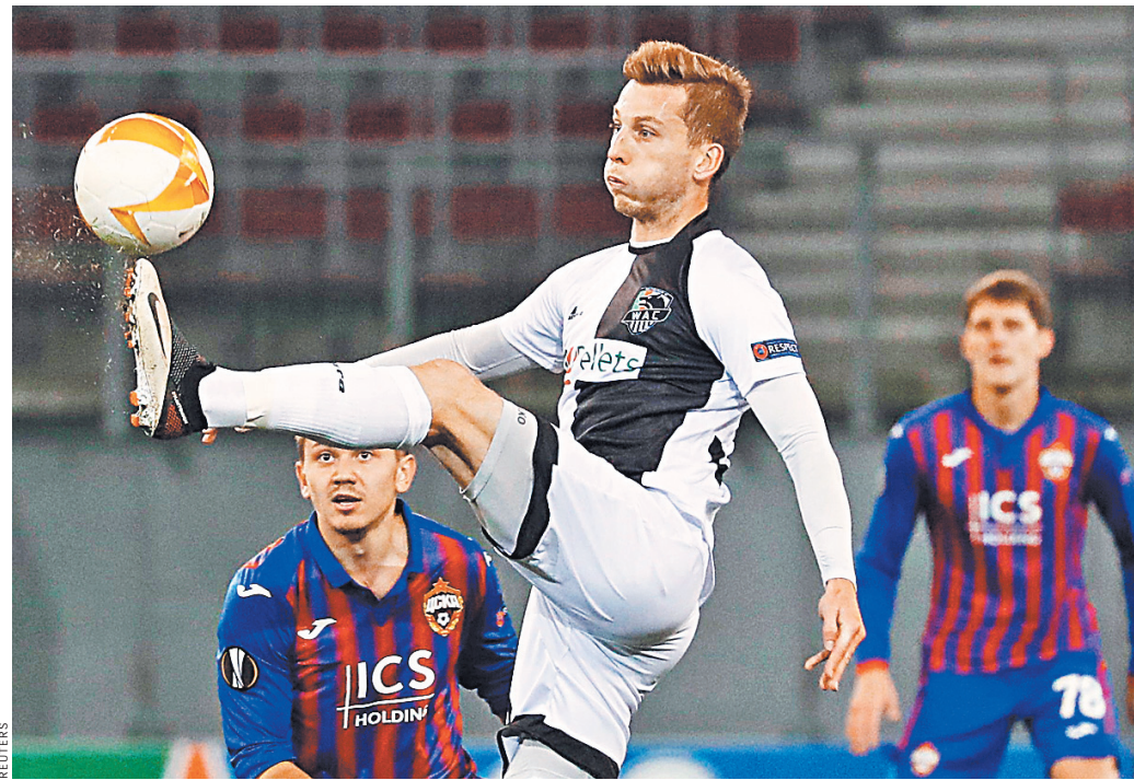
В матче первого тура группового этапа ЦСКА сыграл вничью в Австрии с «Вольфсбергом» (1:1).