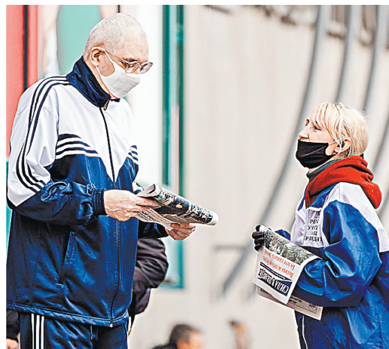
Накануне выборов на улицах Кишинэу агитация проходит спокойно, но после них эксперты не исключают протестов.

«И у Додона и Санду есть свои стабильные базы избирателей, и пока что у нынешнего президента больше шансов сохранить пост, чем у Санду — зная его. Хотя Ренато Усачий и Андрей Настасе отвлечут на себя какое-то количество электората двух лидирующих кандидатов. В отличие от Додона Санду ограничена в привлечении новых сторонников, поскольку примерно половина населения страны не разделяет его довольно агрессивного стремления к сближению с Румынией. Однако для Санду нынешние выборы — последний шанс остаться в большой политике, поэтому она станет бороться всерьез. Что касается второго тура выборов, то на почти наверняка будет. Интрига здесь в другом — не произойдет ли между двумя турами каких-то событий, которые смогут существенно изменить картину. Протесты будут почти наверняка. Другое дело, что значительная часть активной молодежи, выходящая на улицы в 2016 году, сейчас уехала из Молдавии, а вернуться при коронавирусных ограничениях будет проблематично.»